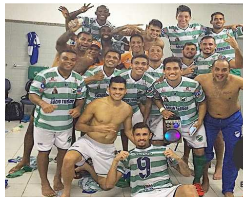
Jogadores do Altos-PI comemoraram vitória no vestiário