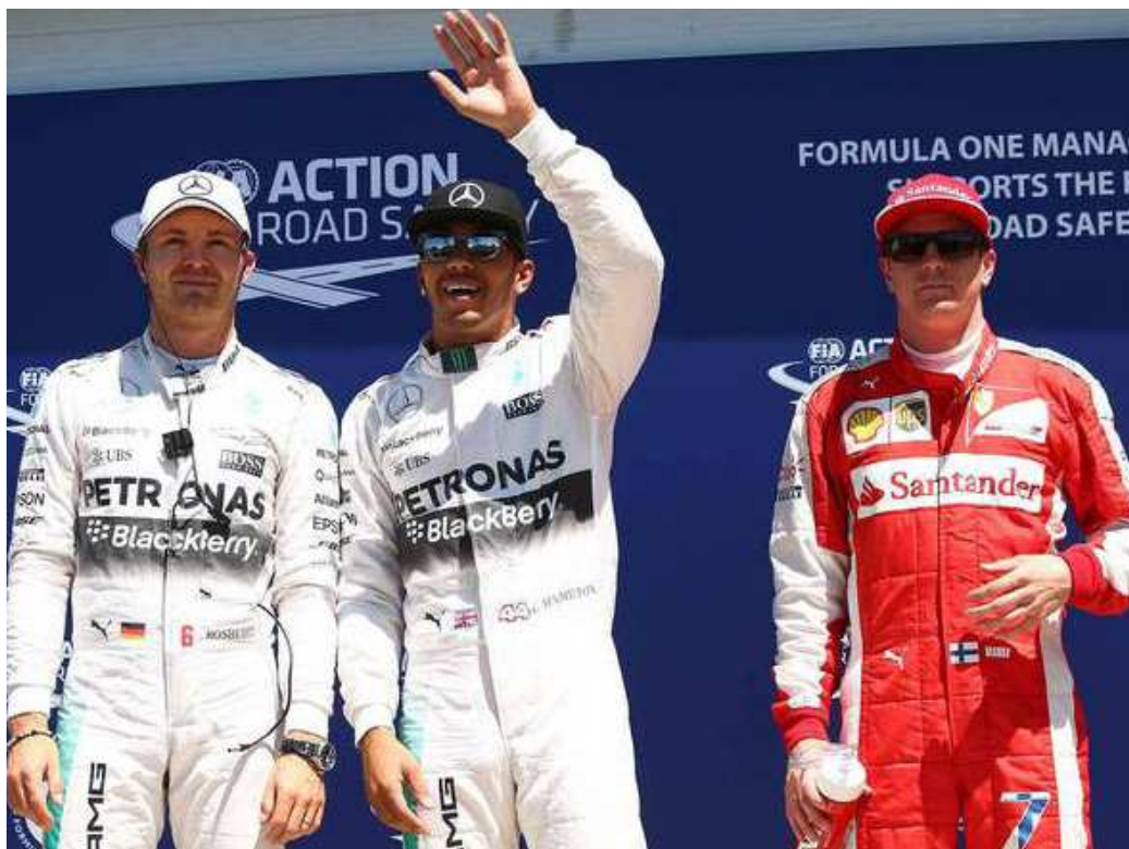
Hamilton (ao centro) acena para a torcida, depois de vencer a corrida de ontem no Canadá

O GP também não foi bom para os brasileiros: Felipe Massa abandonou na metade da prova, com problemas na unidade de potência de sua Williams: as temperaturas subiram demasiadamente e a equipe decidiu chamá-lo ao box. Enquanto isso, seu companheiro, Valtteri Bottas, surpreendeu ao levar a Williams ao pódio. Felipe Nasr, por sua vez, rodou logo no início, perdeu tempo, e andou o tempo todo no final do pelotão.