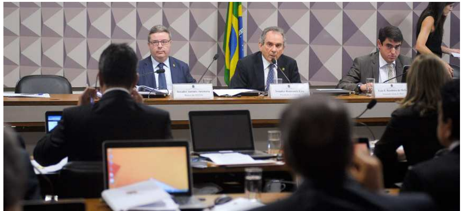
Integrantes da Comissão ainda não divulgaram data da oitiva dos outros seis nomes sugeridos para depor. Oitivas podem ser concluída até dia 20

A etapa de oitivas, conforme calendário aprovado na comissão, está prevista para ser concluída até 20 de junho, mas poderá ser prorrogada, caso seja preciso mais tempo para que os senadores ouçam todas as testemunhas arroladas.