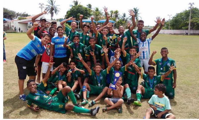
Garotada do Bom Pastor vibra com a conquista do título