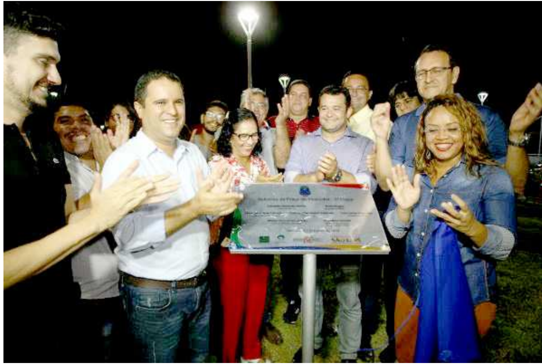
A obra foi entregue à população durante solenidade realizada no último sábado, com a presença do prefeito

A segunda etapa do projeto de requalificação da Praça do Pescador ganhou reforço também do Instituto de Paisagem Urbana (Impur) que,