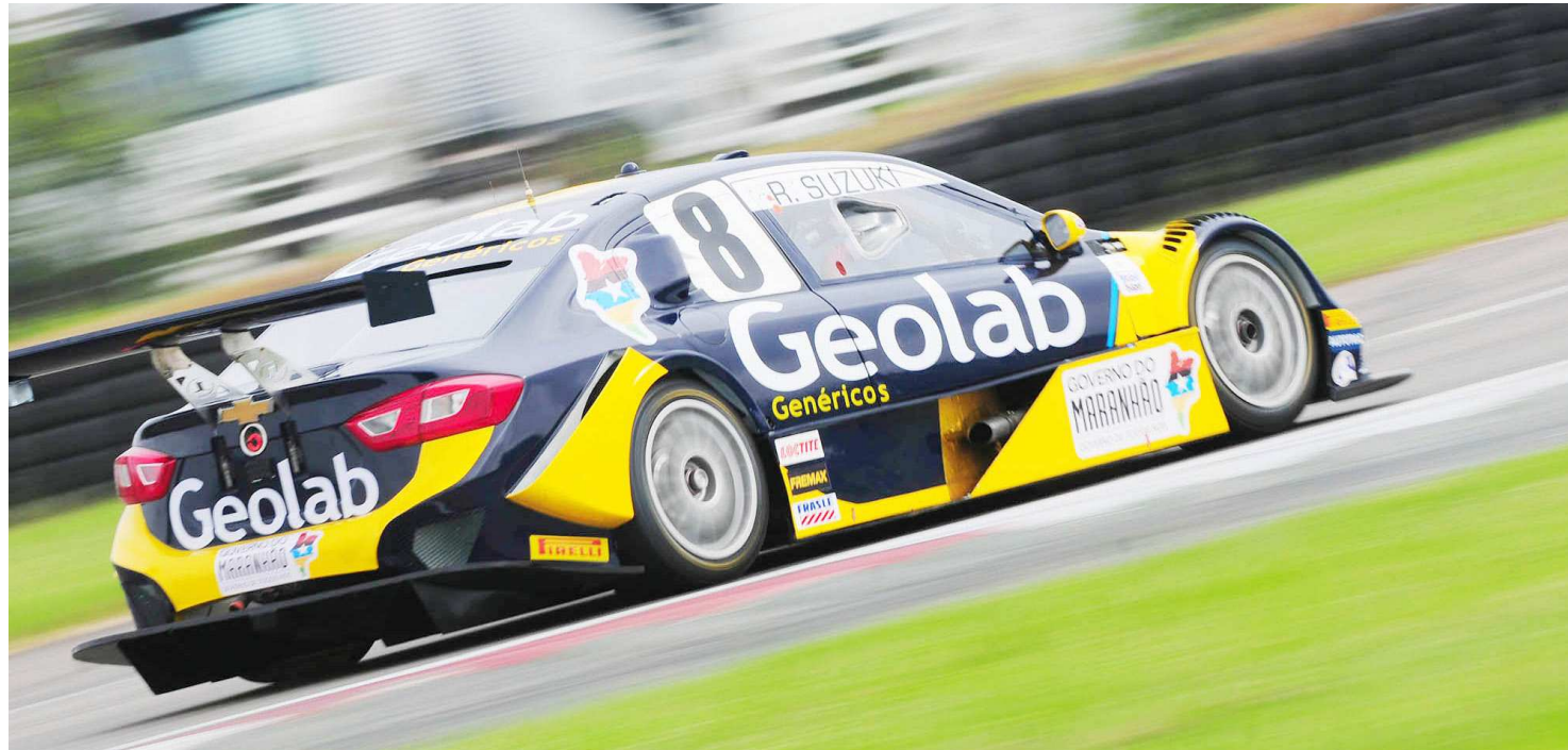
Rafael Suzuki encara um dos circuitos com maior média de velocidade da temporada no Autódromo de Tarumã, no Rio Grande do Sul