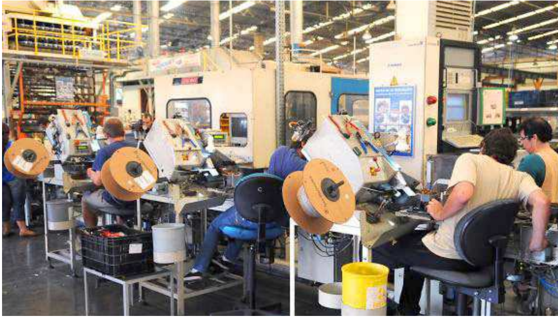
Indústria teve uma pequena alta que deve refletir positivamente nos outros setores da economia do Brasil

Segundo a análise do pesquisador da FGV, “as condições