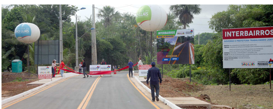
Ponte Pai Inácio é uma das principais obras para melhoria do trânsito na região metropolitana de São Luís