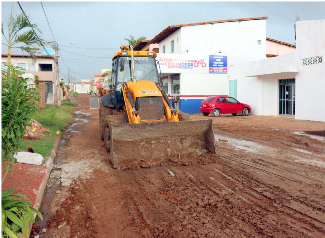
Obras no retorno da Forquilha devem facilitar a vida de uma boa parte dos moradores da região

Com investimento de R$ 8 milhões, o projeto prevê que as modificações levem benefícios aos moradores de São Luís, Paço do Lumiar, São José de Ribamar e Raposa. A rotatória da Forquilha passará a ser um cruzamento que vai facilitar o trânsito de quem segue em direção a São José de Ribamar. Terá passagem livre também quem estiver em São José de Ribamar indo em direção ao Centro de São Luís, e quem estiver no Centro da capital terá acesso livre no sentido Cohatrac.