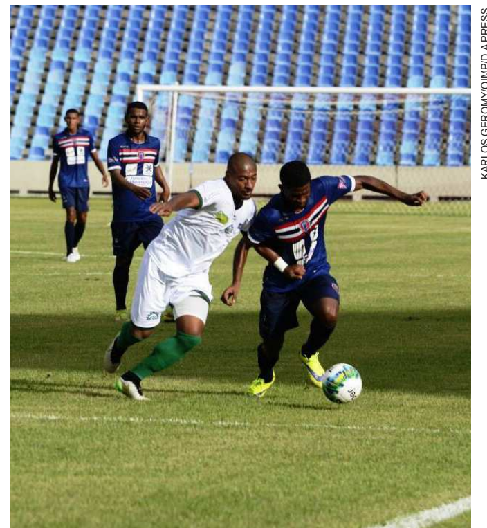
MAC tem poucas chances, mas ainda sonha com classificação