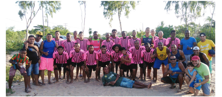
O time do Maroca está classificado para as semifinais