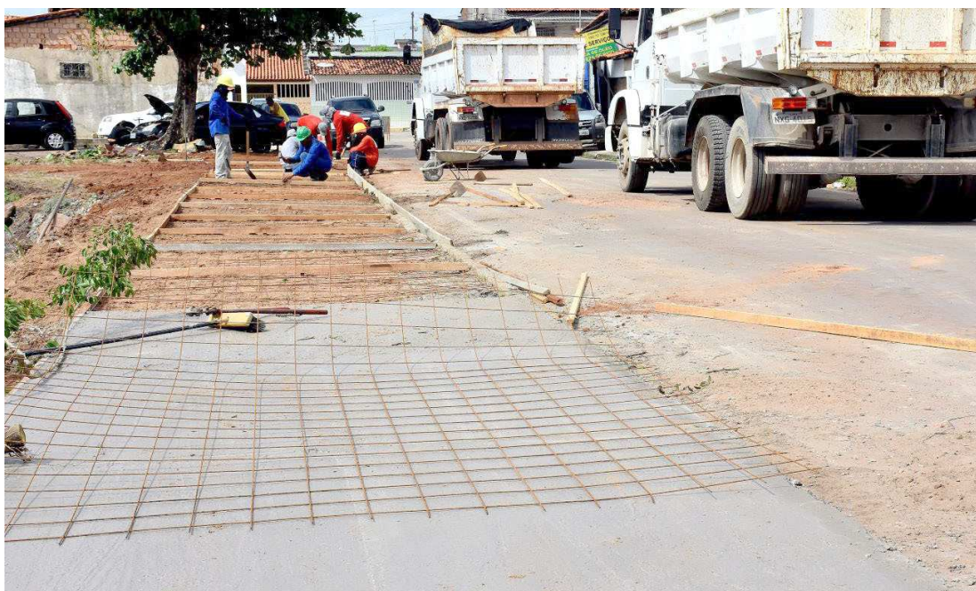
Urbanização dos arredores do canal do Cohatrac deve melhorar a vida dos moradores da região

No local, os serviços relativos à instalação das tubulações de drenagem e construção das galerias já foram concluídos. Os trabalhos vão entrar agora na etapa de finalização com terraplanagem e, posteriormente, será executado o