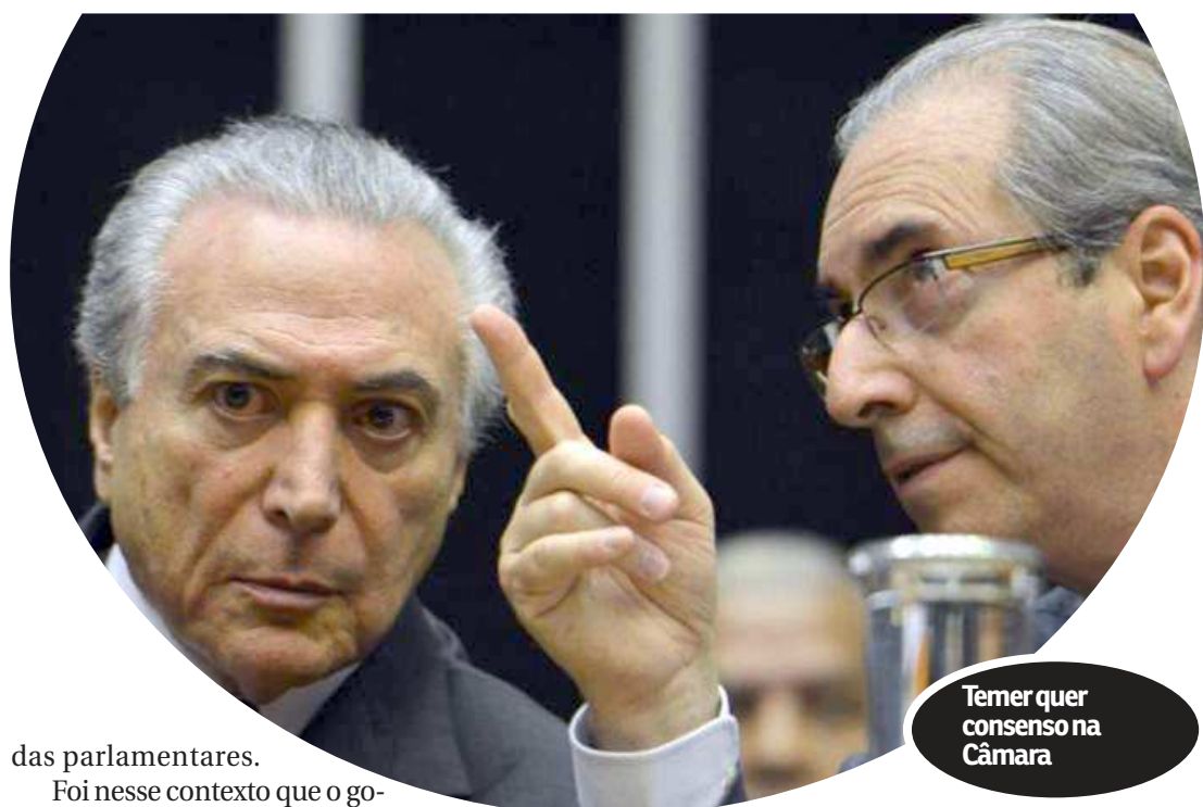
Temer quer consenso na Câmara

Para integrantes da legenda, diante da pulverização de candidaturas, o partido também tem o direito de reivindicar a vaga. Ainda mais por ser a maior bancada da Câmara, com 66 deputados. No entanto, por três das candidaturas, há a necessidade de parte do grupo demonstrar insatisfação com o governo Temer por demandas represadas, como a não indicação de cargos de segundo e terceiro escalões e o baixo índice de liberação de emen-