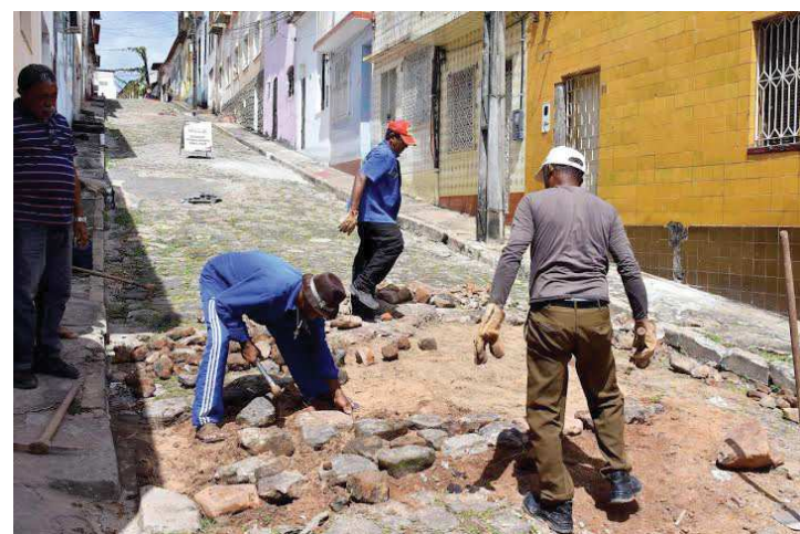
Operários estão trabalhando na limpeza e recuperação do calçamento