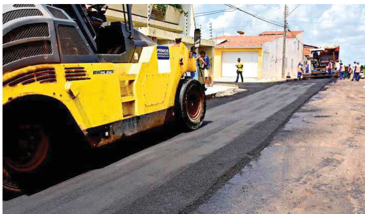
Serviços de pavimentação contemplam ruas que estavam deterioradas

Os bairros do Caratatiua e Alemanha receberam, ontem, novas frentes de trabalho para requalificação asfáltica de ruas. A ação, da Prefeitura de São Luís, integra o conjunto de obras de infraestrutura urbana executadas em bairros como Areinha, João Paulo e Coroado, que compõem a região central da capital.