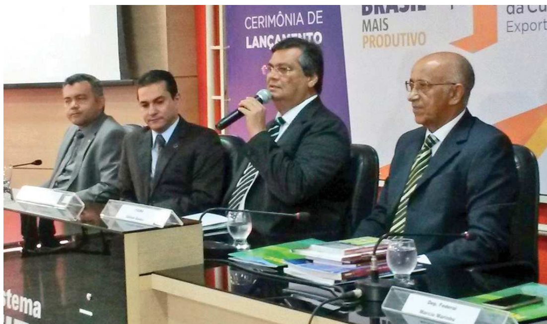
Governador Flávio Dino e ministro do Desenvolvimento, Indústria e Comércio, Marcos Pereira, abriam evento

O programa, que é realizado em todo o país, se baseia na redução dos sete tipos de desperdícios (superprodução, tempo de espera, transporte, excesso de processamento, inventário, movimento e defeitos). A iniciativa prevê o investimento em quatro setores prioritários: Alimentos e Bebidas; Metalmeccânico; Moveleiro; Vestuário e Calçados.