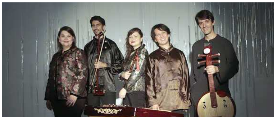
Festival de Música Barroca de Alcântara leva integração entre culturas através da música

Segundo a organização do Festival, o tema deste ano foi escolhido com o intuito de "homenagear a música hispano-andaluza", nascida com a mistura de gêneros árabes e latinos no século VII com a ocupação árabe na Península Ibérica e que tem influenciado a música da