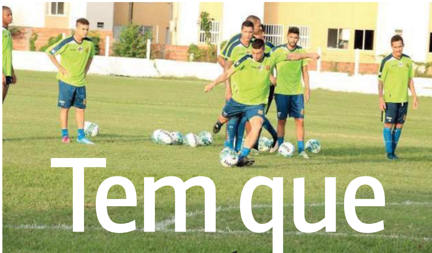
SAMPAIO CORRÊASITE OFICIAL