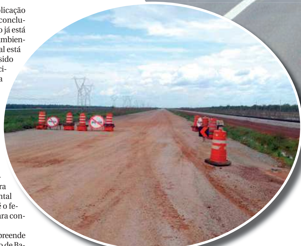
Segundo trecho da obra aguarda a licença ambiental expedida pela Secretaria Estadual de Meio Ambiente

Quanto ao trânsito, o Dnit disse que só poderá saber o quanto será afetado depois que a licitação for concluída, quando um cronograma de serviços será acordado entre o órgão e a empresa que vencer o processo. Segundo a assessoria, o trânsito será coordenado de forma a "minimizar os impactos durante o período de execução das obras".