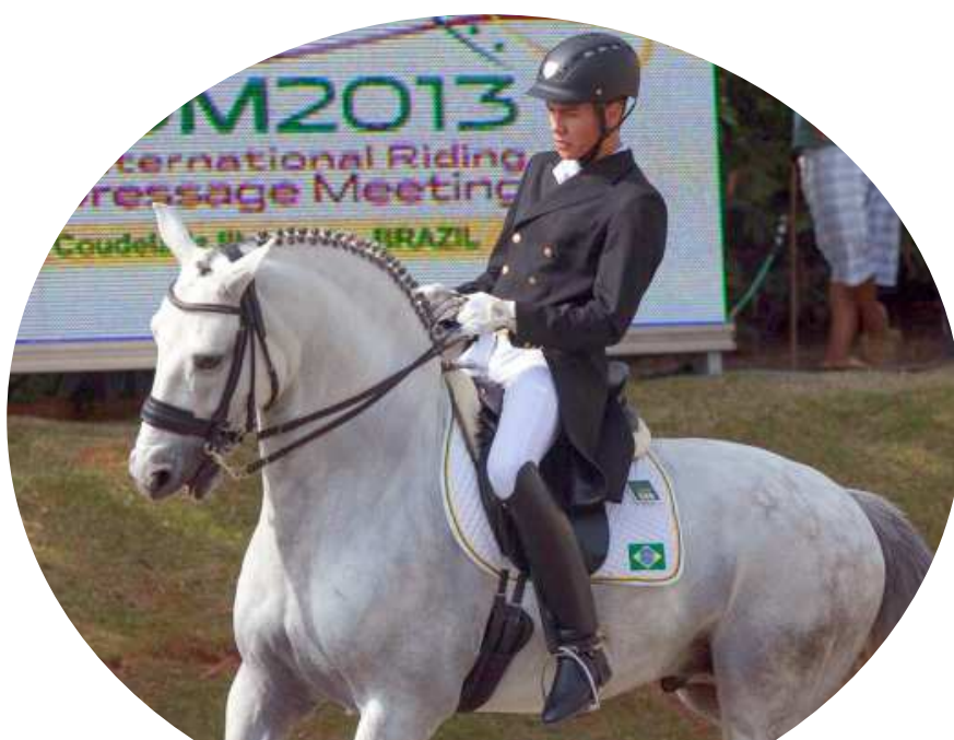
Competidores brasileiros fracassaram

A nota brasileira ficou bem atrás das primeiras colocações. A liderança do primeiro dia ficou com a Alemanha, com 79.157, seguida da Holanda, com 75.271, e da Grã-Bretanha, com 74.921.