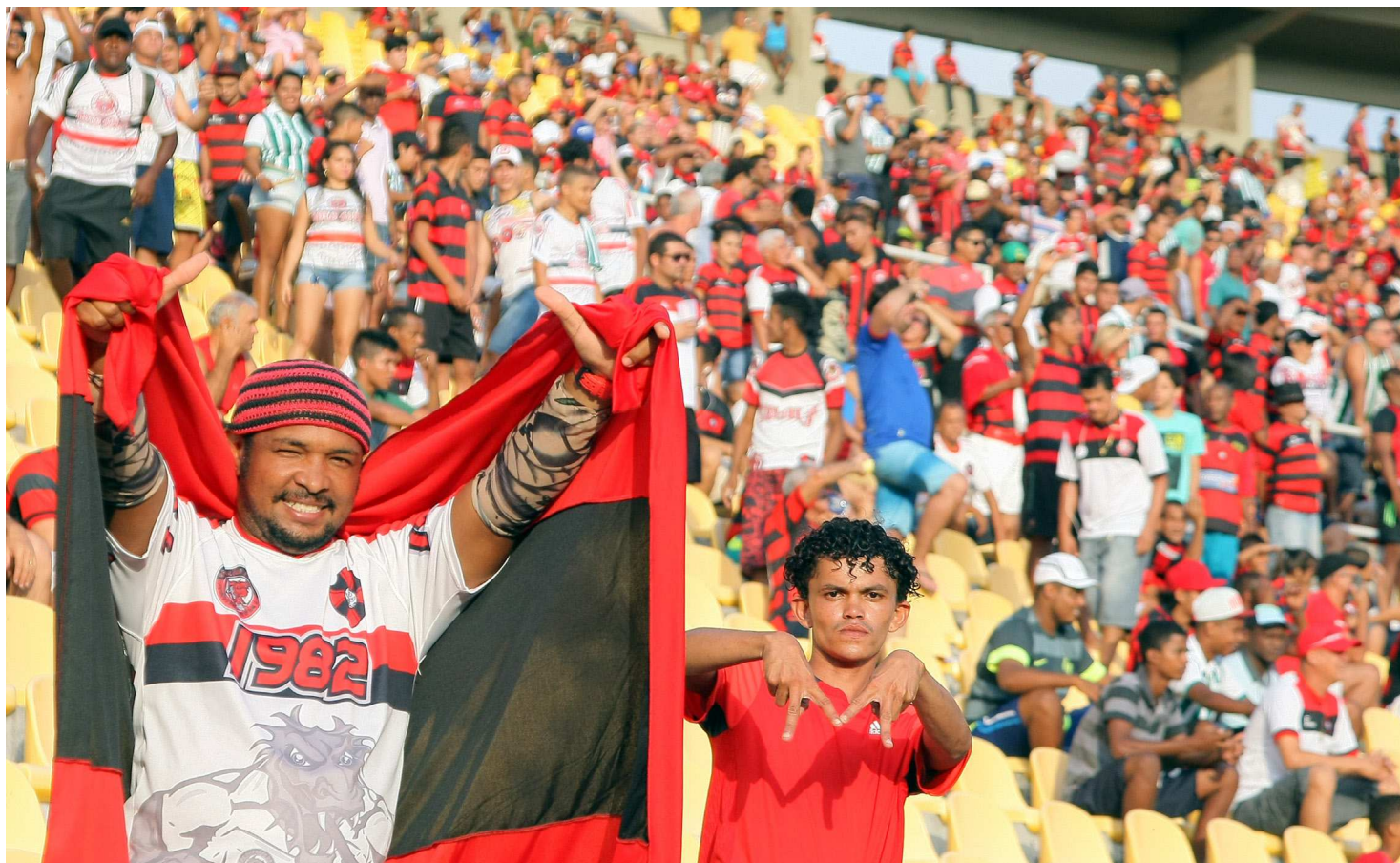
Torcida está sendo chamada para prestigiar o jogo de domingo contra o Juazeirense. No Dia dos Pais, sorteio de duas motos