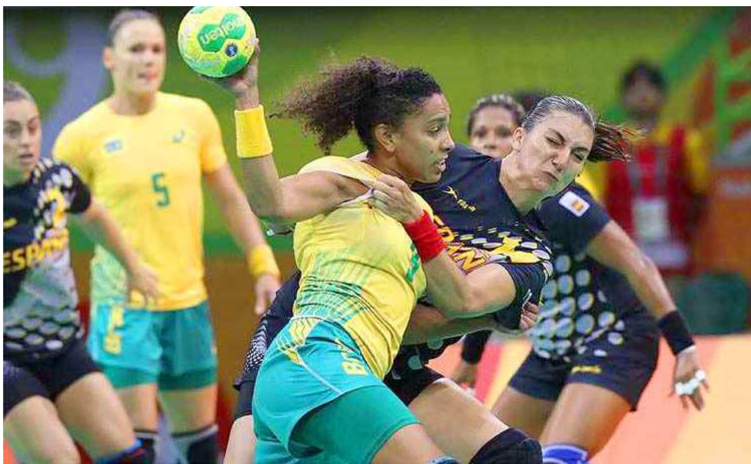
Brasileiras sofreram forte marcação e não conseguiram superar as espanholas no torneio de handebol dos Jogos Olímpicos do Rio

A seleção feminina de handebol levou um susto ao pisar na Arena do Futuro pela terceira