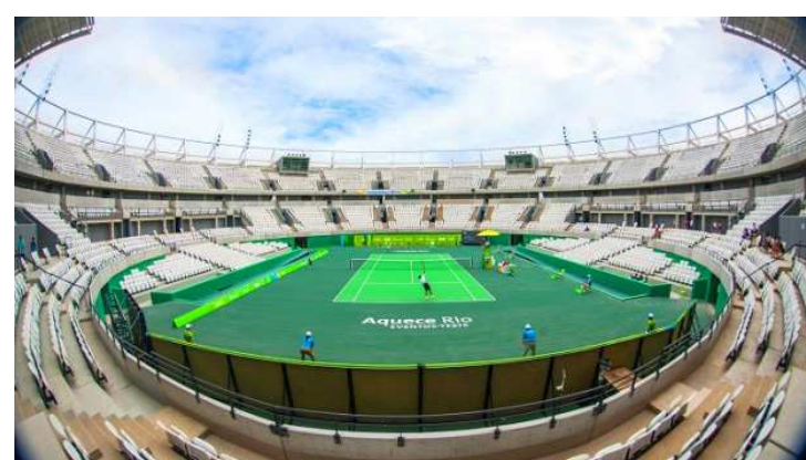
Quadra principal do Centro Olímpico de Tênis, no Rio

Os confrontos não serão alterados, mas é possível que haja duas rodadas no mesmo dia, porque a organização não pretende mudar o calendário das partidas finais. Estavam previstas para ontem três partidas do tenista espanhol Rafael Nadal, número 5 do mundo e um dos favoritos à medalha de ouro no torneio olímpico. Ele enfrentaria o francês Gilles Simon pela chave de simples masculina, depois jogaria as duplas masculinas.