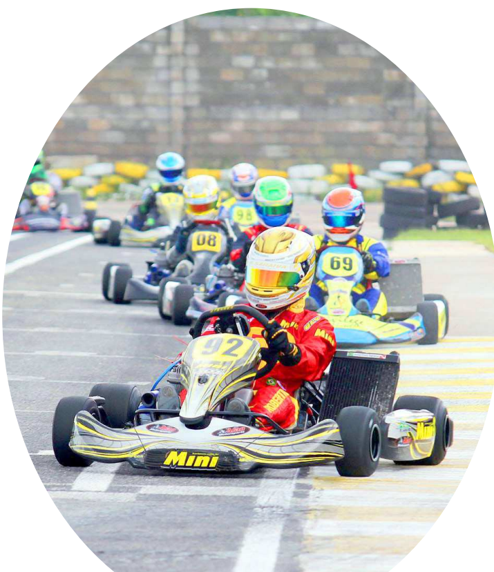
Kart reúne centenas de pilotos

Os treinos para o Norte Brasileiro de Kart aconteceram até ontem. Hoje, serão realizadas a tomada de tempos e a 1ª bateria. No sábado, a 2ª bateria classificatória será disputada antes da grande final, que define todos os campeões, que levam troféus e muitas premiações, que somam mais de R$ 250 mil.