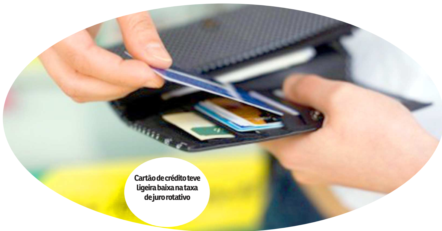
Cartão de crédito teve ligeira baixa na taxa de juro rotativo