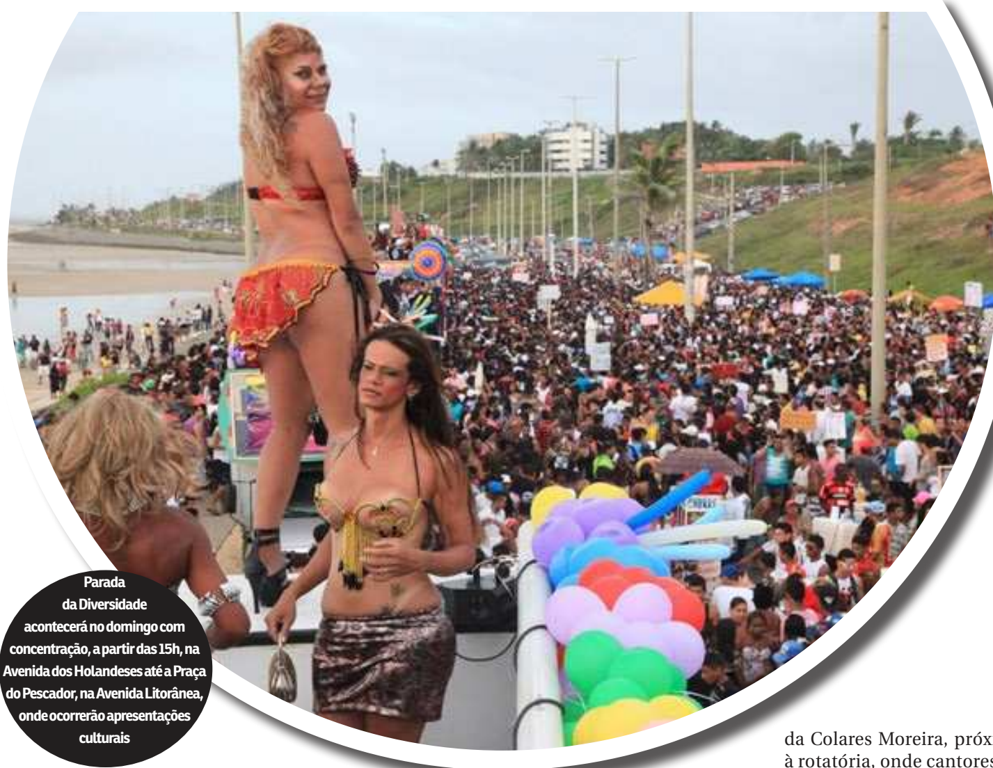
Parada da Diversidade acontecerá no domingo com concentração, a partir das 15h, na Avenida dos Holandeses até a Praça do Pescador, na Avenida Litorânea, onde ocorrerão apresentações culturais