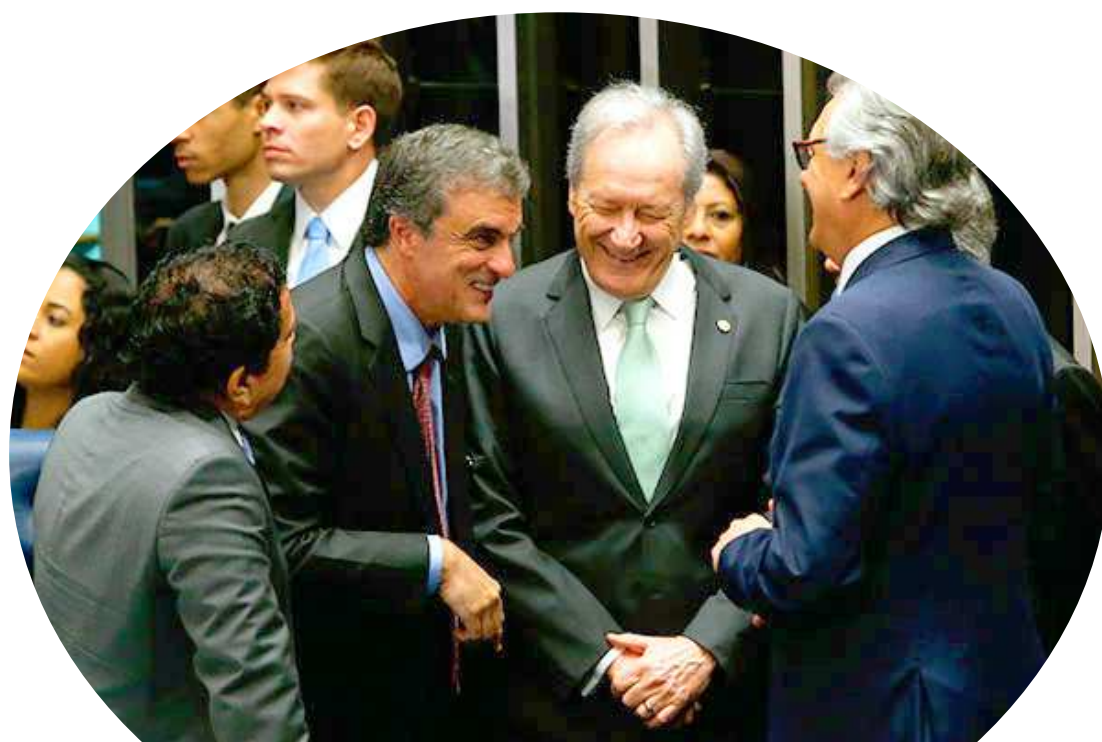
Ricardo Lewandowski foi responsável por abrir a sessão de julgamento no Senado