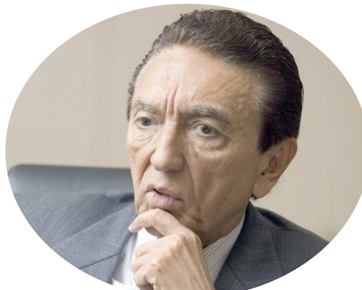
Senador Edison Lobão não deve ser julgado no STF

No início de julho, Zavaski já tinha negado o pedido da defesa de Eduardo Cunha em quebrar o sigilo telefônico de Lobão durante as investigações da Lava-Jato. Para Teori, não havia elementos que justifiquem a quebra de dados de Lobão. “Não se verifica situação de imprescindibilidade do afastamento de sigilo de terceiro, senador da República, que não é investigado nesta ação penal, para “desconstruir possíveis conjecturas” (fl. 3.037v.) sobre suposta ligação telefônica narrada em depoimento em colaboração premiada, que, por sua vez, não é determinante para comprovar os fatos narrados na denúncia”, disse o ministro.