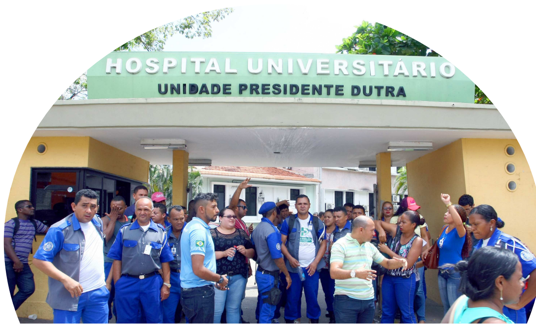
Manifestantes entraram em acordo com a direção do hospital, mas futuro da empresa terceirizada é incerto