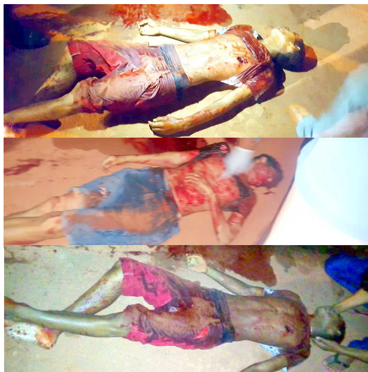
As vítimas foram assassinadas com tiros de espingarda de grosso calibre

Municipal de Açailândia. Lucas não corre risco de morte. Cerca de 10 minutos depois, outras duas pessoas foram executadas também com tiros com arma de grosso calibre. Os assassinatos aconteceram na Rua Lamente Junior, na Vila Maranhão.