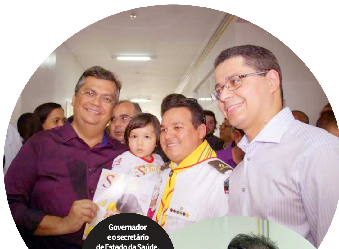
Governador e secretário de Estado da Saúde, Carlos Lula, inauguram unidade hospitalar que atenderá milhares de pessoas