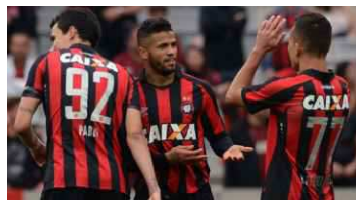
Jogadores do Atlético Paranaense encontraram muita facilidade