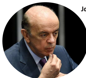
José Serra (PSDB-SP)

O governador de São Paulo, contrariando todo o partido, escolheu o empresário João Dória para concorrer à prefeitura de São Paulo. Se der certo, ganha moral interna. Alckmin é um dos pré-candidatos ao Planalto para 2018, podendo sair pelo PSDB ou pelo PSB.