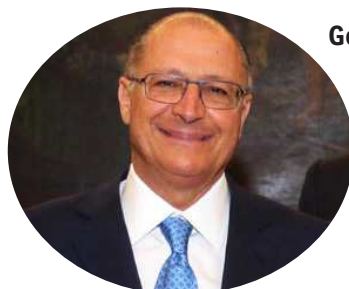
Geraldo Alckmin (PSDB-SP)

Em situação um pouco mais delicada está o atual prefeito do Rio, Eduardo Paes (PMDB). Paradoxalmente, ele sobreviveu, em tese, ao seu maior teste: as Olimpíadas e as Paralimpíadas. Os jogos foram um sucesso de crítica, com disputas emocionantes, e nenhum incidente grave. Mas Paes vê o seu candidato à prefeitura, Pedro Paulo, patinando nas intenções de voto. A disputa é liderada, com folga, por Marcelo Crivella (PRB), e a segunda vaga está em aberto, com cinco candidatos na disputa. O próprio Pedro Paulo, Jandira Feghali (PCdoB), Marcelo Freixo (PSol), Flávio Bolsonaro (PSC) e Índio da Costa (PSD). Paes sonha com o governo estadual em 2018 e o Planalto, a médio prazo.