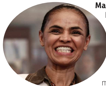
Marina Silva (Rede)

Trabalhou para emplacar Andrea Matarazzo como vice na chapa de Marta Suplicy, em São Paulo. Caso a peemedebista ganhe, mostra que tem força no PSDB, pois parte do tucanato abandonou Dória. De quebra, faz uma média com o PMDB. É pré-candidato ao Planalto pelo PSDB, mas pode migrar para o PMDB ou até mesmo para o PSD.