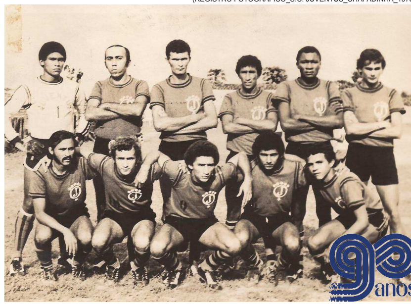
(REGISTRO FOTOGRAFICO_S.C. JUVENTUS_CHAPADINHA_1978)