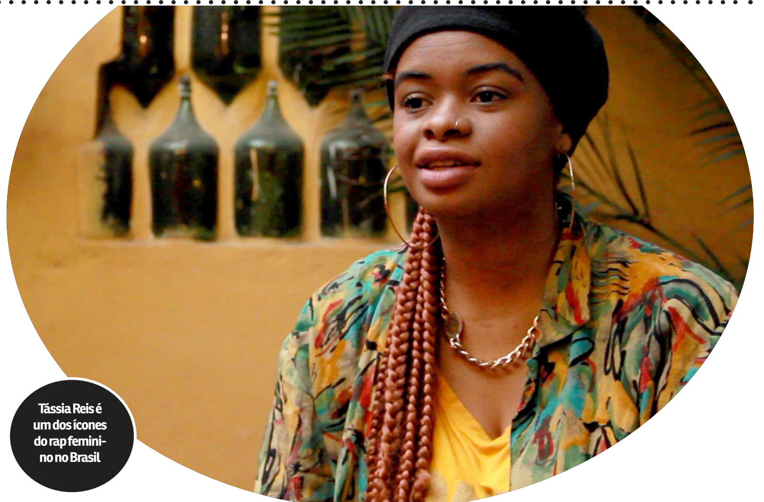
Tássia Reis é um dos ícones do rap feminino no Brasil