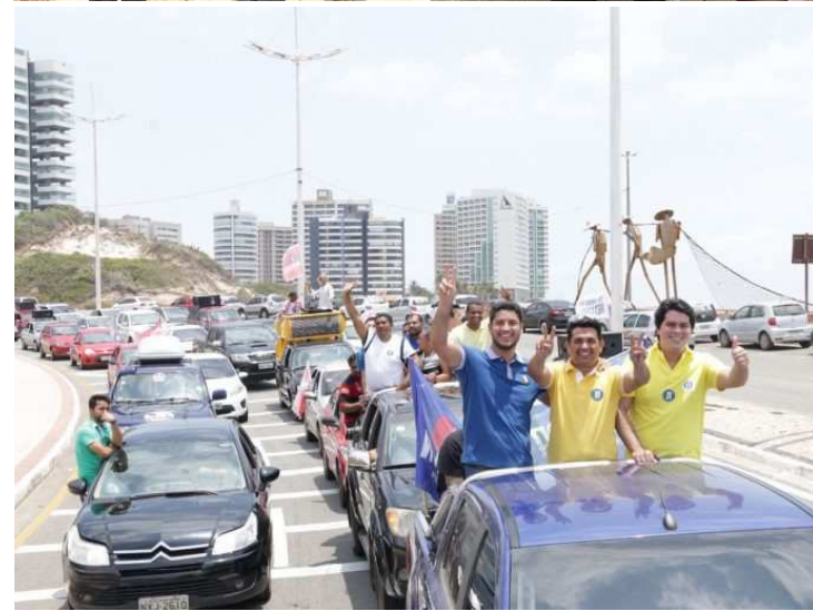
Candidatos a prefeito e a vereador fazem campanha nas praias da Ilha