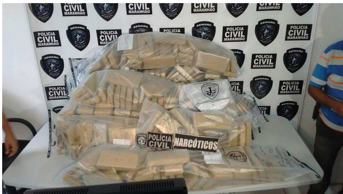
A maconha, segundo dados da Senarc, segue como a droga traficada em maior quantidade no Maranhão

A maconha segue como a droga traficada em maior quantidade. Isso se deve ao valor, que bem mais baixo, comparado à cocaína; e ao poder viciante, bem menor, comparado ao crack. Este ano, a maconha foi responsável por cerca de 59% das apreensões. Foram cerca