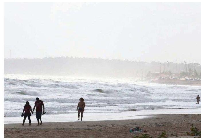
Em laudo divulgado pela Sema, as praias estão liberadas para banho