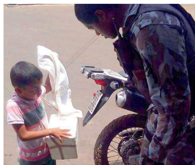
Os policiais que atenderam à ocorrência foram homenageados