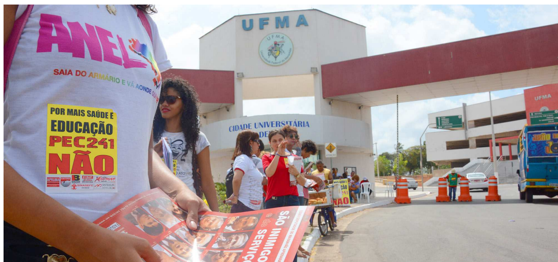
Para manifestantes aprovação da PEC hoje impactará diretamente no Ensino Superior público em todo o país