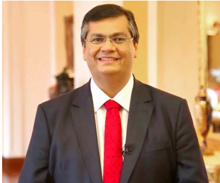
Flávio Dino apareceu em programa eleitoral de Edivaldo Júnior

O governador utilizou sua conta no Twitter, no final da tarde de ontem, para fazer sua declaração de apoio. "Reconheço a dedicação e os resultados da atual gestão e por isso no domingo votarei na chapa Edivaldo-Julio Pinheiro. Eu voto 12", disse na rede social de microblogs.