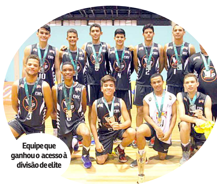
Equipe que ganhou o acesso à divisão de elite