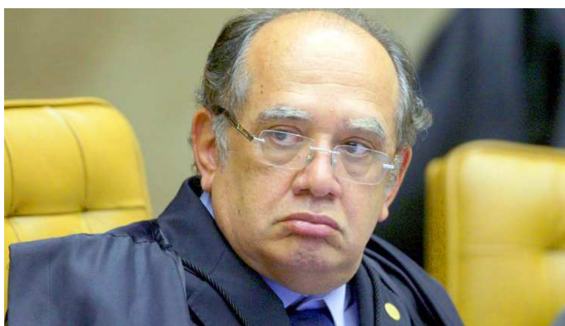
Presidente do Tribunal Regional Eleitoral, Gilmar Mendes, criticou os salários dos desembargadores do MA

Sobre juízes e procuradores que atacam a proposta de lei que pune abuso de autoridades, Mendes disse que "parece que eles imaginam que devam ter licença para cometer abusos". Ele con-