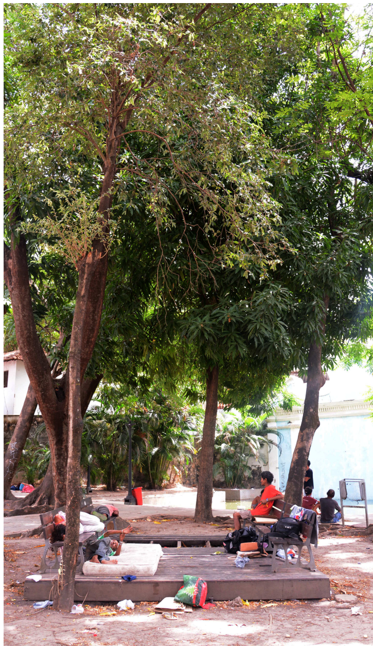
Suja e abandonada, Fonte das Pedras virou abrigo para os sem-teto da Ilha

A Fonte das Pedras foi edificada pelos holandeses entre 1641 e 1644, tem como principal identidade as carrancas em forma de peixes e de deuses. Ao longo da história, o local também serviu como base para as tropas de Jerônimo de Albuquerque durante o período de expulsão dos franceses da capital maranhense. Em 1963, a fonte foi tombada pelo Instituto do Patrimônio Histórico e Artístico Nacional (Iphan).