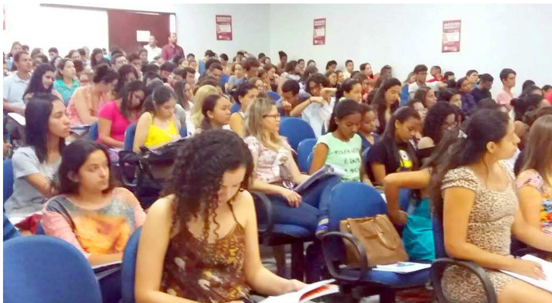
Megarevisão do último aulão para o Enem 2016 promovido pelo governo atraiu centenas de estudantes

De acordo com o secretário de Estado da Ciência, Tecnologia e Inovação, Jhonatan Almada, o programa conseguiu alcançar seus objetivos para este