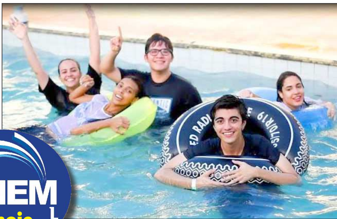
Estudantes aproveitam o último dia antes das provas para relaxar e se preparar para o exame