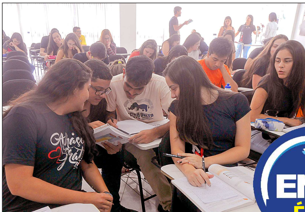
Alunos que realizarão as provas do Enem hoje e amanhã fazem últimos preparativos