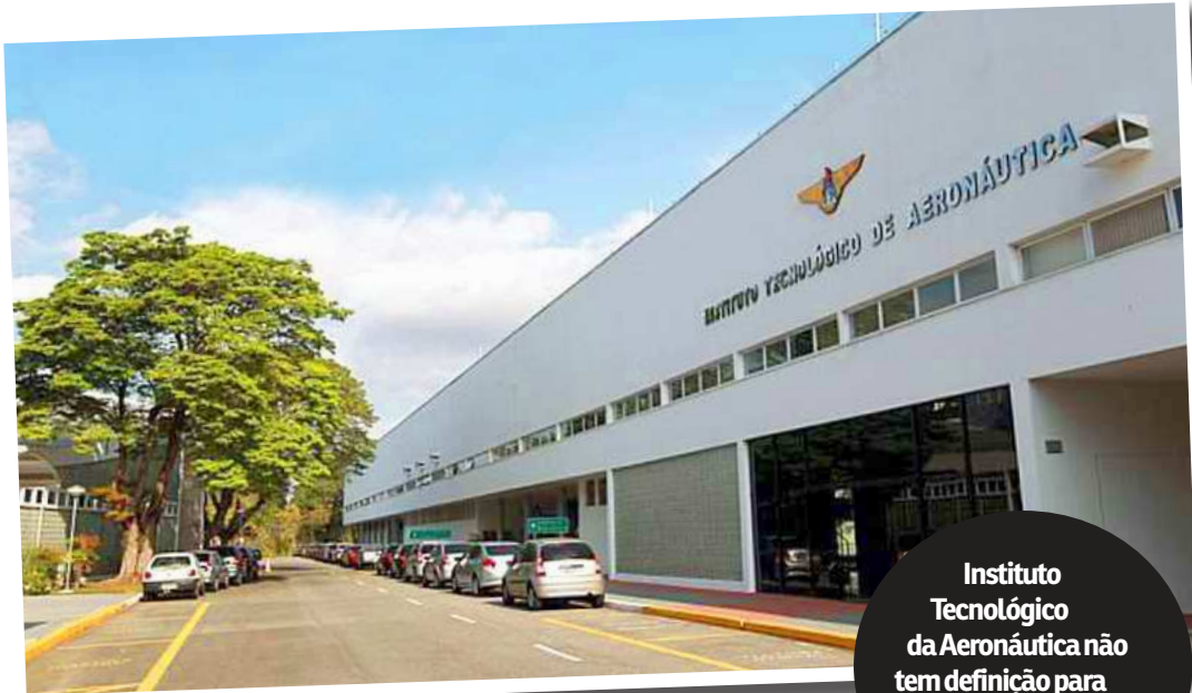
Instituto Tecnológico da Aeronáutica não tem definição para instalar uma sede no estado