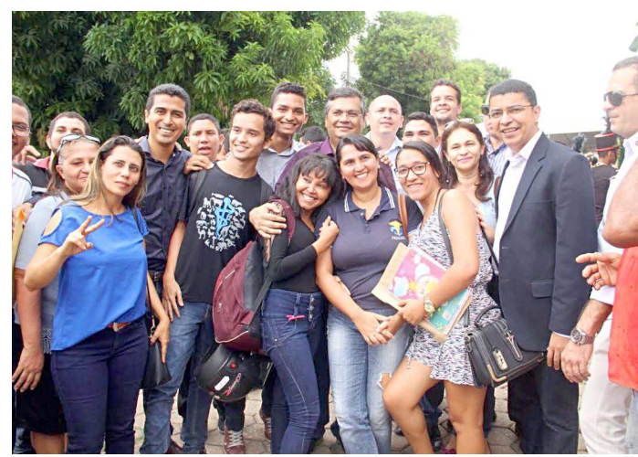
Criação da UemaSul foi comemorada pela comunidade acadêmica