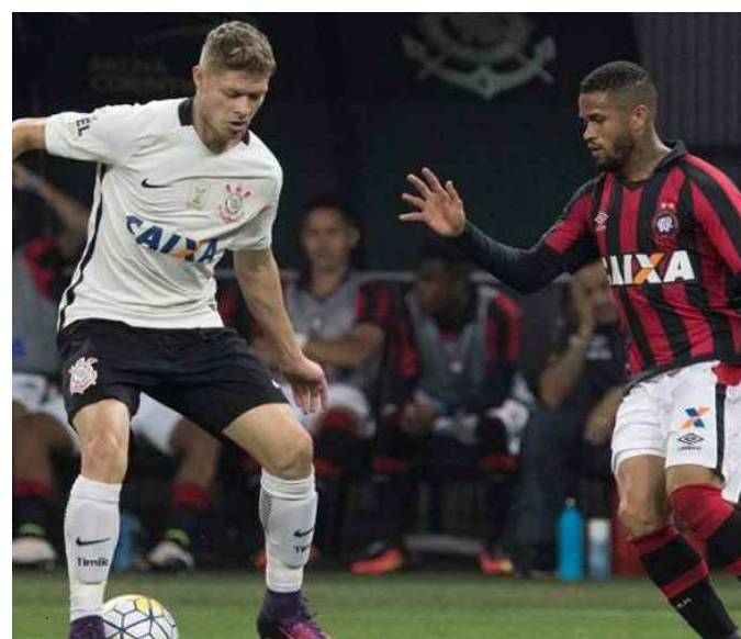
O Corinthians dominou a partida e logrou a vitória

LOCAL - Estádio Itaquerao, em São Paulo (SP)