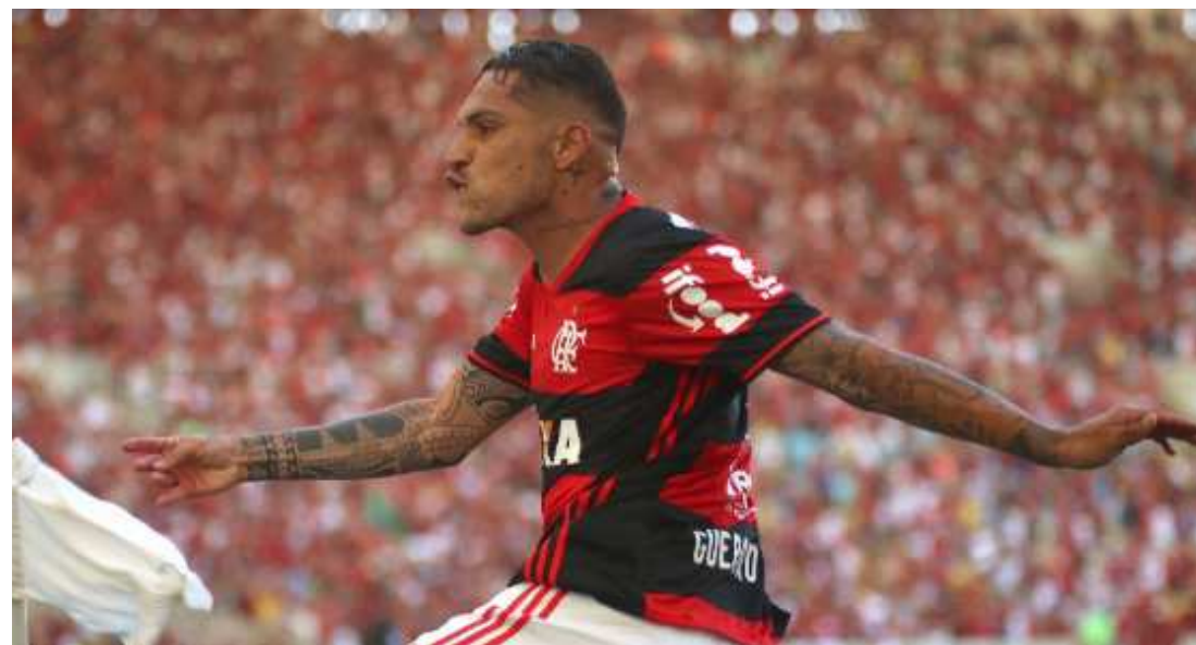
Atacante Paulo Guerrero comemora o primeiro gol do Flamengo sobre o Santos no Maracanã