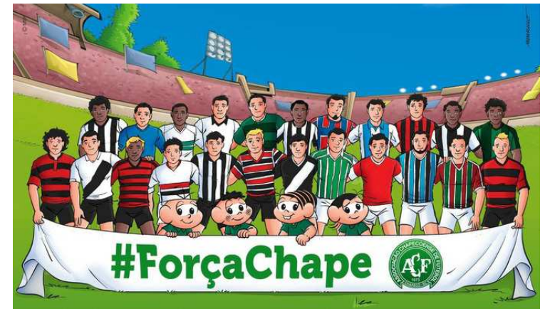
Maurício de Sousa homenageou Chapecoense com desenho da Mônica

presentando vários dos grandes times brasileiros, além dos quatro principais personagens de seu mais famoso gibi. Cebolinha, Cascão, Mônica e Magali, todos trajando verde, seguram uma faixa escrito #ForçaChape, além do símbolo do clube catarinense.