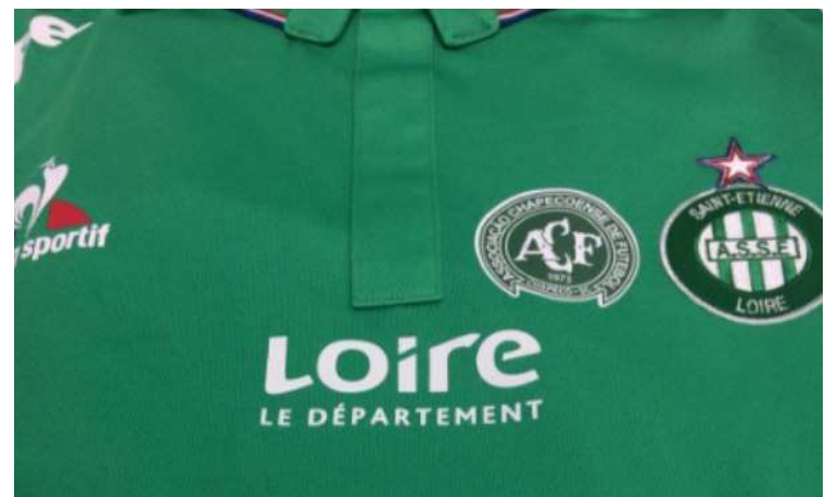
Equipe francesa entrou em campo com escudo da Chape no uniforme

antes de chegar em Medellín. Ao todo, 71 pessoas morreram e seis sobreviveram. O clube francês entrou em campo pela liga nacional para enfrentar o Olympique com o escudo da Chape estampado em seu uniforme, que também é verde.