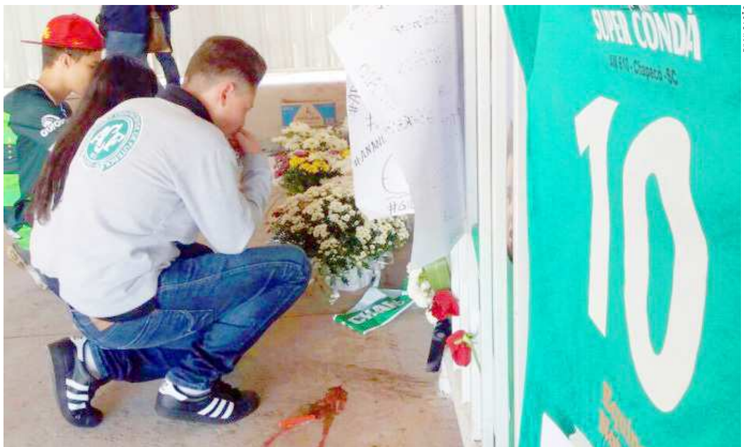
Torcedores da Chapecoense também vão ter a oportunidade de dar o último adeus aos "heróis" do time que morreram no trágico acidente

Os corpos chegarão primeiro em Brasília e de lá serão levados para a cidade natal da Chapecoense. Após o velório coletivo dos jogadores, diretoria e comissão técnica da Chapecoense, todos serão liberados para as famílias e os respectivos locais de sepultamento.