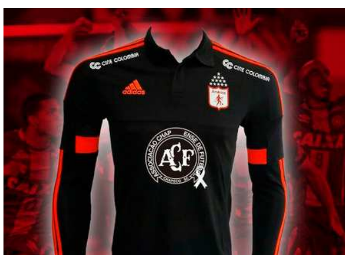
A equipagem do time tem o símbolo da Chapecoense no centro

O escudo da Chapecoense estará estampado na camisa de alguns clubes. Já o Palmeiras, por exemplo, pretende entrar em campo na última rodada do Campeonato Brasileiro com o uniforme da Chape de fato. Resta apenas a autorização da CBF. O Atlético Nacional, adversário