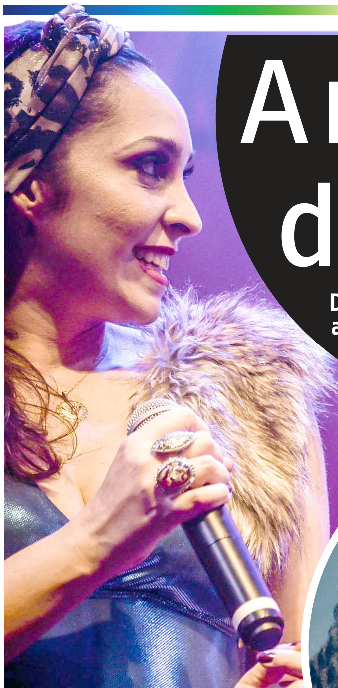
ZEMA RIBEIRO ESPECIAL PARA O IMPARCIAL

Dois recordes quebrados, shows históricos, a Praia Grande reocupada com arte e cores em uníssono: "Fora, Temer!"