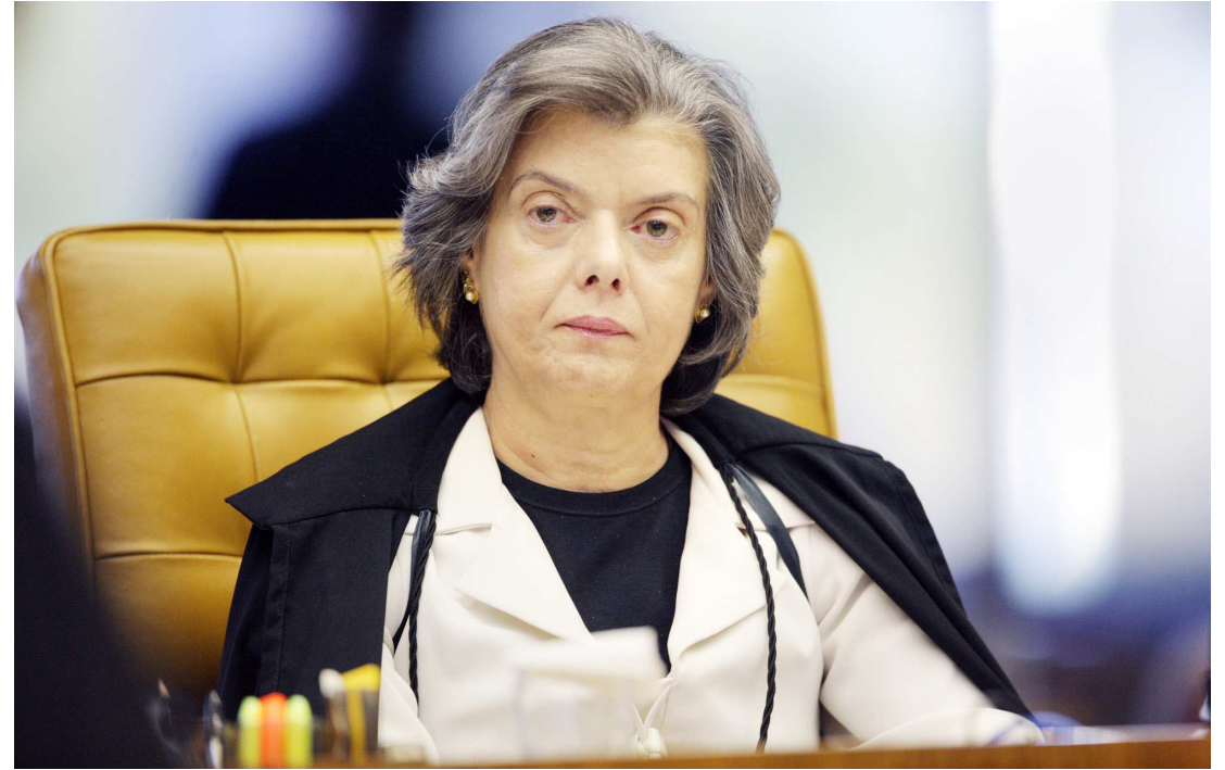
Cármen Lúcia criticou severamente o Senado e as aprovações feitas pela Câmara dos Deputados

Mais cedo, no CNJ, a presidente do Supremo falou que criminalizar a jurisdição é "criminalizar a democracia": "Há de