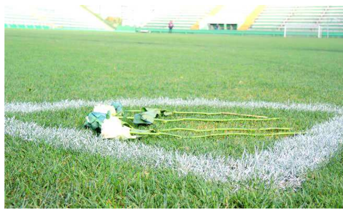
Gramado da Arena Condá será palco do velório das vítimas

O clube estuda a quantidade de cadeiras e o posicionamento para circulação das pessoas que são esperadas na Arena Condá para dar adeus às vítimas. Depois do velório, os familiares poderão levar os corpos para os estados de origem dos parentes.