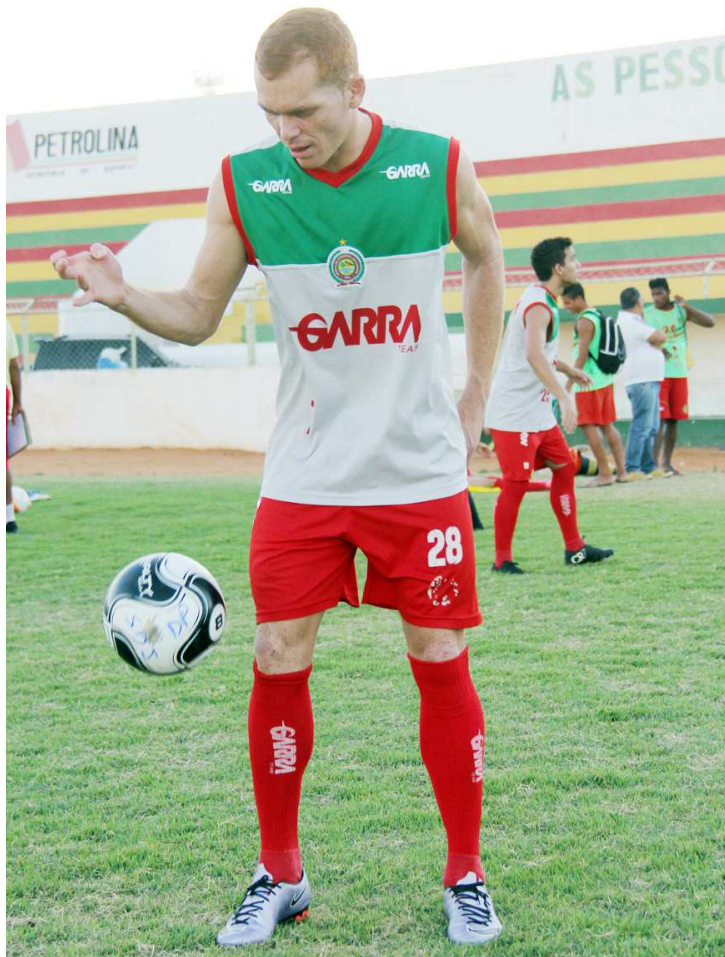
Galego pode ser a próxima atração do Moto, que inicia contratações