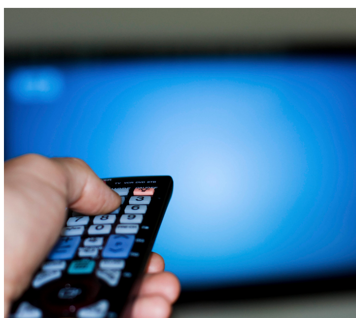
O número de assinantes começou a cair já no início do ano passado

Para a Associação Brasileira de TV por Assinatura (ABTA), no entanto, os números não são tão assustadores, já que o setor teve uma redução menor do que a queda registrada na economia do país como