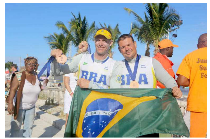
Brasileiro exibe a bandeira do Brasil após conquista do bronze