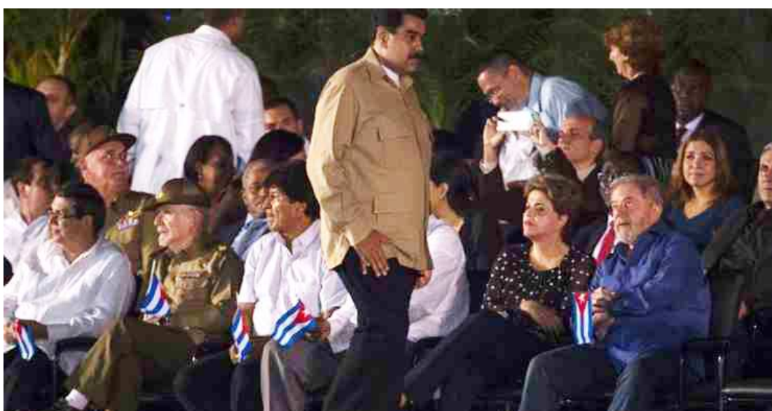
Luiz Inácio Lula da Silva e Dilma Rousseff se sentaram ao lado do presidente de Cuba, Raúl Castro, irmão de Fidel

Ao falar para a imprensa estatal do país, o ex-presidente brasileiro exaltou o líder da revolução cubana de 1969: “Estou triste porque se foi o maior homem do século 20. Quando soube da notícia, a maneira que encontrei de expressar meus pêsames foi escrever na parede ‘Viva Fidel’”, contou Lula,