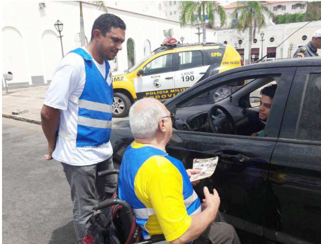
Bliz Educativa chamou atenção para os cuidados no trânsito e prevenção de acidentes