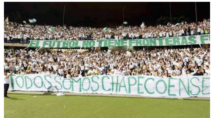
Torcida do Atlético da Colômbia voltou a homenagear a Chape