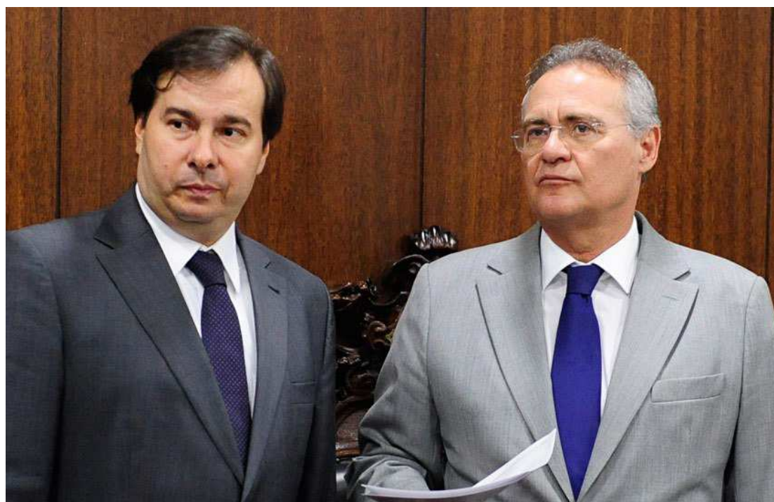
Renan e Maia emitiram nota afirmando que as manifestações realizadas ontem são 'legítimas e democráticas'

Rodrigo Maia também se manifestou em um comunicado, no