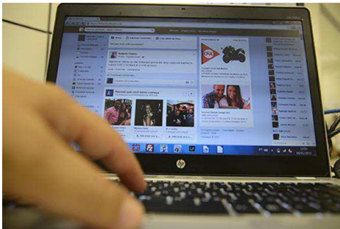
A possibilidade de as operadoras de internet fixa adotarem franquia de dados vem sendo discutida desde abril

Segundo a Anatel, o objetivo da consulta à sociedade é colher subsídios técnicos que servirão para fundamentar a decisão da agência sobre as franquias de dados na banda larga fixa. "Com isso, busca-se ampliar a transparência e fortalecer os mecanismos de participação social no processo regulatório", informou a Anatel. Além das contribuições por meio do site, a Anatel encaminhou questões a entidades representativas dos diversos setores envolvidos.