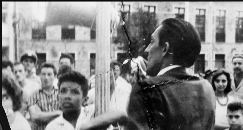
No lançamento do livro Cultura Posta em Questão (1963), em praça pública de São Luís-MA

Gullar afirmava que a poesia era sua atividade fundamental. Em 1987, publicou Barulhos e, em 1999, Muitas Vozes , que recebeu os principais prêmios de literatura daquele ano. Em 2002, foi indicado para o Prêmio Nobel de Literatura.