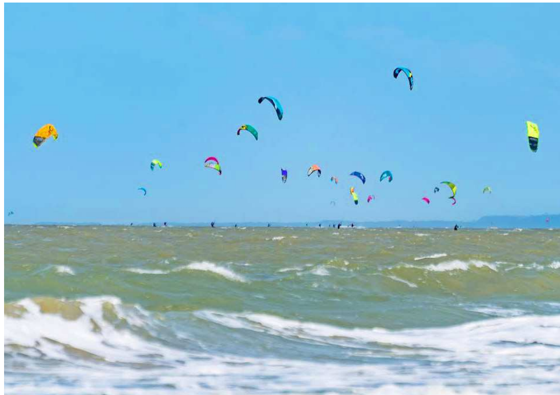
Kitesurfistas deram mais um show de manobras habilidosas nas praias da capital no fim de semana

Em parceria com a Avema, a Federação Maranhense de Surf (Femasurf) realizou também o campeonato de surfe em várias modalidades, que reuniu atletas locais em uma competição acirrada pelas me-