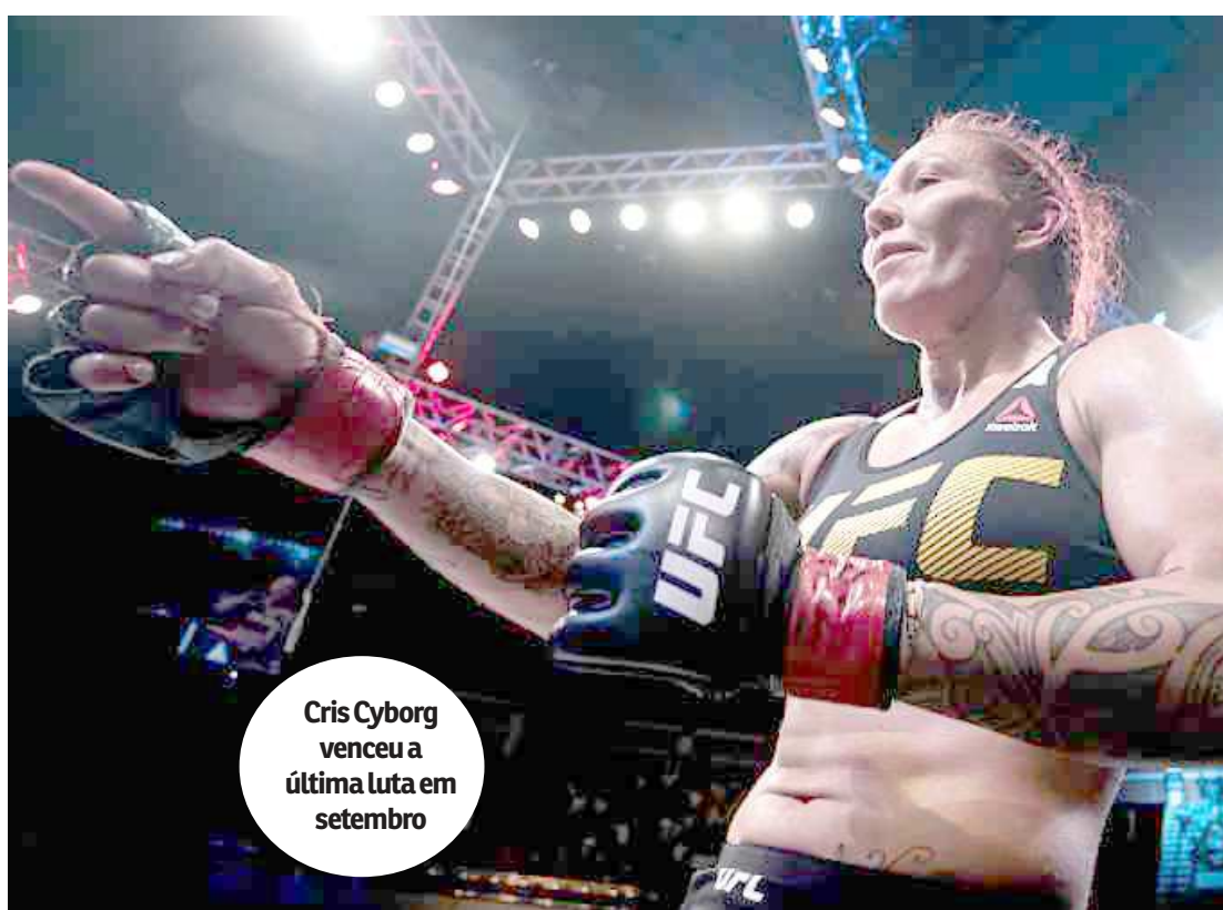
Cris Cyborg venceu a última luta em setembro