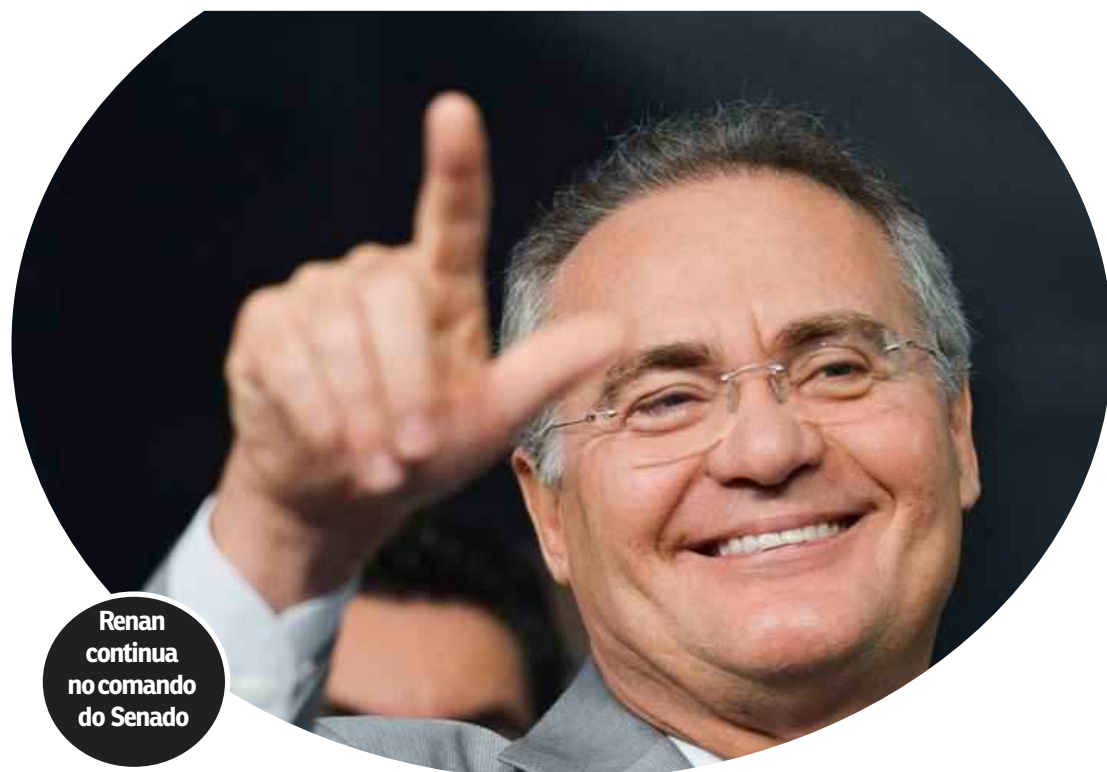
Renan continua no comando do Senado

Rosa Weber e Edson Fachin seguiram o ministro Marco Aurélio Mello e votaram pelo afastamento de Renan Calheiros da