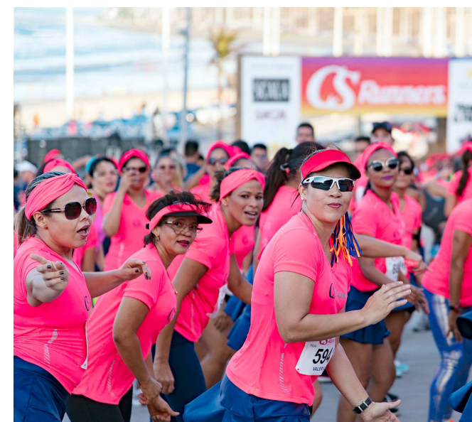
Corredoras mostraram garra na última edição da corrida