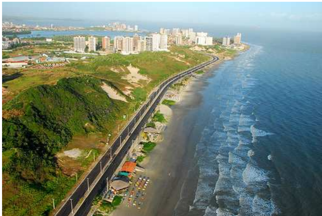
As praias de São Marcos, Calhau, Meio e Araçagi estão todas liberadas para banho, segundo o relatório técnico

A diminuição dos níveis de enterococos é resultado da força-tarefa realizada pela Sema e pela Companhia de Saneamento Ambiental do Maranhão (Caema), que fiscalizaram os estabelecimentos comerciais na Ponta d'Areia, onde foram constatados lançamentos de esgotos sanitários in natura, e, prontamente, realizadas ações emergenciais.