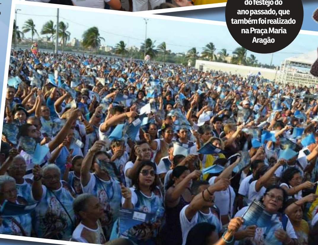
Imagens do festejo do ano passado, que também foi realizado na Praça Maria Aragão