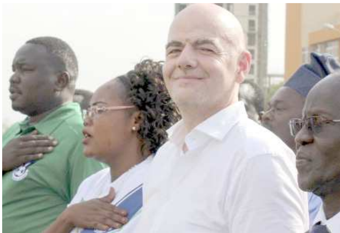
Proposta de Gianni Infantino deve ser analisada na reunião do Conselho que deve acontecer em janeiro

Ainda de acordo com a agência, uma carta com essa proposta deve ser enviada ontem aos membros do conselho técnico da Fifa. A partir disso, o órgão debaterá as implicações da mudança (a proposta é que os dois melhores de cada chave avancem, totalizando 32 classificados para um mata-mata).