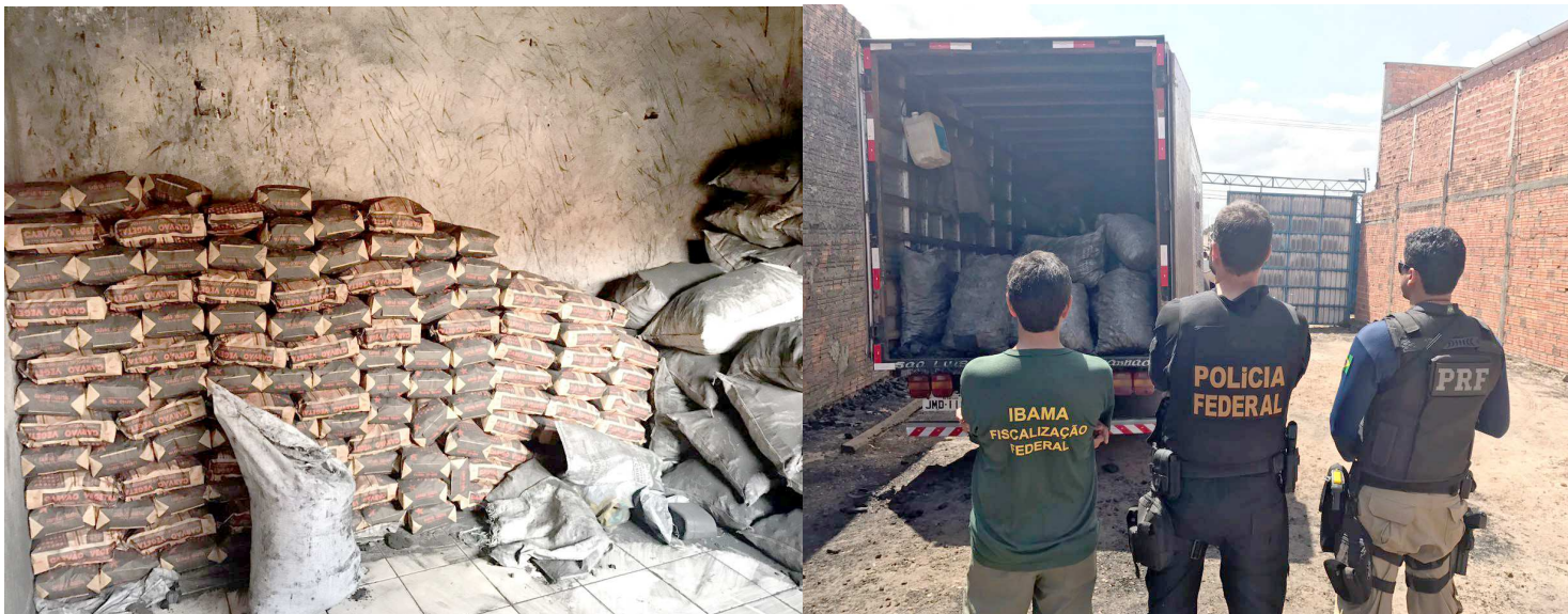
A produção ilegal de carvão vegetal era realizada em diversas fazendas do interior do estado e a produção escoada pelas rodovias estaduais

de carvão, extraídos ilegalmente, foram encontrados em sete depósitos clandestinos