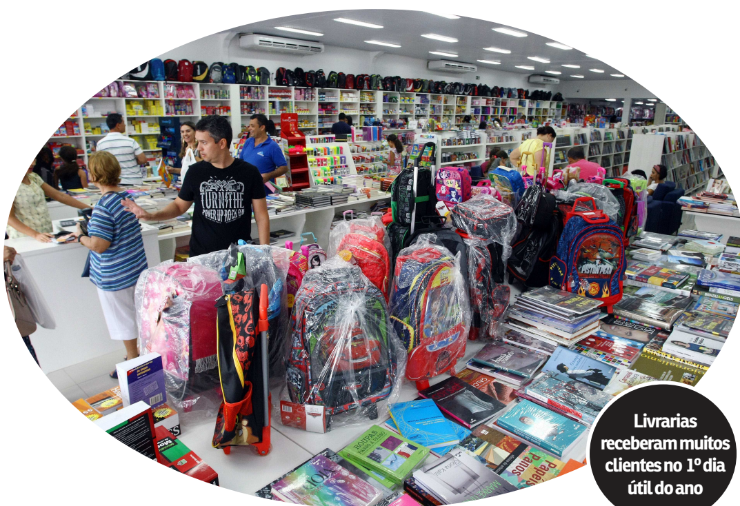
HONÓRIO MOREIRA O IMPÍDIA PRESS

Livrarias receberam muitos clientes no 1º dia útil do ano