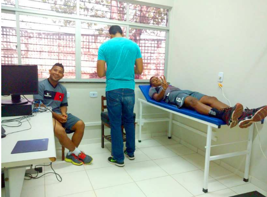
Jogadores do Papão passaram por exames fisiológicos na Universidade Federal do Maranhão

No primeiro dia, na segunda-feira, os jogadores fizeram os exames fisiológicos na Universidade Federal do Maranhão (UFMA), principalmente com os atletas que desembarcaram no último domingo em São Luís. Esse procedimento terá continuidade nesta terça (3), no período da manhã. Durante a tarde, todos os atletas serão apresentados à imprensa e aos torcedores. Os treinos físicos no CT Pereira dos Santos começam para valer nessa terça-feira. Os atletas terão que suar muito a camisa, treinos até no fim de semana. Sábado e domingo serão dias normais de trabalho para todos, descanso apenas na parte da tarde.