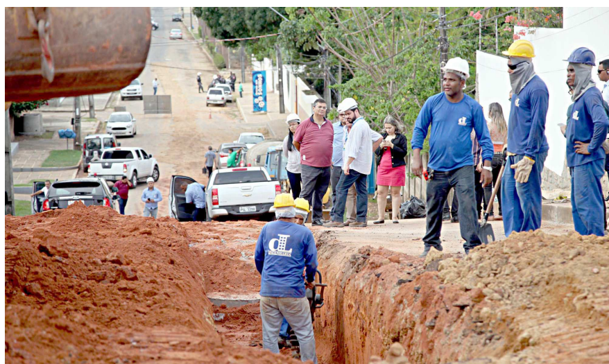
Obras foram pensadas em conjunto pelo governo do estado, Caema e Prefeitura para proporcionar melhoria das condições de balneabilidade nas praias da orla de São Luís

Segundo o governador, na região, o turismo e a pesca foram eleitas como atividades preponderantes para receber investimentos do Governo do Estado. "Temos um foco de atuação aqui que é o turismo, desde o começo do governo já fizemos várias intervenções, visando melhorar o funcionamento dessa atividade econômica, essencial para a geração do emprego e renda e vamos continuar essas intervenções. Olhamos também a questão da pesca, há um compromisso reafirmado de nós financiarmos a