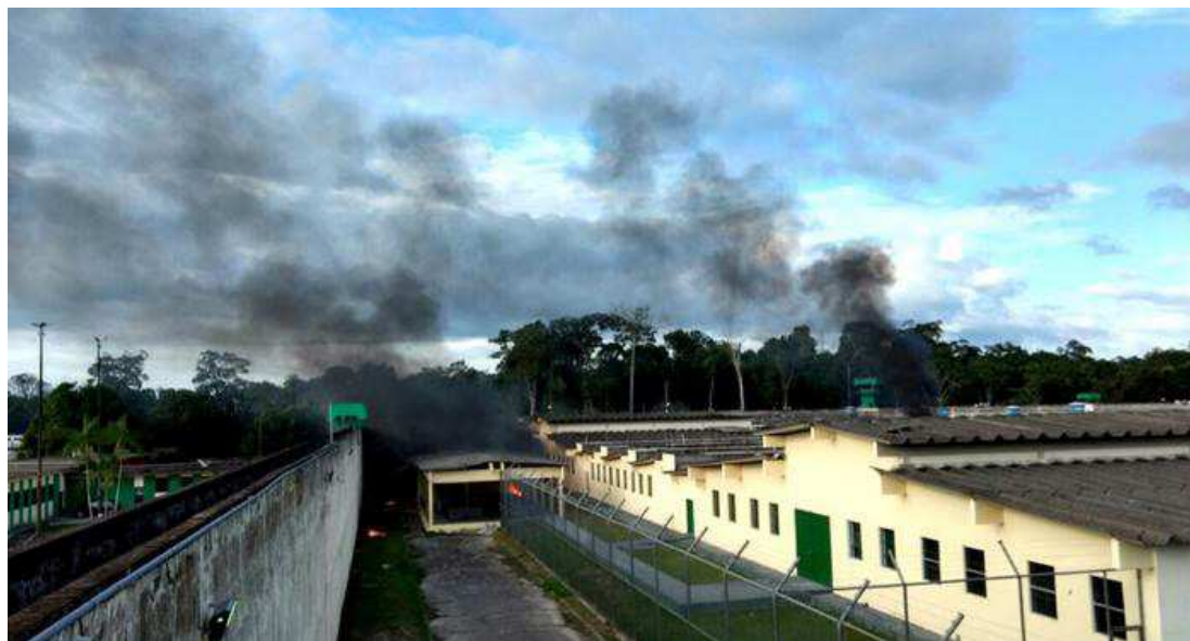
O motim começou na tarde de domingo. Ainda não há confirmação oficial sobre o número de fugitivos

O motim começou na tarde de domingo (1º/1) e, de acordo com o G1, presos se renderam e entregaram as armas às 8h40 desta segunda-feira (2/1). Ainda não há confirmação oficial do governo do estado sobre o número de fugitivos, mas a Ordem dos Advogados do Brasil amazonense (OAB-AM) chegou a dizer que cerca de 130 presos escaparam.