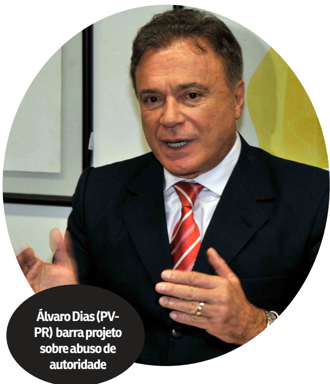
Álvaro Dias (PV-PR) barra projeto sobre abuso de autoridade

O PLS 280/2016 recebeu, até agora, 26 emendas, sendo duas no âmbito da CECR e 24 em Plenário. Requião já havia se manifestado sobre as emendas 1 a 21, das quais nove foram aproveitadas em seu substitutivo. Ainda restam três emendas sem parecer. A CCJ ainda não designou relator para a proposta, que aumenta a pena para o crime de abuso de autoridade, cometido por servidores públicos, membros do Ministério Público e dos Poderes Judiciário e Legislativo da União, de estados, do Distrito Federal e dos municípios.