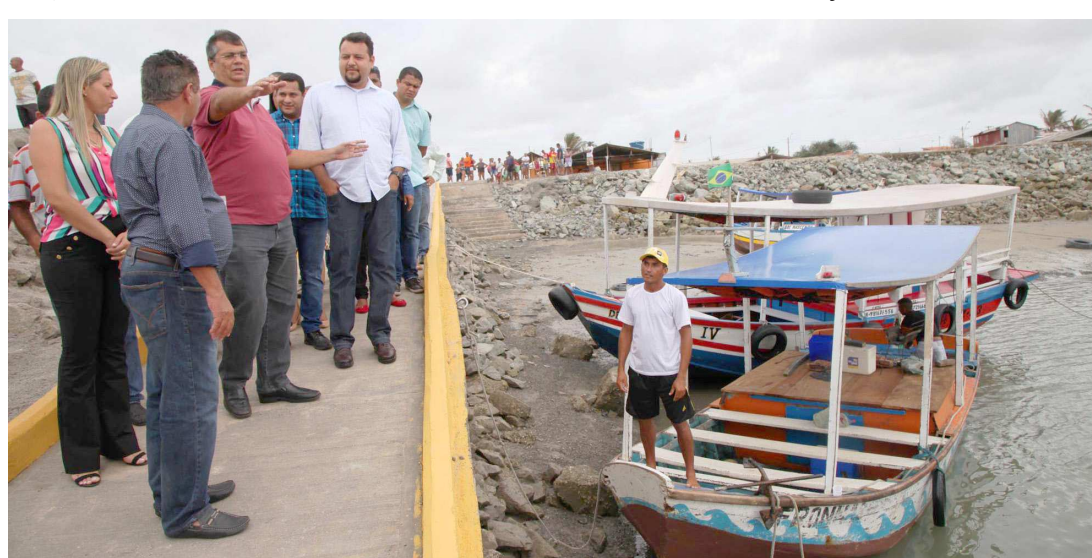
Obra no Cais da Raposa deverá garantir mais agilidade e segurança aos pescadores da região

turismo. Além disso, fizemos o portinho do embarque para os turistas que fazem o passeio, que é bastante procurado".