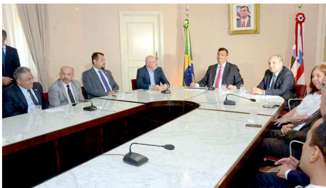
Segundo Flávio Dino, na 2ª etapa será levado em consideração as regiões que ainda não foram beneficiadas

Entre as obras de melhoria, pavimentação e manutenção do ‘Mais Asfalto’ deste ano, estão: Rodovia MA-275, entre Sítio Novo e Amarante do Maranhão; MA-014, entre Vitória do Meirim e Três Marias, no Entroncamento da MA-106; MA-106, entre Porto de Cuijupe e Governador Nunes Freire; trecho das rodovias MA-234/034/345/346, entre Chapadinha e Pirangi.