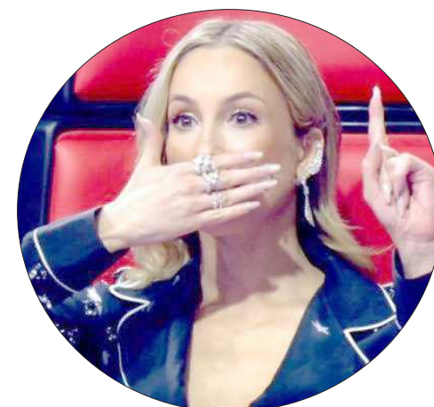
Cláudia Leitte, dizendo que não pretende mudar em 2017