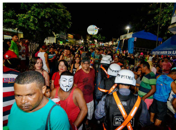
O policiamento está sendo realizado a pé, motorizado e montado