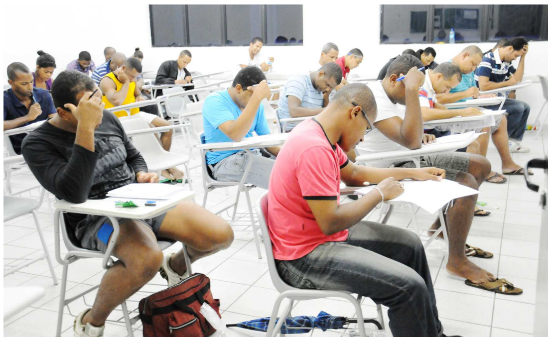
Ao todo, estão previstos oito concursos públicos, com uma despesa anual de R$ 115 milhões para contratação

Previsto deste 2015, o concurso da Funac é esperado para ser aberto este ano. Deverão ser oferecidas 150 vagas para todas as unidades da Fundação no estado.