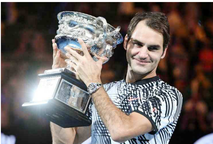
Num jogo de tirar o fôlego, Roger Federer vence Nadal e levanta a taça

O título deste domingo também coloca Federer de volta