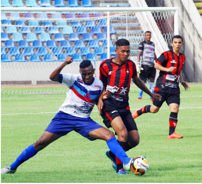
Moto divide a segunda posição do Grupo B