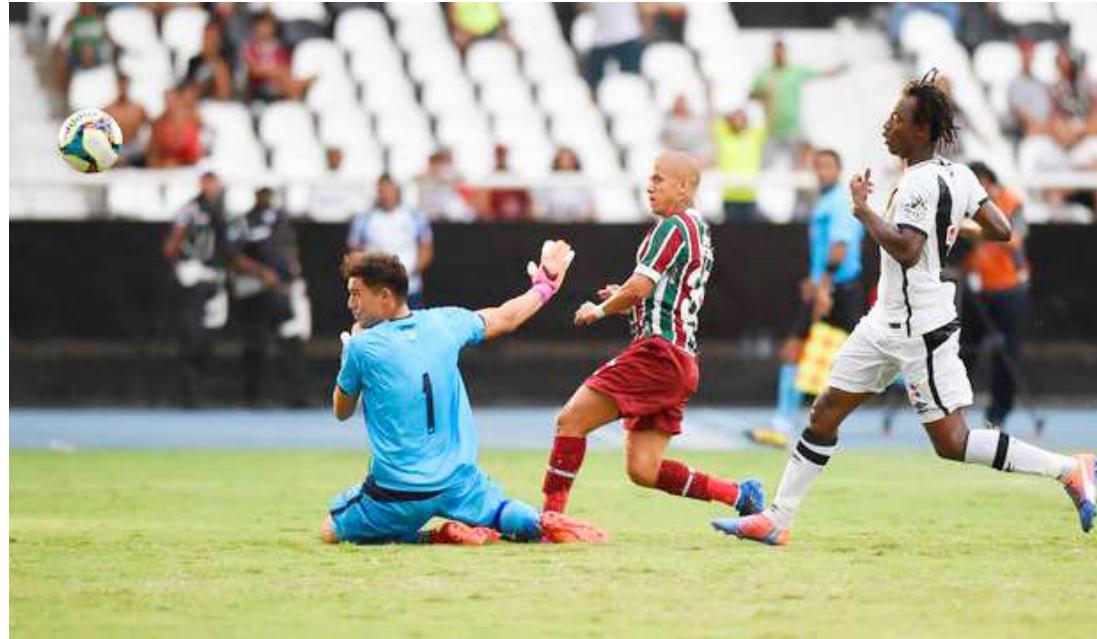
A superioridade do Fluminense dominou todo o jogo, que culminou com a goleada logo na estreia do Carioca

A cabeçada de Luan na travessão, no início, indicou que o domínio seria do Vasco. Mas a equipe logo pagou pelas falhas