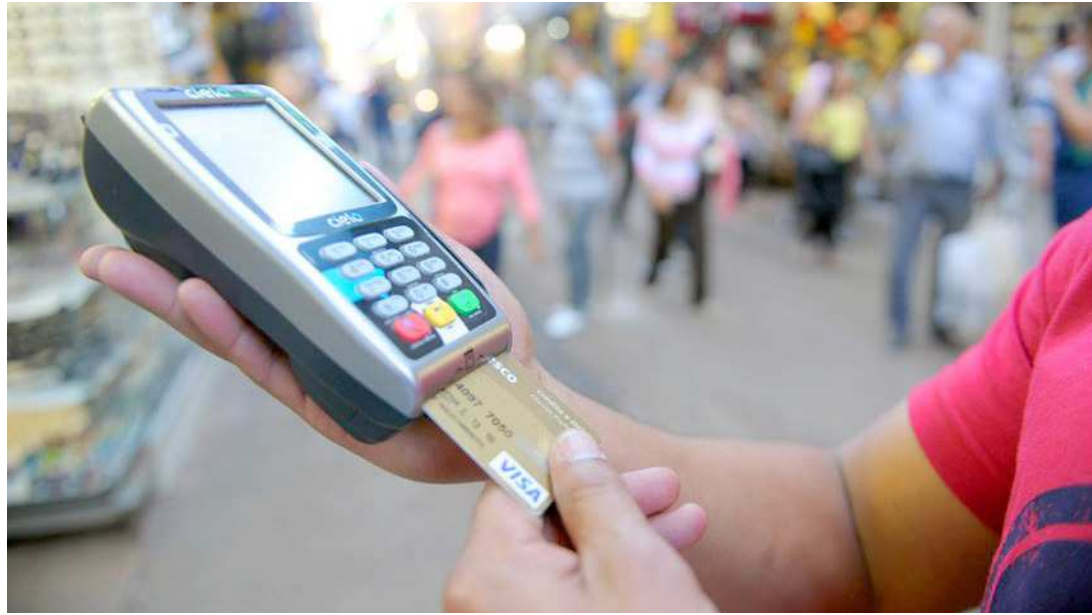
Segundo o Banco Central, as altas taxas de juros no crédito rotativo estão relacionadas à elevada inadimplência

A diferença é maior quanto mais longo o tempo dos financiamentos. Uma dívida de R$ 1 mil na fatura do cartão sobe para R$ 1.534 no crédito rotativo ao fim de três meses. Com a nova regra, pela qual a taxa mais alta – de 15,33% ao mês – incide nos primeiros 30 dias e a taxa de 8% ao mês incide nos dois meses restantes, a dívida aumenta para R$ 1.345,20, diferença de 12,3%.