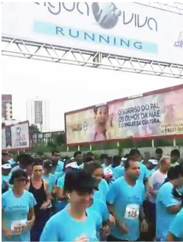
Centenas de participantes prestigiaram o evento