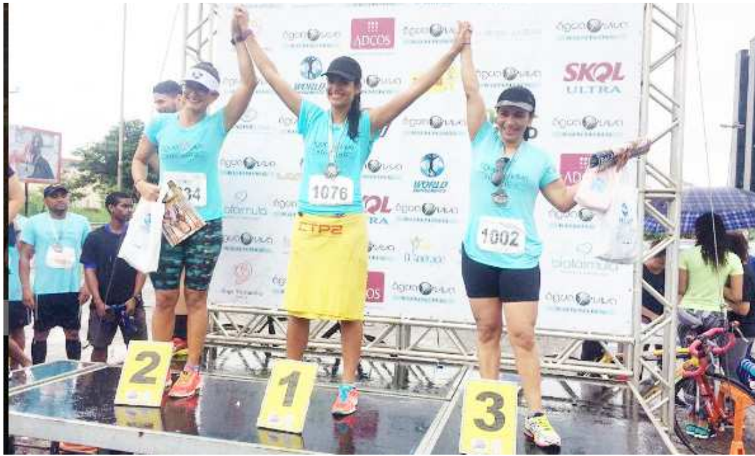
Vencedoras da disputa, no pódio, após a realização da 1ª edição da Corrida Água Viva, em São Luís

O evento é Água Viva. Portanto, estamos fazendo a devida correção do título e parte do texto da matéria publicada na edição anterior.