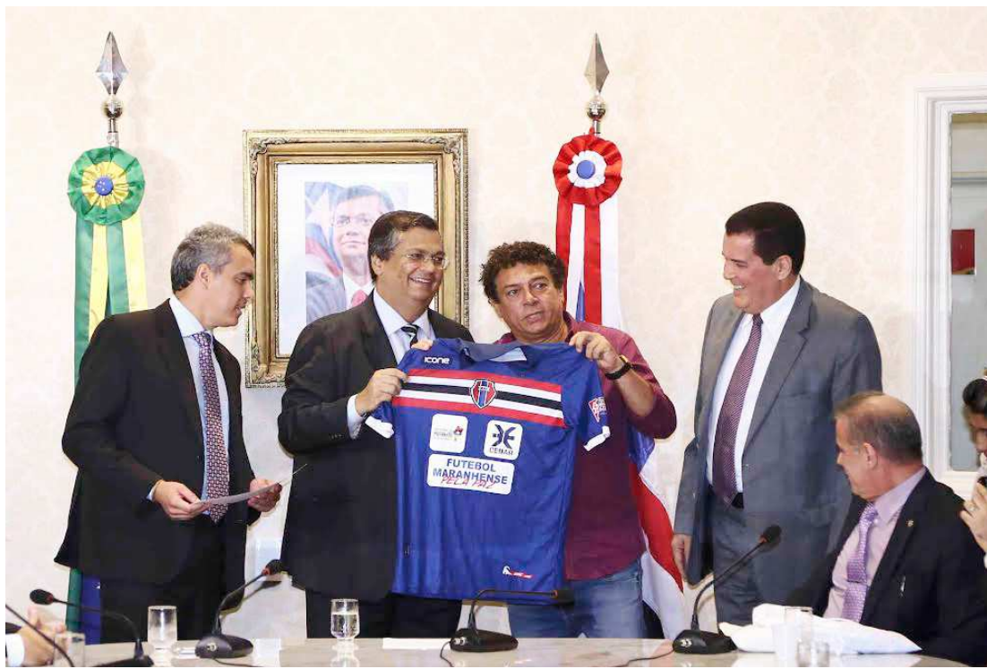
Governador Flávio Dino anunciou a entrega de certificados de apoio aos presidentes das agremiações

"Aqui no Maranhão, a gente aprende desde novinho que o bom marinheiro se revela é nas tempestades, no mar bravo. E nós estamos, felizmente e infelizmente, ao mesmo tempo, sendo testados nesse momento de muitas dificuldades. Essa dificuldade demanda o esforço maior ainda da nossa equipe de arbitramento daquilo que é prio-