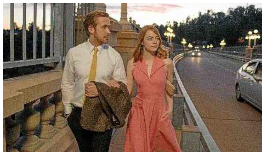
Ryan Gosling e Emma Stone estão no primeiro plano do Oscar, com La la land , Cantando estações

Amante da era dos musicais, o crítico não esconde a predileção pela produção La la land – Cantando estações , entre os finalistas a melhor filme. Respeitoso e admirador do histórico da velha guarda de Hollywood, ele não encoraja “desrespeitos” como aquele muito comum de chamá-los de “velhinhos”, quando o tema é o da seleta comissão dos pré-candidatos a melhor filme estrangeiro, que tanto castiga diretores brasileiros. “Acho ofensivo ver os criadores e grandes diretores ainda vivos serem chamados de velhinhos! (risos). Certamente, entendem muito mais de cinema do que esses imbecis que fazem um filme mais ou menos que engana os outros, e depois somem para todo sempre”, esbraveja.