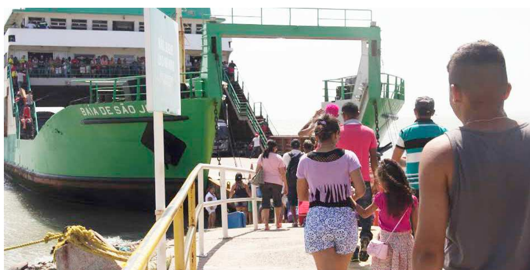
Fluxo de pessoas nos terminais de ferryboat aumenta durante o período de carnaval com destino ao interior

Durante a Operação Carnaval, a Polícia Militar aumentará o quantitativo de policiais para dar mais agilidade à fiscalização de