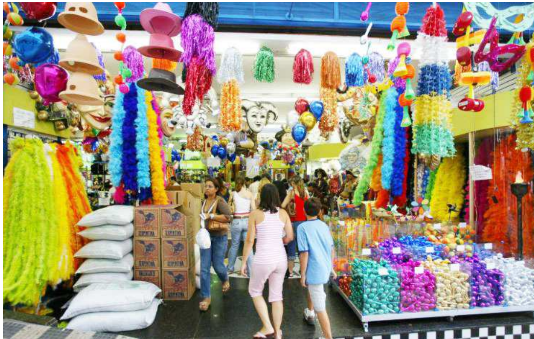
Folião precisa pesquisar para se livrar da enorme diferença de preços dos produtos carnavalescos

No carnaval, muita gente sai à procura de um amor, não é mesmo? Só não pode esquecer de cuidar da sua saúde e de quem você ama, optando sempre pelo sexo seguro. Pensando na 'folia de momo' que está chegando, a equipe do Instituto de Promoção e Defesa ao Cidadão e Consumidor do Maranhão (Procon) realizou pesquisa de preços de itens de carnaval em São Luís.