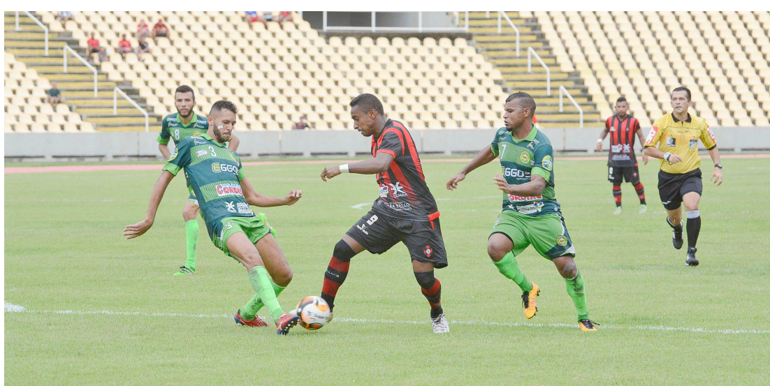
Time rubro-negro vai tentar fazer uma apresentação bem diferente da que resultou no empate com o Cordino