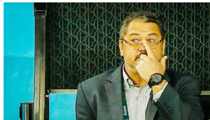
Micale não conseguiu classificar o Brasil para o próximo Mundial