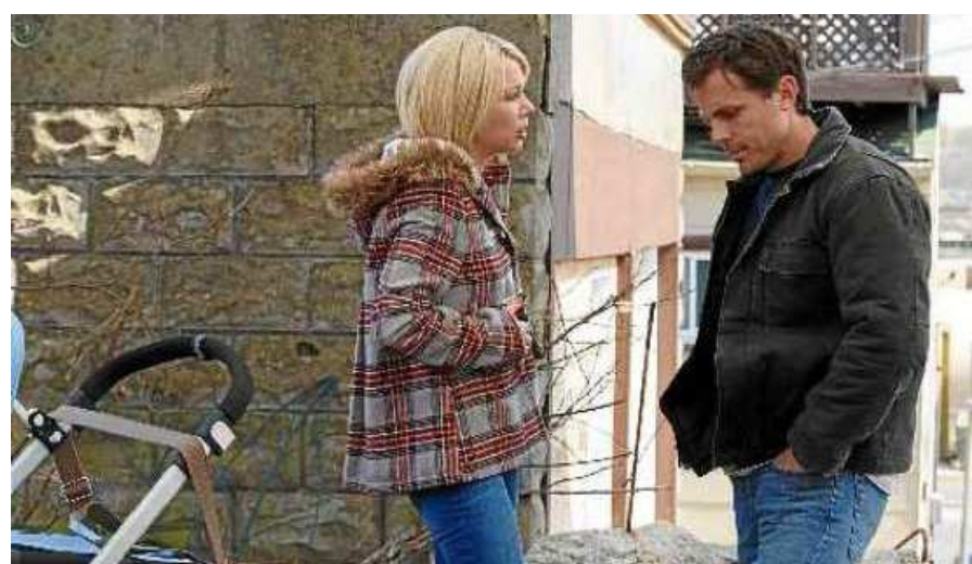
Michelle Williams e Casey Affleck carregam um drama pesado, em Manchester à beira-mar