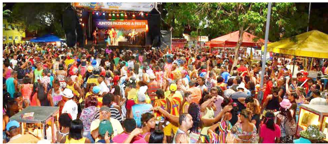
Circuito da Madre Deus contará com apresentações de shows de blocos tradicionais, afros, além de alternativos

A programação oficial do "Carnaval de Todos 2017" acontecerá mais cedo nos seis pontos da folia promovida pelo Governo do Maranhão. Realizada por meio da Secretaria de Estado de Cultura e Turismo (Sectur), em parceria com a Prefeitura de São Luís, a festa foi planejada para garantir a participação de toda a família. A abertura dos circuitos oficiais acontece na próxima sexta-feira (24), às 18h. Já de sábado a terça-feira, a animação começa a partir das 14h. "Fizemos um planejamento para garantir que a festa ocorra com segurança e tranquilidade para a população. Nós teremos um reforço muito grande de policiais, contando, também, com apoio da Prefeitura, através da Guarda Municipal, Blitz Urbana e Samu [Serviço de Atendimento Móvel de Urgência].