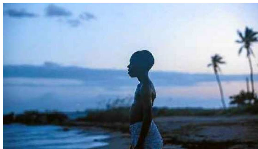
Moonlight , Sob a luz do luar , concorrente ao prêmio central, conta drama em três fases

Quanto ao revival dos musicais, um gênero em desuso, com La la land : isso é algo calculado pela indústria?