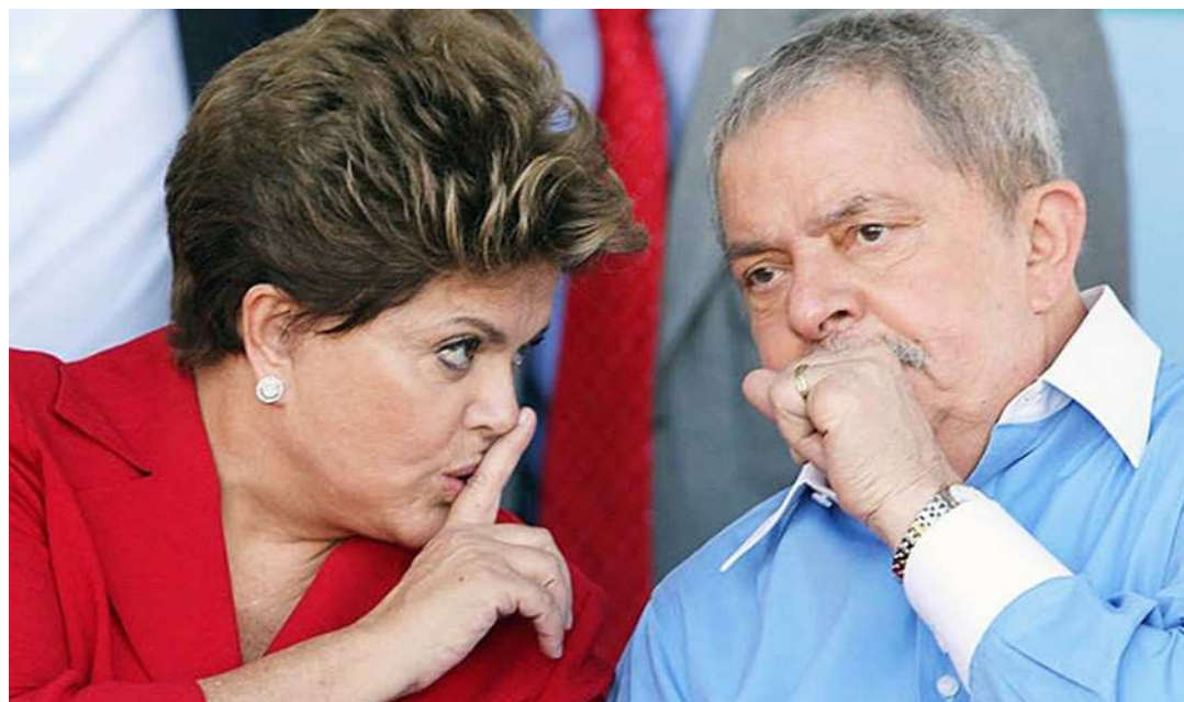
"A nomeação de Lula caracteriza obstrução de Justiça", diz trecho do relatório da Polícia Federal