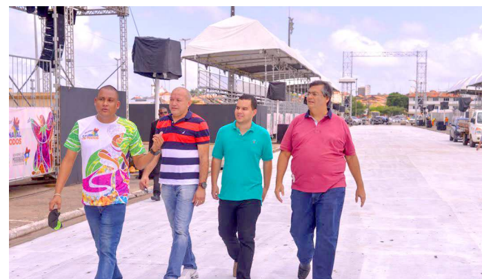
Diego Galdino e Flávio Dino observaram de perto os últimos detalhes

Na Passarela do Samba, o governador acompanhou a finalização das instalações de camarotes cobertos, acabamentos nas estruturas de suporte e elétricas e no sistema de iluminação. Este é o segundo ano que a Passarela utiliza luminárias com tecnologia de LED, que são mais econômicas e eficientes. Serão sete torres de luz, com nove projetores de 2.000W cada, que receberam reparos na fiação, luminárias e quadros de distribuição.