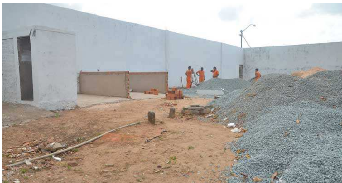
Polícia está realizando buscas para recapturar fugitivos. Outros 11 detentos tentaram fugir, mas não conseguiram

A Secretaria de Estado de Administração Penitenciária (Sejap) informa que foi recapturado um dos detentos que havia fugido do Complexo Penitenciário São Luís. Ao todo, 12 detentos beneficiados com o