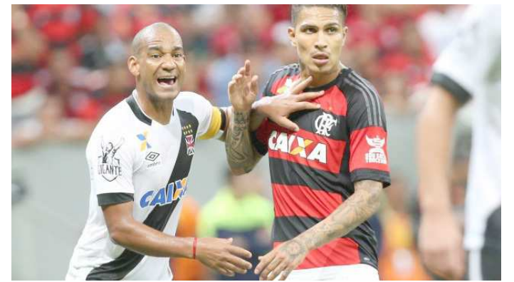
Guerrero e Rodrigo voltam a duelar no jogo decisivo da Taça GB