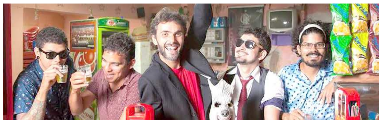
Muita irreverência é o que promete o grupo Forrozão Mão na Xereca em sua apresentação no baile de carnaval alternativo

Com direito a fantasias no melhor estilo carnavalesco, o Bailão Dos Nô-