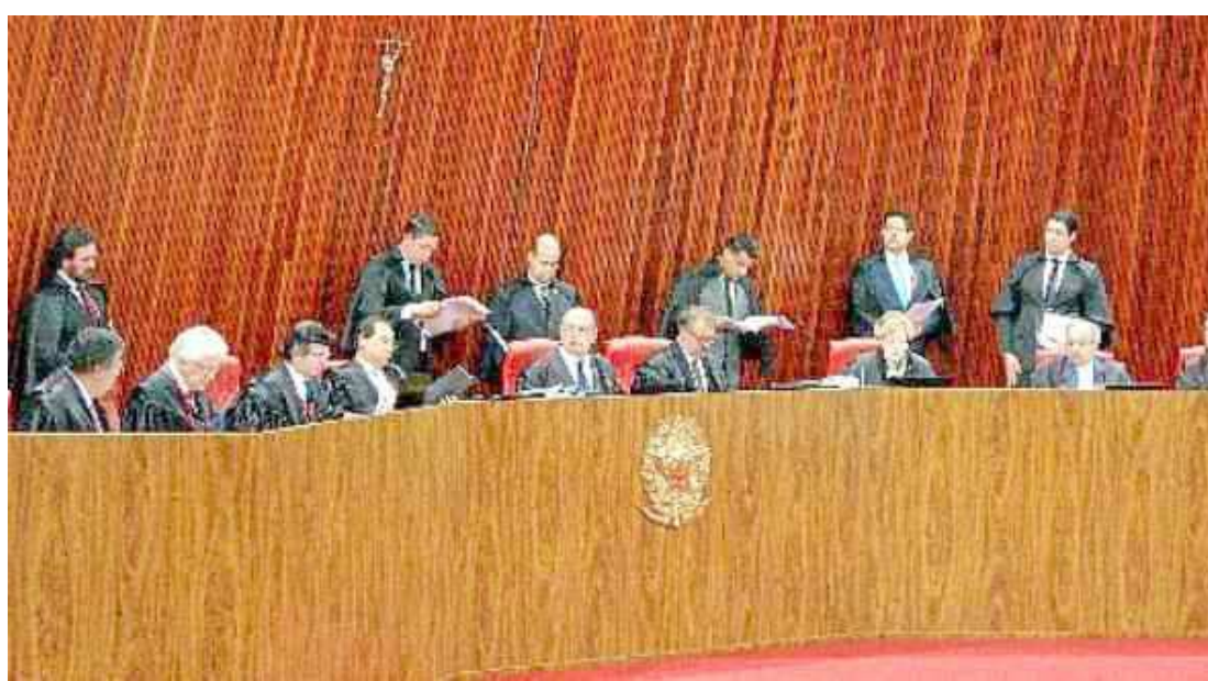
A crítica feita ao TSE é que só foram prejudicados governantes de estados menos influentes do Norte e Nordeste

O Tribunal, agora, terá diante de si um panorama muito mais complexo: o que estará em jogo é o mandato de um presidente da República, que herdou o cargo após um processo de impeachment da titular da chapa (Dilma Rousseff), em agosto do ano passado. Parlamentares importantes apostam que o desfecho será positivo para o governo. Pelo histórico e pelo presente. Além de não haver uma tradição da corte de suspender mandatos, o momento seria muito diferente do vivido no ano passado, afirmou um tucano. “Diferentemente do período em que o PT estava no poder, as ruas não estão cheias, a base aliada está agrupada e