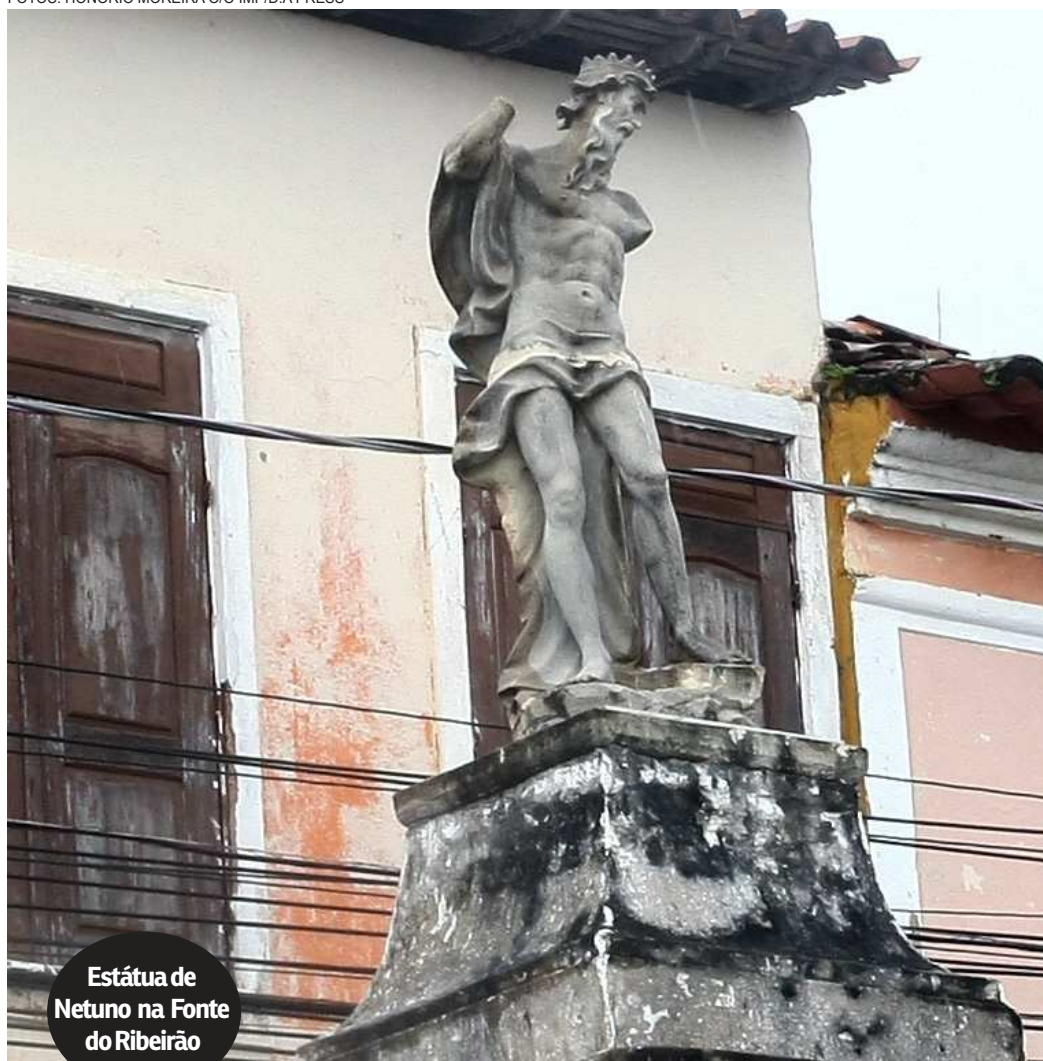
Estátua de Netuno na Fonte do Ribeirão