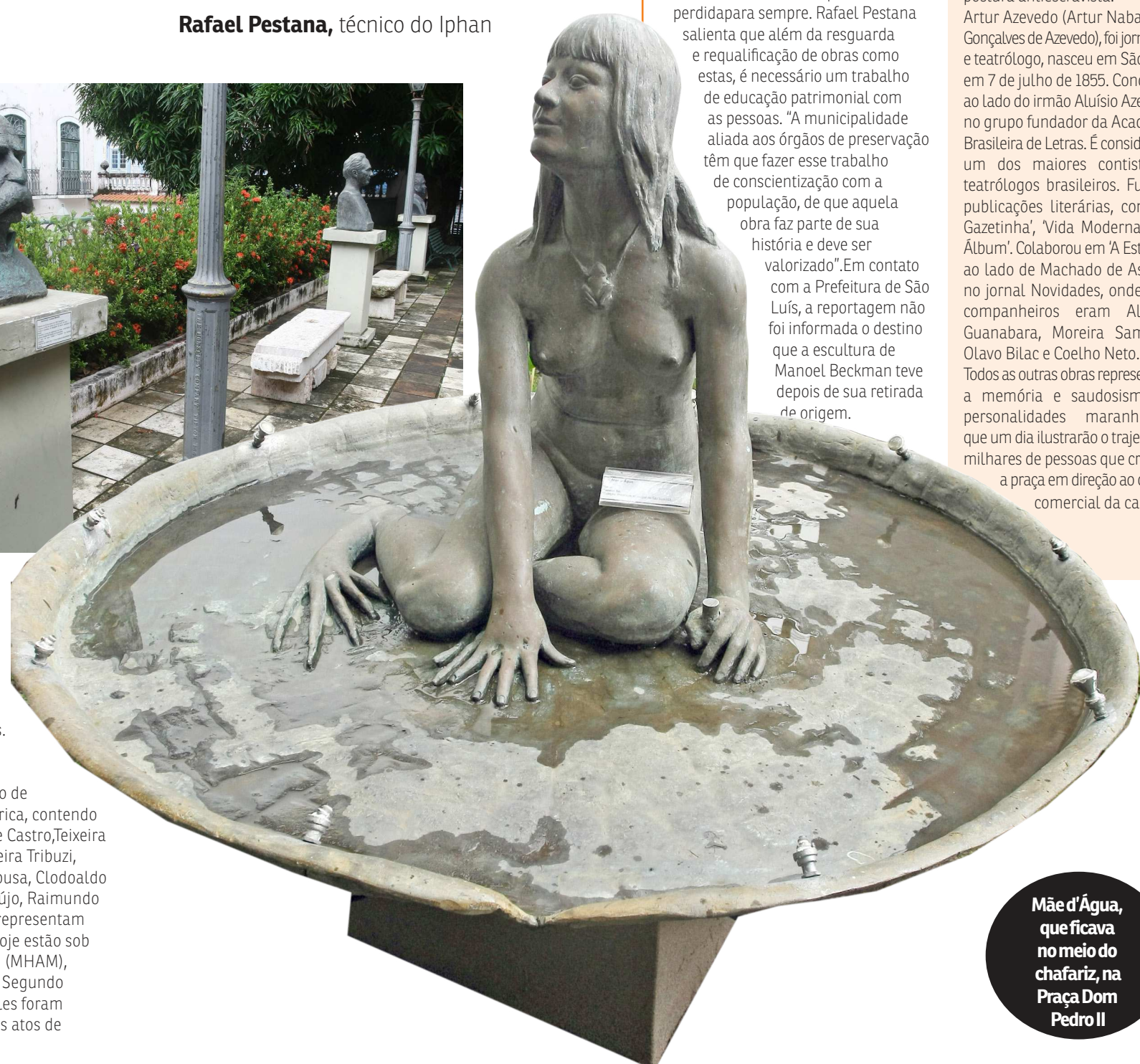
Mãe d'Água, que ficava no meio do chafariz, na Praça Dom Pedro II