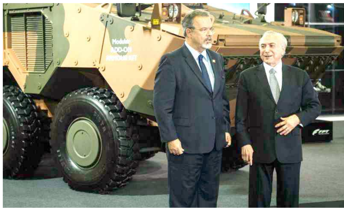
O presidente Michel Temer aproveitou o domingo para se reunir com ministros representantes do Nordeste

A avaliação preponderante hoje, na base aliada, é a de que, se a população não considerar suficientes as mudanças anunciadas até agora na reforma da Previdência — ou a oposição fizer valer a versão de que as mudanças são ínfimas —, o governo não terá os 308 votos necessários na Câmara. Portanto, a ordem agora é tentar fazer chegar aos parlamentares que as mudanças são significativas e ajudarão, em especial, os mais pobres, como o trabalhador rural.