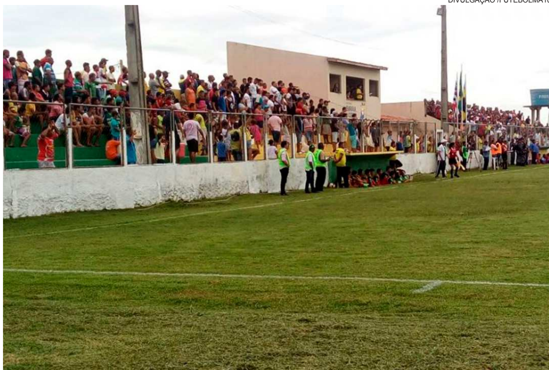
Cordino tem futebol de time grande, mas o estádio de Barra do Corda tem poucos lugares para a torcida