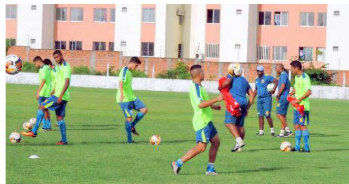
Jogadores do Sampaio durante treinamento com bola no CT