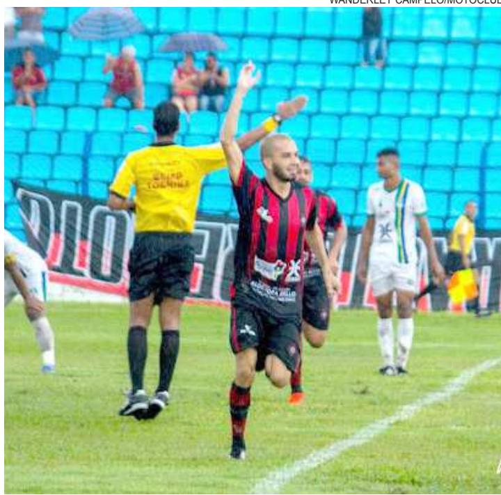
Tudo é alegria e muita vibração no Moto, que amanhã pega o Imperatriz