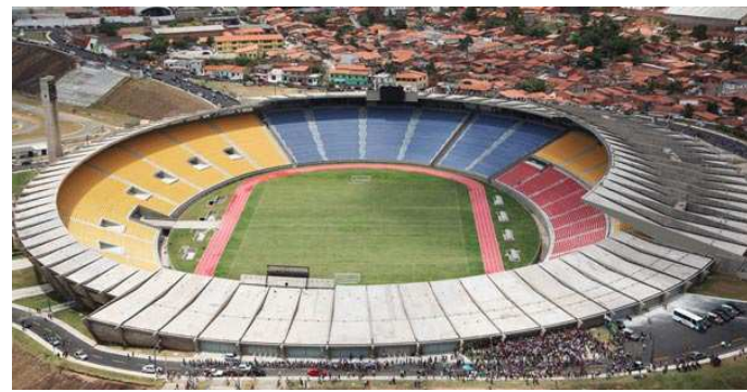
Estádio Castelão será palco do jogo Santos-AP x Paysandu-PA