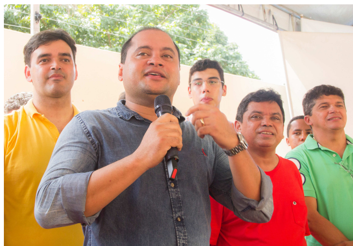
Rocha discursa rodeado por apoiadores de diversos campos políticos

“Essa é a mudança do Maranhão, colocar o pé no chão,