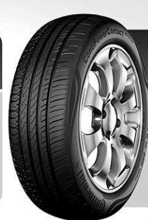
ContiPowerContact 205/55 R16