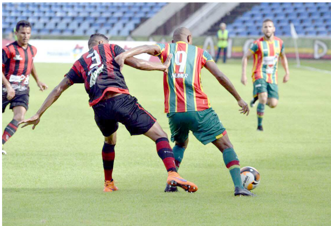
Superclássico foi disputado em campo, mas o finalista do segundo turno pode ser conhecido só no STJD

Como o regulamento tem validade de dois anos, o Moto requer o cumprimento daquilo que foi feito em 2016, por considerar aquela decisão correta.