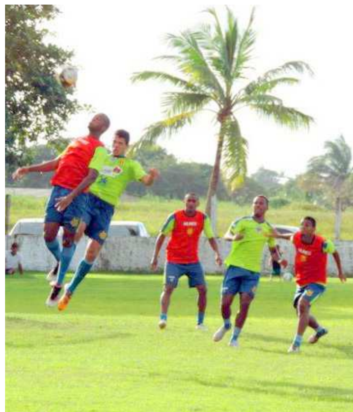
Jogadores do Sampaio treinam no CT José Carlos Macieira

"Estou me dedicando diariamente para corresponder em campo quando for preciso. Tive a felicidade de marcar um gol de falta no amistoso, e, caso tenha outra chance, espero guardar novamente", disse ao site oficial do clube.