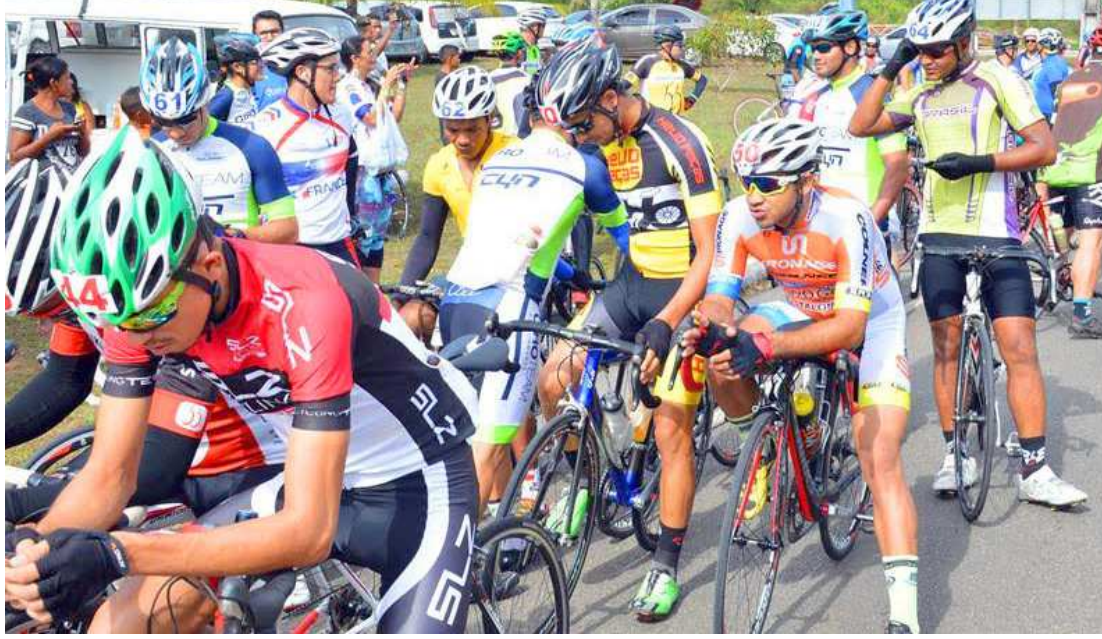
Ciclistas preparam-se para as disputas da Prova Cidade de Caxias, marcada para o fim desta semana

distância e 360 quilômetros da capital do Maranhão, São Luís.