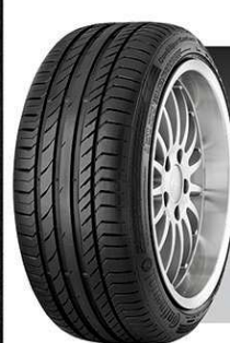
ContiPowerContact 195/60 R15