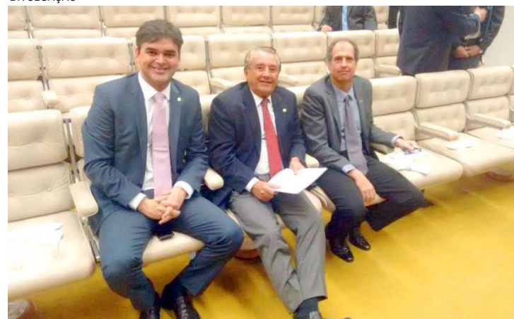
O empenho da Frente Parlamentar prevê a criação de uma unidade do ITA

estado do Maranhão. “O CLA é certamente o melhor local