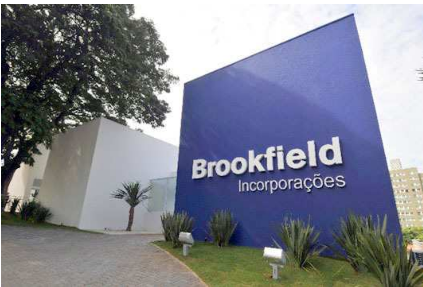
Brookfield Business é uma empresa líder global em gestão de ativos que, após a compra, assumiu o controle de 70% da Odebrecht Ambiental

Desde 2015, a BRK Ambiental é responsável pelos serviços de água e esgoto, ao longo de 35 anos, em São José do Ribamar e Paço do Lumiar que, juntas, abrigam mais de 320 mil pessoas. A concessionária tem como principal meta ampliar o fornecimento de água tratada para 100% dos domicílios da região até 2020, bem como a implantar sistemas de esgotamento sanitário para atender 90% dos habitantes da área urbana em até dez anos. Para isso, estão sendo investidos mais de R$ 450 milhões em obras de recuperação, ampliação e modernização dos sistemas.