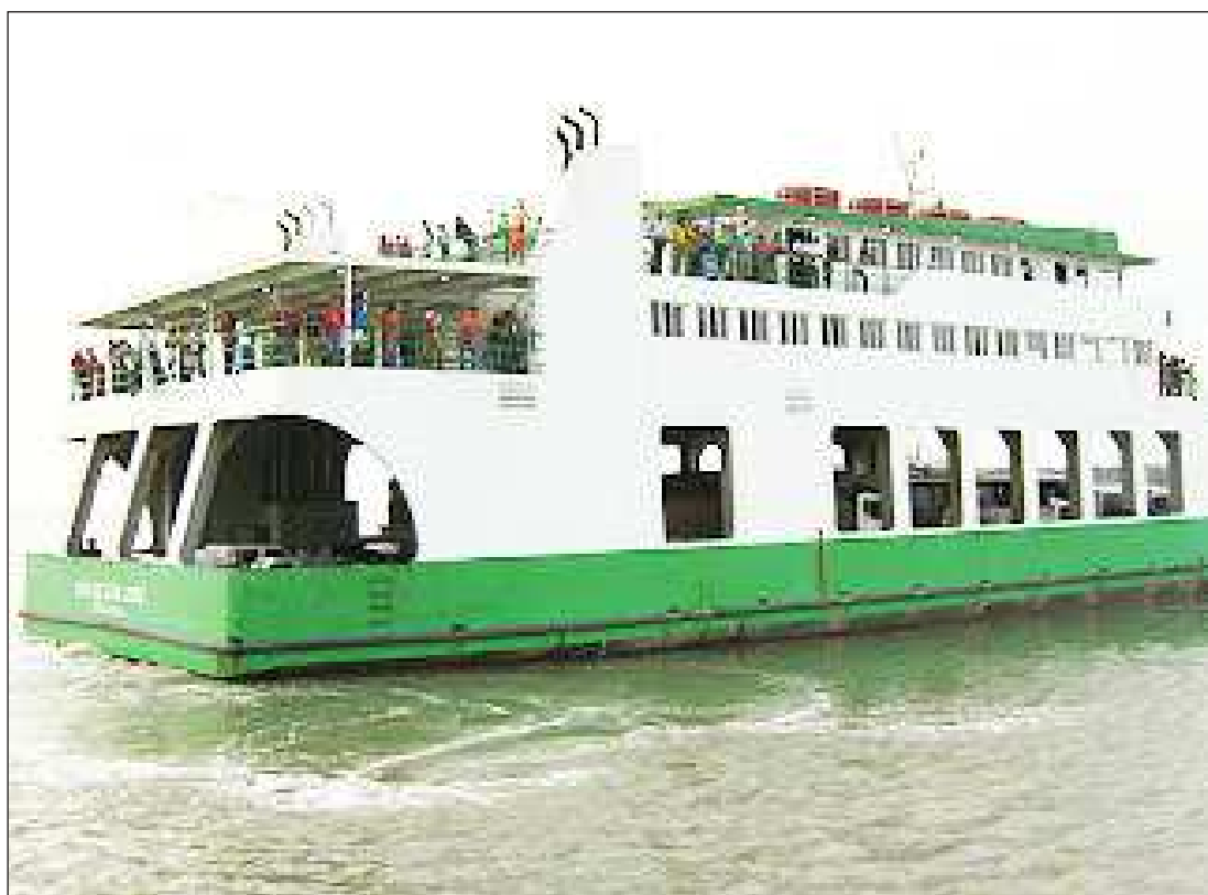
Reajuste das passagens teria ocorrido por conta do aumento do ICMS cobrado pelo governo estadual

O Imposto sobre Circulação de Mercadorias e Prestação de Serviços (ICMS) é um tributo que incide sobre a movimentação de mercadorias em geral, o que inclui produtos dos mais variados segmentos como