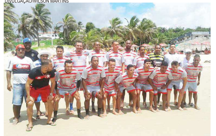
Equipe do CE/São Francisco está garantida na grande final