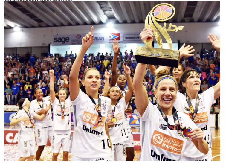
Jovens do Corinthians exibem o troféu de campeãs da Liga