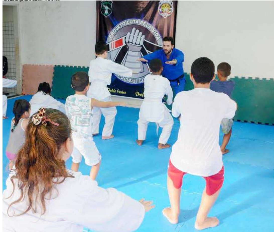
Projeto social de grande importância motiva meninos e meninas por meio das artes marciais

A ideia inicial do projeto é aproximar a polícia da sociedade e diminuir esse distanciamento que existe