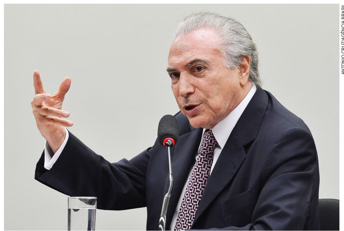
Remodelagem da imagem de Temer passa por mudança no vocabulário, mostrando um político menos formal

"Presidente, o senhor é um homem muito certinho. O senhor tem algum hobby? O senhor joga bola, o senhor vai em festa junina? O senhor cozinha? O que o senhor faz?", perguntou a ele o apresentador Ratinho, do SBT, no