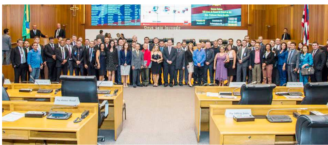
Solenidade contou com a presença do superintendente do Banco do Brasil em São Luís, além de autoridades