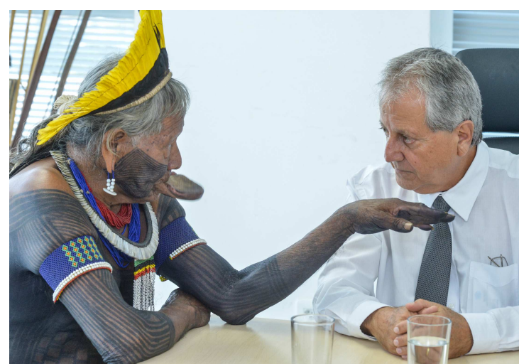
Sobre conflitos indígenas, Costa afirmou que não tem como se evitar

Segundo o ministro, o governo quer legalizar as terras indígenas e estuda a realização de mutirões para agilizar os processos. "Não temos nenhuma restrição. O governo quer lega-