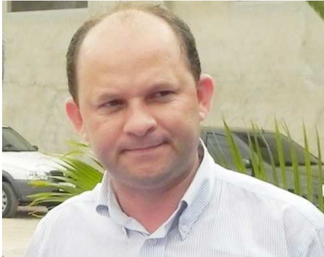
Advogados de Pacovan tentam, no Judiciário, a liberdade dos 18 presos na Operação Jenga

do Poder Judiciário vem de políticos e empresários com envolvimento nas negociações escusas para pagamentos de empréstimos ilegais no financiamento de campanhas, principalmente nos municípios. Esquema que sempre proporcionou vitórias em eleições no Executivo e Legislativo de todas as esferas dos poderes.