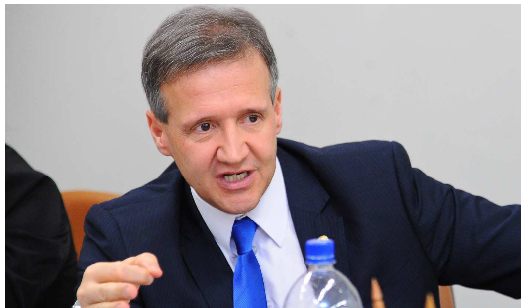
Deputado federal Aluísio Mendes chamou os índios Gamela de pseudoindígenas

Ao deputado do PTN, Serraglio disse não ter sido informado das ocorrências anteriores em Viana com ocupações de fazendas pelos índios Gamela, e mostrou-se irritado com o presidente da Funai. Antecipou até que iria demitir a diretoria do órgão, responsável pela política indigenista do Brasil.