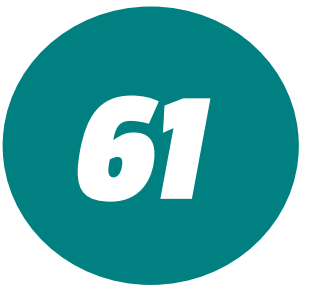
veículos desse tipo doados aos municípios neste ano

Para o secretário de Estado de Saúde (SES), Carlos Lula, o suporte ofertado pelo programa estadual é indispensável para os municípios. “A gente sabe das dificuldades dos municípios. Pela primeira vez, temos esse programa voltado para o fortalecimento da saúde do município com a entrega de ambulâncias. Nunca o Estado entregou tantas ambulâncias em tão pouco tempo”, destacou.