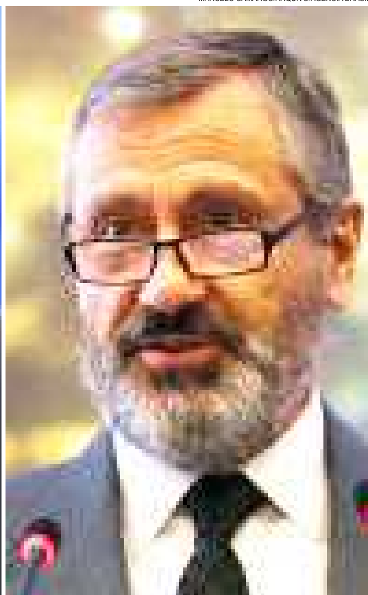
A troca de cargos ocorre em momento delicado, às vésperas do julgamento da chapa Dilma-Temer no Tribunal Superior Eleitoral (TSE)