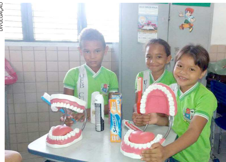
Crianças aprendem sobre a importância da higiene pessoal no dia a dia