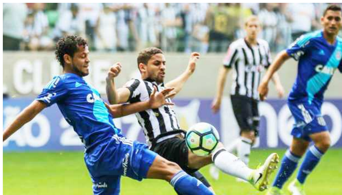
O Atlético-MG jogou mal e empatou a partida com a Ponte Preta nos últimos minutos do segundo tempo

O começo do Atlético-MG no Brasileirão não é nada positivo. O time tem apenas dois pontos conquistados em três rodadas - duas delas com jogos em casa, o que é ainda mais preocupante. Roger lembra o desempenho médio de um campeão do Brasileirão e alerta sobre fim da “reserva” já na terceira rodada.