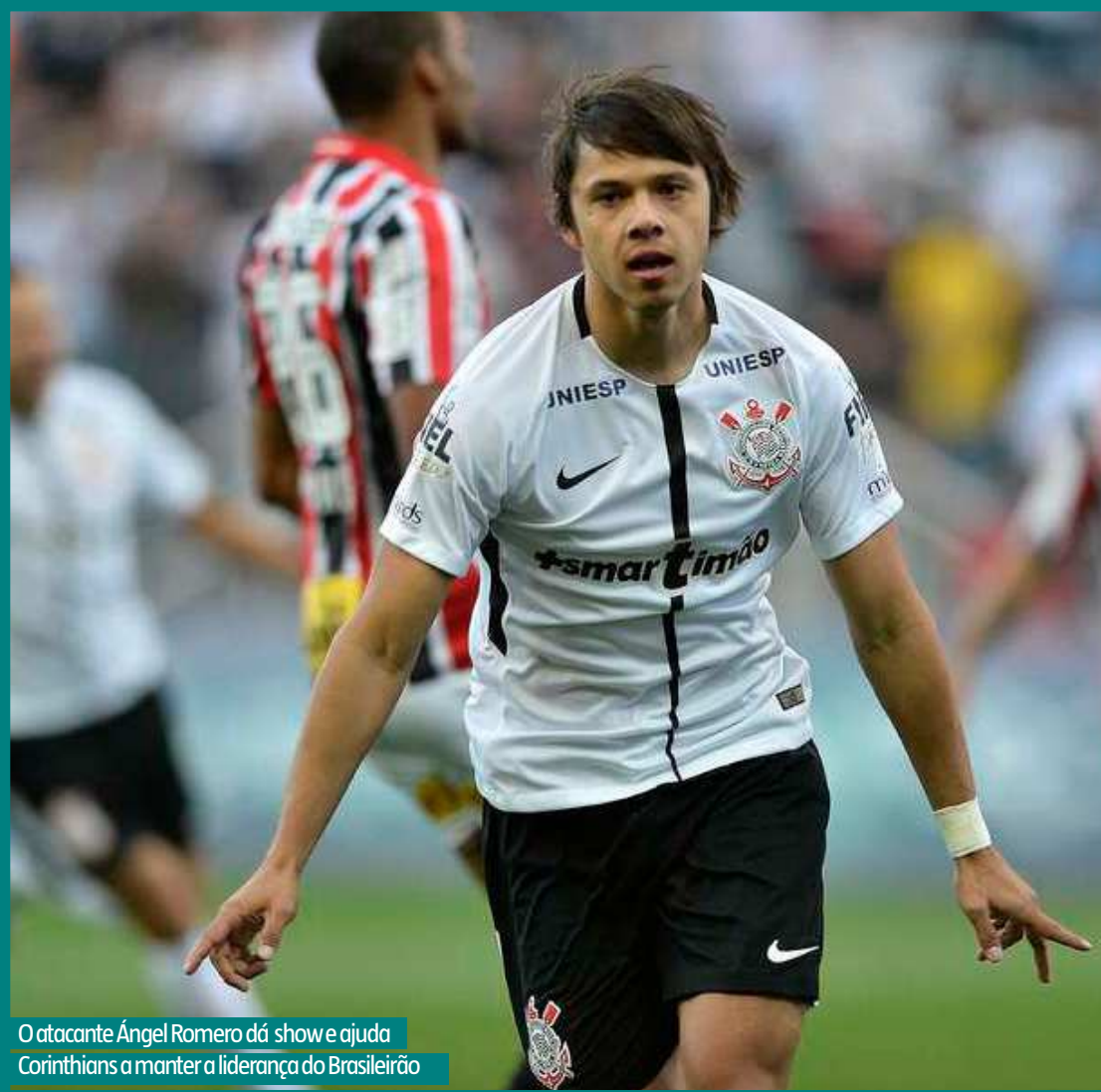
O atacante Ángel Romero dá show e ajuda Corinthians a manter a liderança do Brasileiro