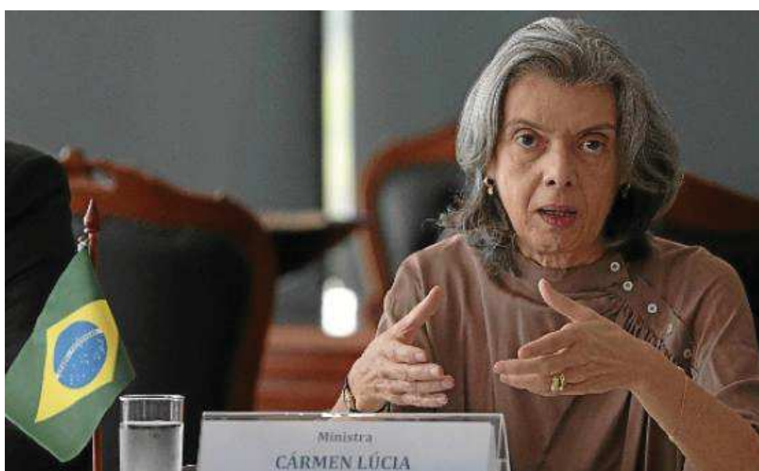
Ministra Cármen Lúcia, presidente do Supremo Tribunal Federal, classifica monitoramento como inadmissível

Cármen Lúcia afirmou que o STF “repudia, com veemência, espereira espúria, inconstitucional e imoral contra qualquer cidadão e, mais ainda, contra um de seus integrantes