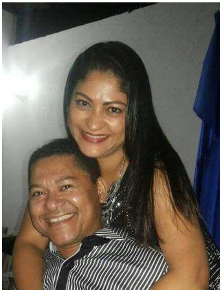
Tenente-coronel mata companheira e depois comete suicídio

A agente penitenciária ainda foi socorrida com vida e enca-