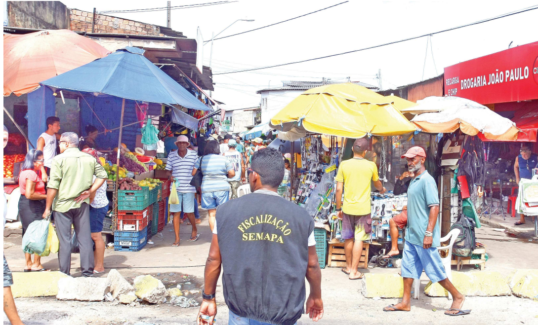
Segundo a Semapa, a realocação já era uma demanda antiga e que a fiscalização vai permanecer constante

Apesar da falta de infraestrutura e da concorrência desleal com os pontos comerciais que já existem na região há mais tempo, os feirantes desmontaram suas barracas e as posicio-