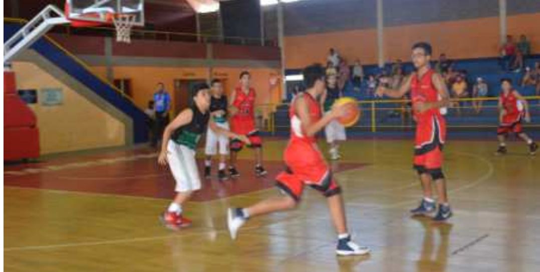
Jovens participaram das disputas do basquetebol e proporcionaram bons espetáculos no fim de semana