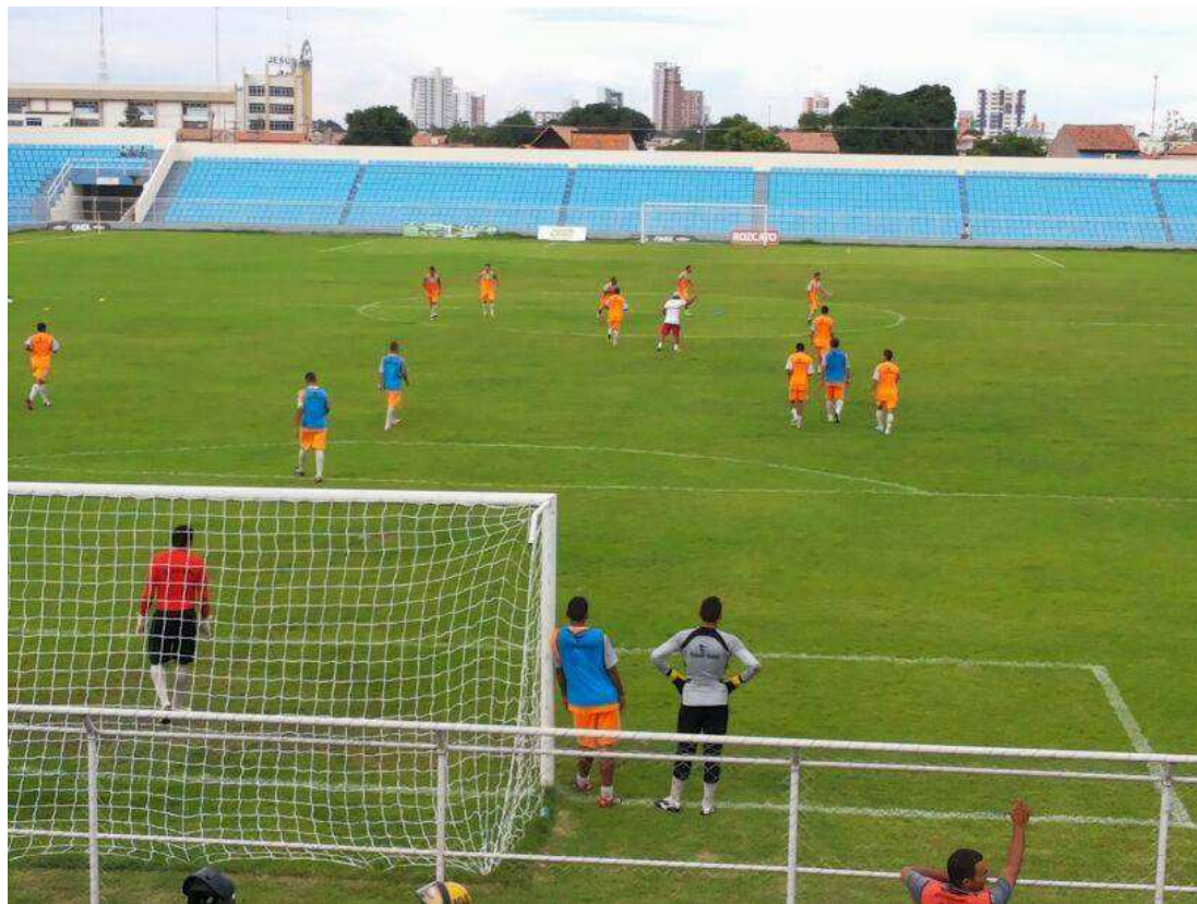
Estádio Frei Epifânio, em Imperatriz, local do último jogo do Campeonato Maranhense de Futebol 2017

O prefeito de Barra do Corda, em princípio, havia prometido ampliar a capacidade