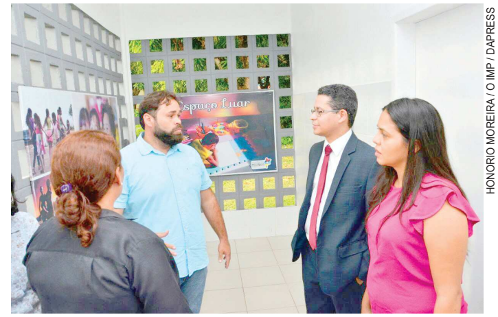
Secretário de Estado da Saúde faz vistoria no Hospital Aquiles Lisboa