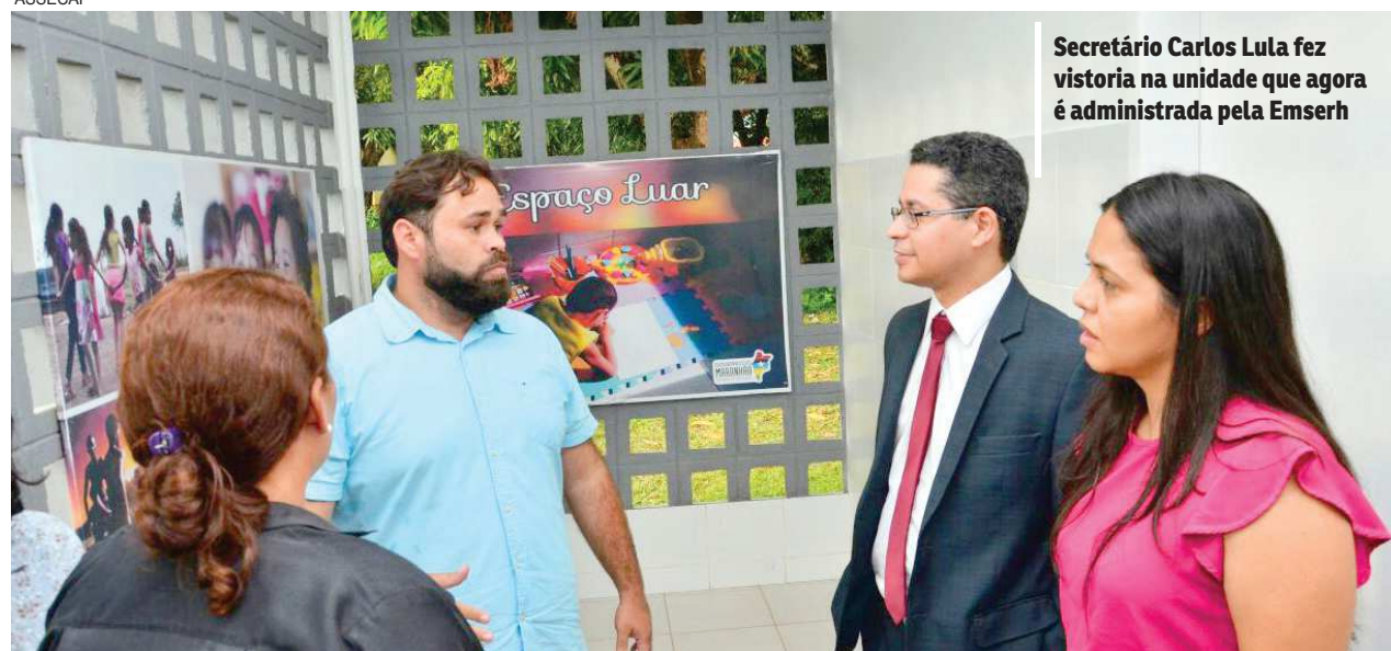
Secretário Carlos Lula fez vistoria na unidade que agora é administrada pela Emserh