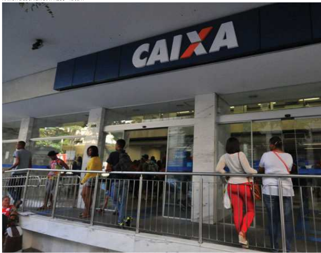
Mais de 2 mil agências já abriram no sábado, entre 9h e 15h, para saques, solução de dúvidas e outros acordos

Independentemente das próximas datas, as pessoas que fizeram aniversário nos meses anteriores ainda podem sacar os valores ou transferi-los para suas contas correntes. A previsão é que o último lote, para nascidos em dezembro, seja pago a partir de 14 de julho. De acordo com a Caixa, não haverá prorrogação do calendário de pagamentos e todos os trabalhadores poderão sacar os recursos das contas inativas até 31 de julho.