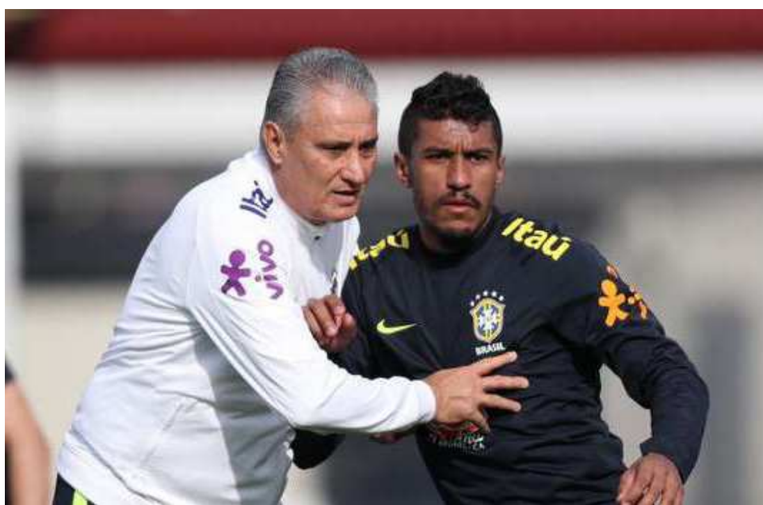
Técnico Tite deverá fazer novos testes com jogadores da Seleção no amistoso desta manhã na Austrália

"Se eu for para casa e não der a eles a oportunidade de jogar, qual sentimento enquanto