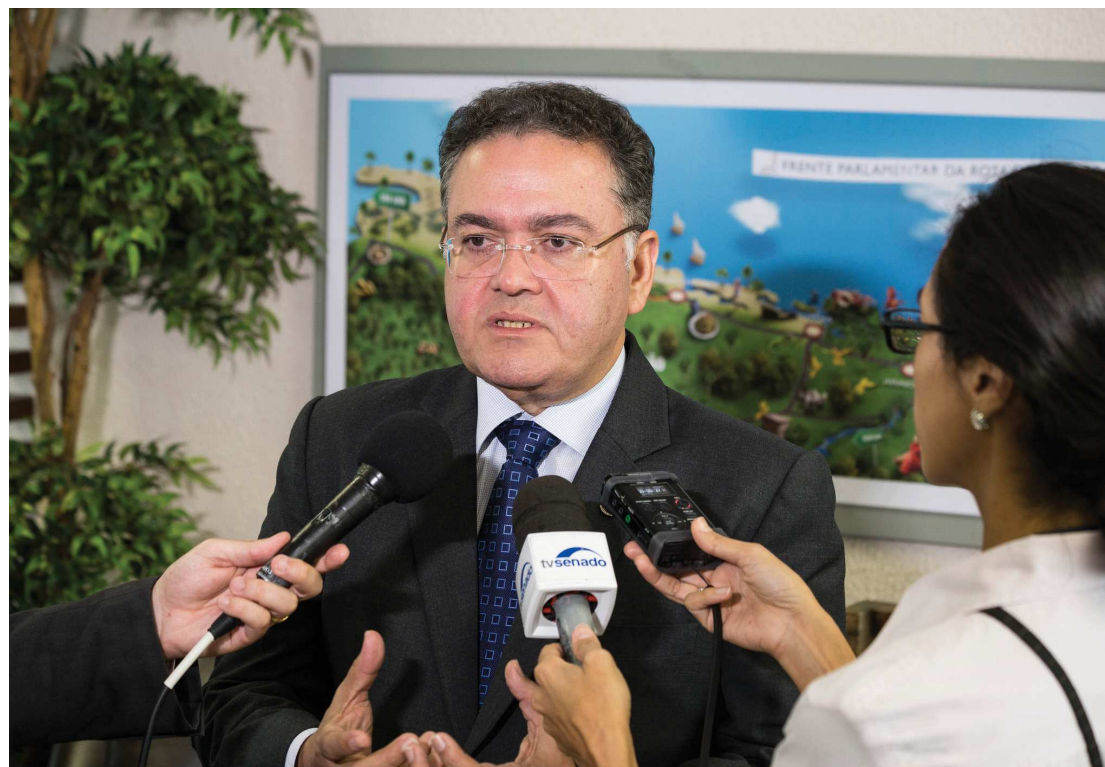
Senador maranhense Roberto Rocha (PSB) é autor de projeto de lei para reduzir a tarifa energética

Rocha (PSB) – autor do Projeto de Lei 260/2017 –, a proposta foi idealizada para diminuir as dificuldades de pessoas de baixa renda pagar por esses reajustes. O último, por exemplo, aconteceu no início de agosto, quando a Aneel anunciou alteração para cor vermelha a bandeira tarifária. Isso significa que o consumidor vai ter que desembolsar mais para pagar a energia no próximo mês.