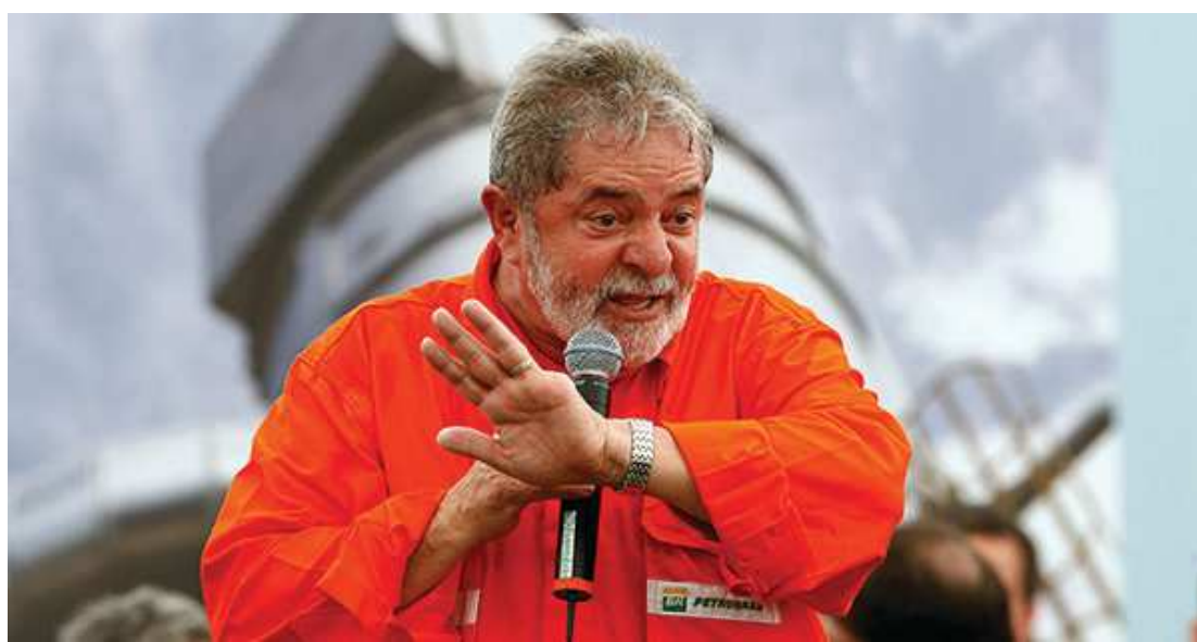
Lula diz que não está acima da lei, mas o juiz também não está. Além disso, afirma já ter provado sua inocência

A plenária da CUT foi em Madureira, na zona norte do Rio, na quadra do Império Serrano - escola de samba historicamente de esquerda, fundada por sindicalistas em 1947. Participaram do ato centenas de pessoas, entre sindicalistas, militantes e moradores da região, que gritaram o nome dele como presidenciável em 2018. Lula fez um discurso de cerca de meia hora em que criticou as reformas do governo Michel