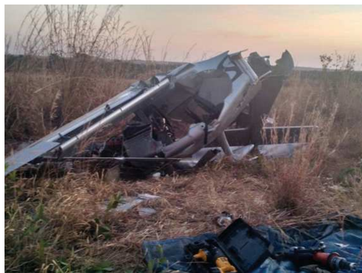
Avião de pequeno porte caiu próximo ao Clube Aeronáutico de Luziânia

Ontem (13/), investigadores do 6º Serviço Regional de Investigação e Prevenção de Acidentes Aeronáuticos (Seri-pa 6) deslocaram-se para Luziânia para realizar a primeira fase da investigação da ocorrência envolvendo a aeronave. Segundo o Centro de Comunicação Social da Aeronáutica, o início dos trabalhos, chamado de ação inicial, consiste em registros fotográficos,