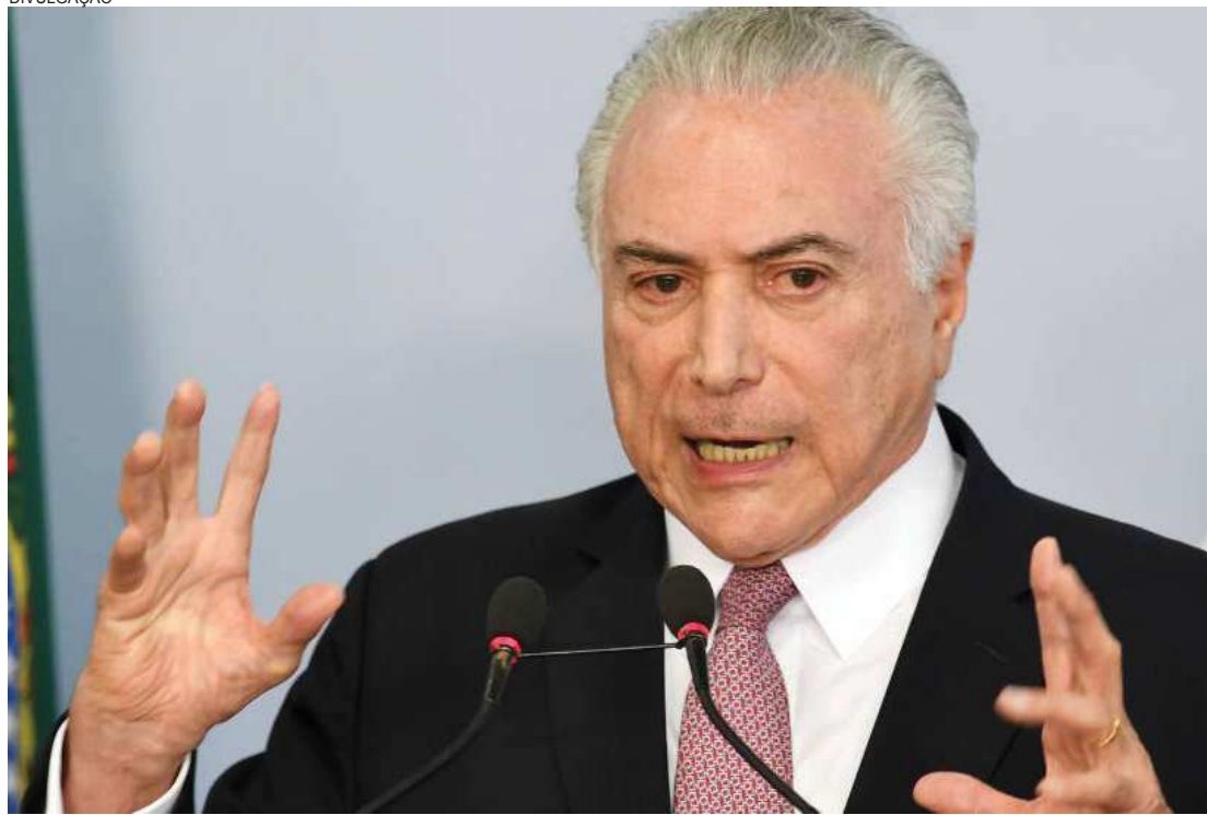
Michel Temer se encontrou com a equipe econômica para afinar o discurso de revisão da meta fiscal