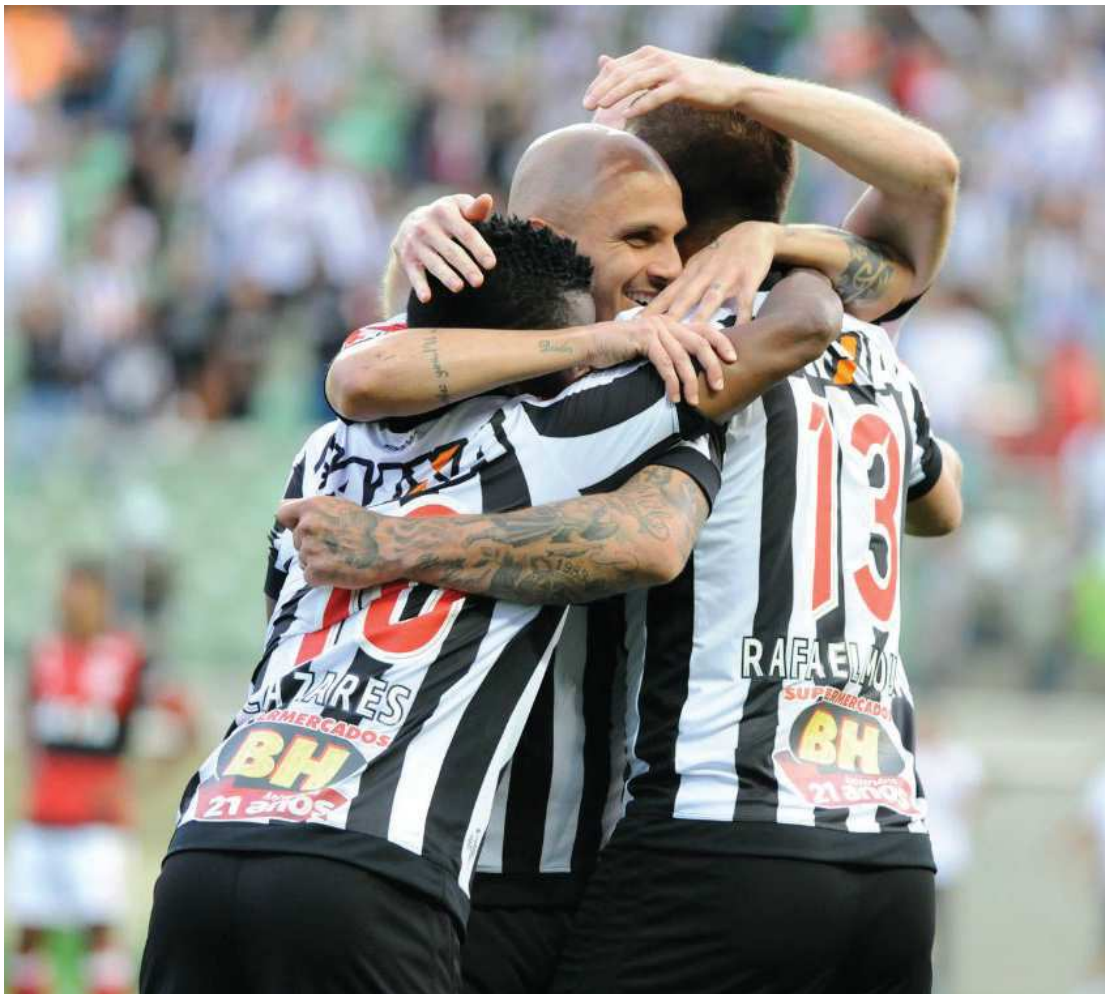
Jogadores do Atlético-MG festejam a conquista da vitória tranquila sobre o time rubro-negro carioca

melho após um erro de passe e logo em seguida o Galo ampliou com Rafael Moura, aproveitando grande jogada de Luan, que não encontrou dificuldades na hora de passar da marcação de Réver.