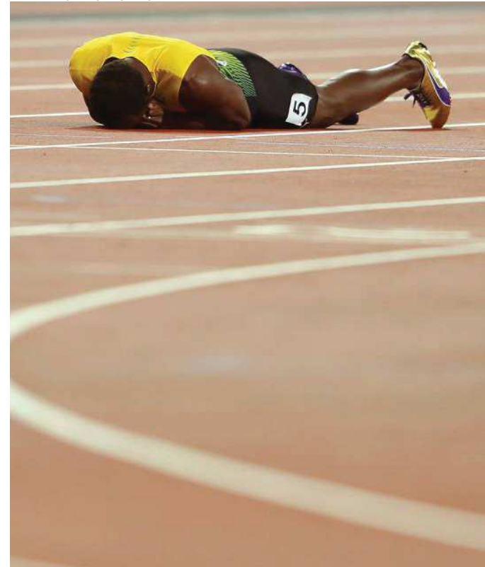
O jamaicano se lesiona durante sua última prova, em Londres