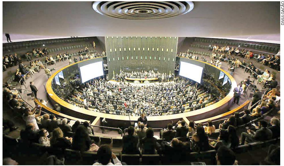
Os gastos com passagens aéreas para os parlamentares variam conforme a distância em relação a Brasília

Para viagens mais longas — embora recentemente um deputado tenha feito o trajeto do aeroporto de Belo Horizonte (MG) até Divinópolis (MG) com Uber, pelo qual pagou R$ 291 —, é possível comprar passagens aéreas ou fretar jatinhos e até lanchas, tudo reembolsado pela cota, sem que precisem encostar nos salários. Com todas essas opções, os deputados escolheram gastar mais com fretamento de aviões do