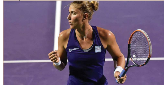
Bia Haddad Maia vai enfrentar a atual campeã de Wimbledon