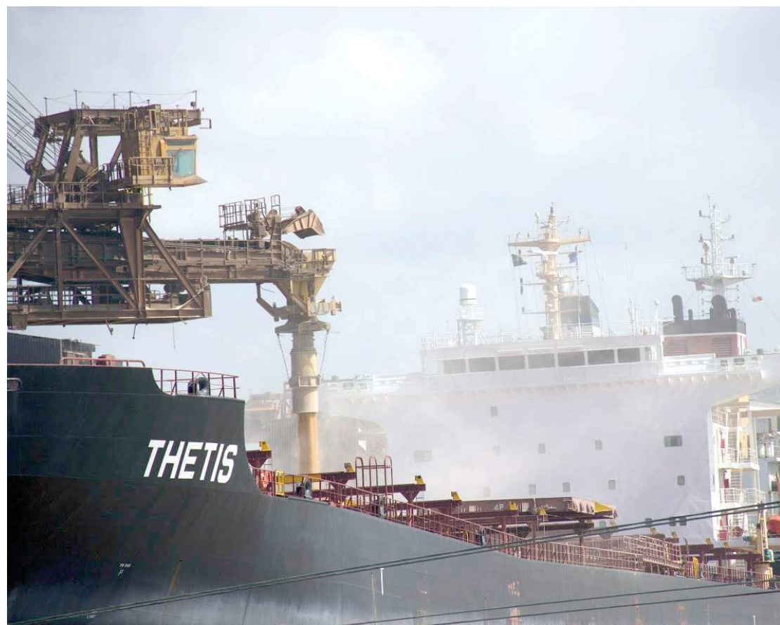
A máxima anterior é do ano passado, quando foram movimentadas cerca de 4,9 milhões de toneladas