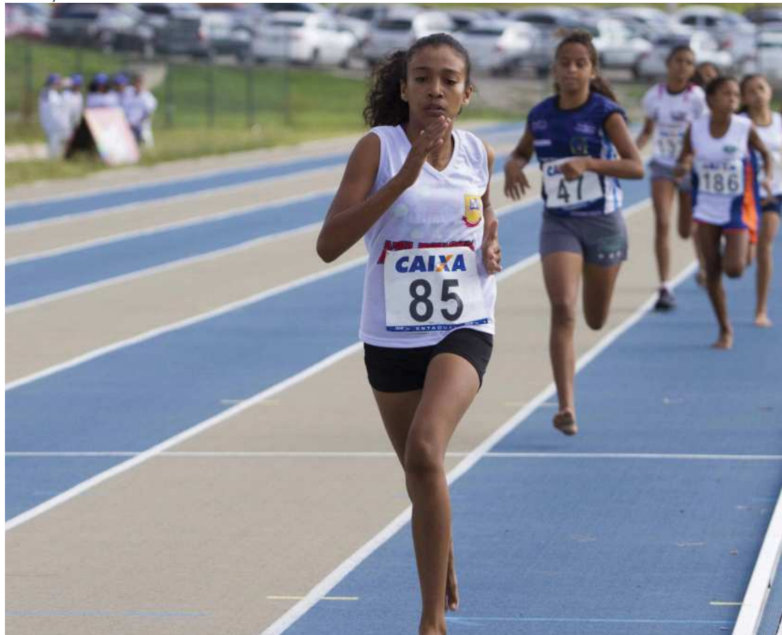
Atletas mostram força e velocidade na pista do Complexo Esportivo Canhotoeiro, nas disputas dos JEMs

brou do esforço para chegar até o pódio. “Eu me esforcei e me dediquei muito para chegar até aqui. Agradeço ao apoio dos meus pais e treinadores e, claro, também tive muita fé em Deus”, disse a atleta.