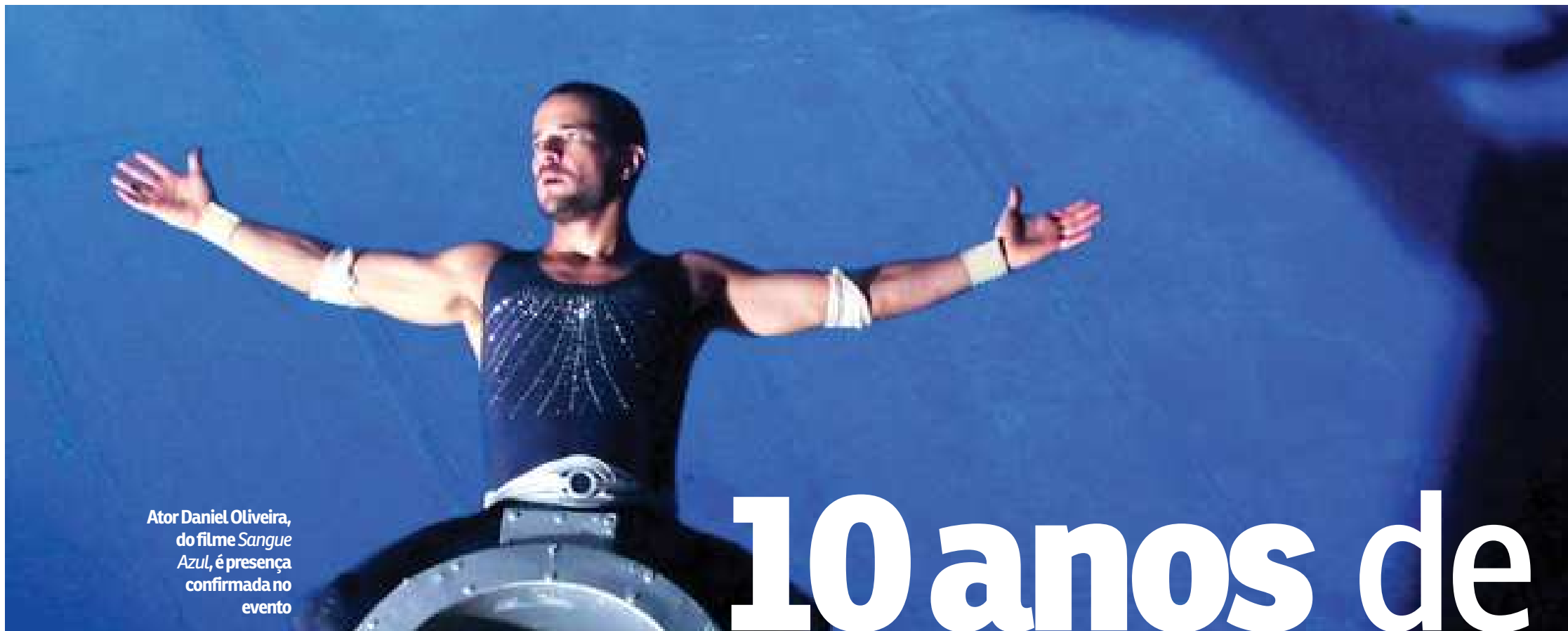
Ator Daniel Oliveira, do filme Sangue Azul , é presença confirmada no evento