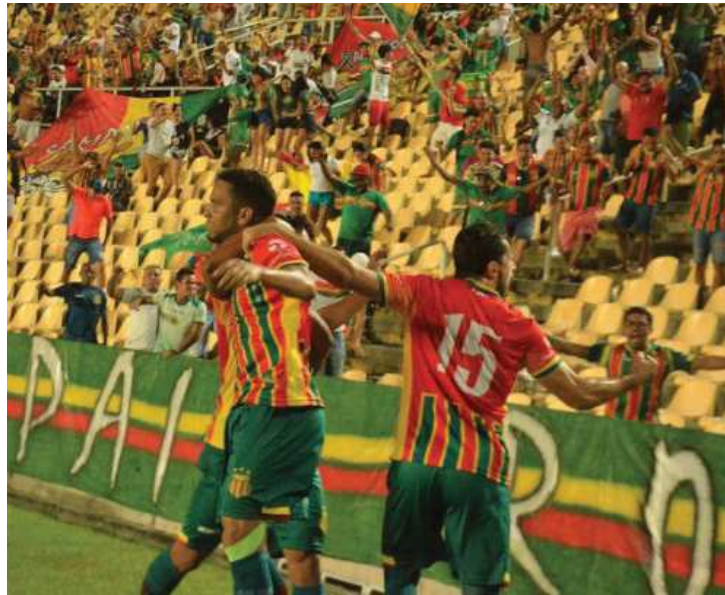
Ainda em clima de euforia, Sampaio sonha com vaga nas oitavas

A rodada manteve o time no G4. Agora, com sete pontos de vantagem sobre o Clube do Remo (quinto colocado), o Sampaio está a um passo do seu objetivo, faltando quatro