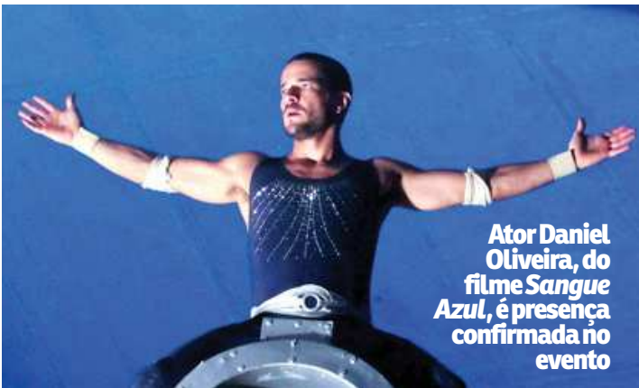
Ator Daniel Oliveira, do filme Sangue Azul, é presença confirmada no evento