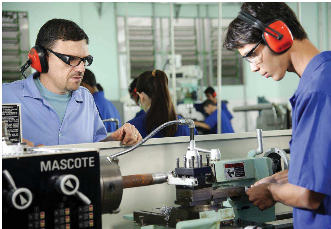
O início dos cursos está marcado para 28 de agosto, e a duração é de pelo menos 160 horas

Essa é mais uma oportunidade para assegurar que todos