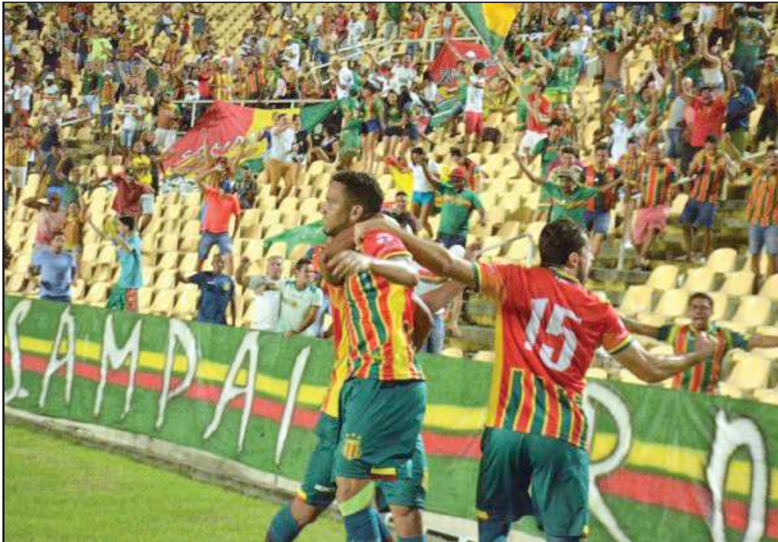
Os jogadores do Tricolor maranhense superaram o Fortaleza e agora acumulam 28 pontos, assumindo a liderança isolada no Grupo A