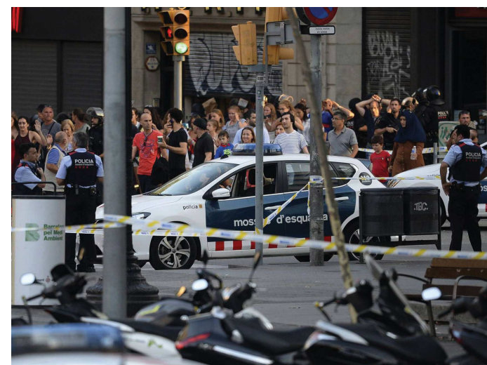
A Polícia Autônoma da Catalunha segue com buscas na região