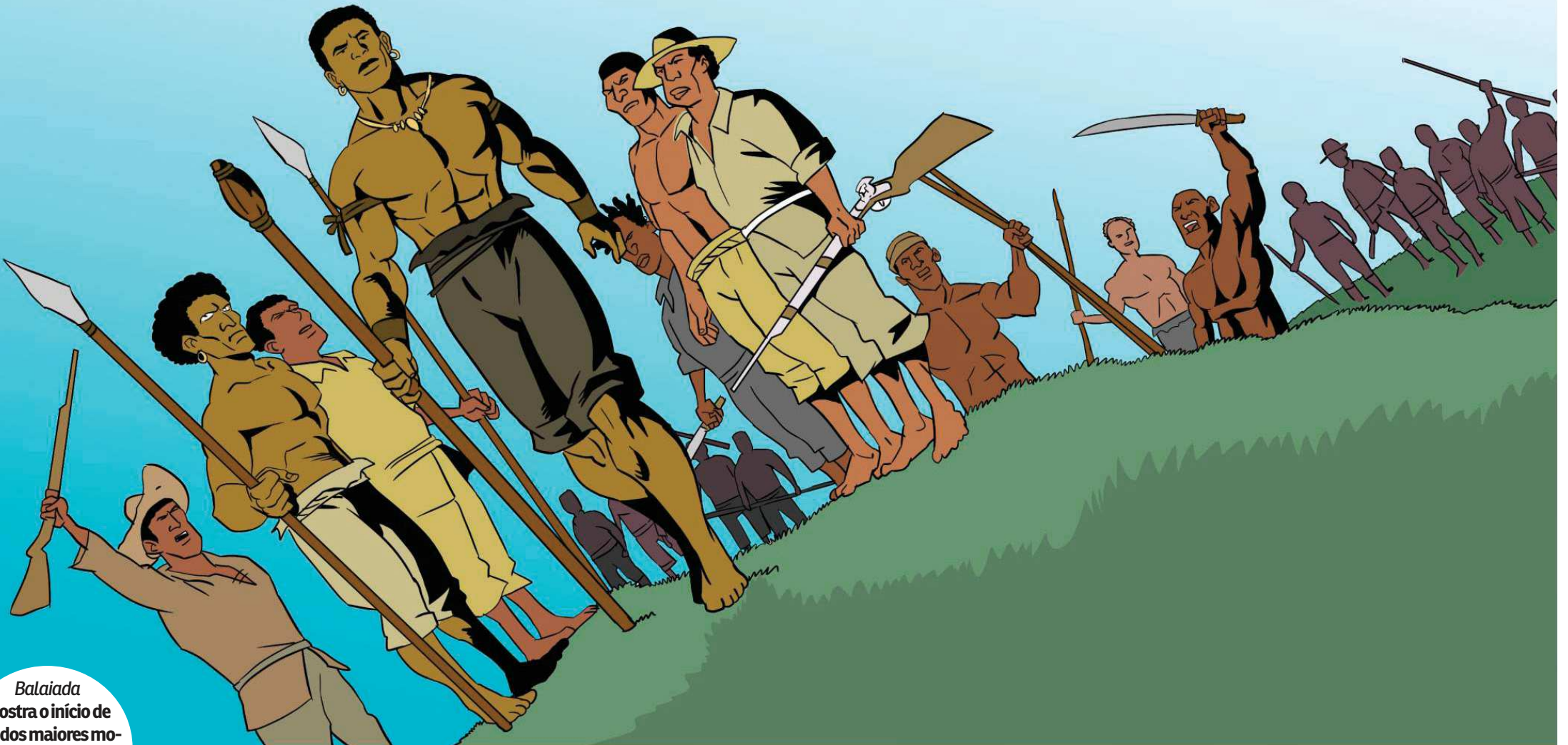
Balaiada mostra o início de um dos maiores movimentos populares pela liberdade no estado