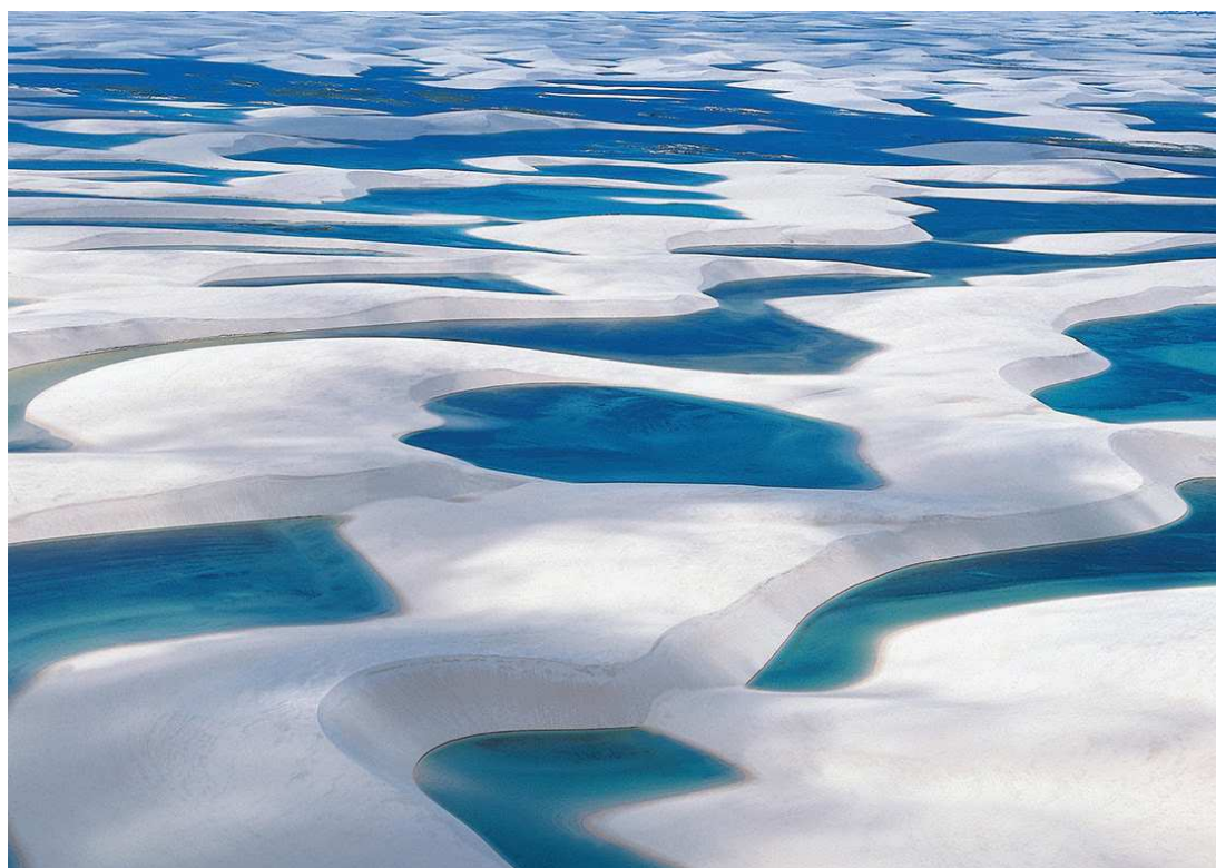
Em Barreirinhas, a ocupação chegou a 90% aos fins de semana e 73% nos demais dias

Além de participação com estandes nas principais feiras nacionais e internacionais, o governo do Maranhão investiu fortemente na divulgação dos destinos maranhenses em locais com maior potencial para atração de turistas: aeroportos, aeronaves e revistas especializadas: "Desde 2015, temos fortalecido a promoção turística, com participação em feiras de negócios, em que apresentamos