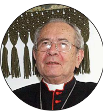
DOM JOSÉ FREIRE FALCÃO CARDEAL

ção. No martírio, manifesta-se o poder de Deus na coragem dos mártires, malgrado a fraqueza humana.