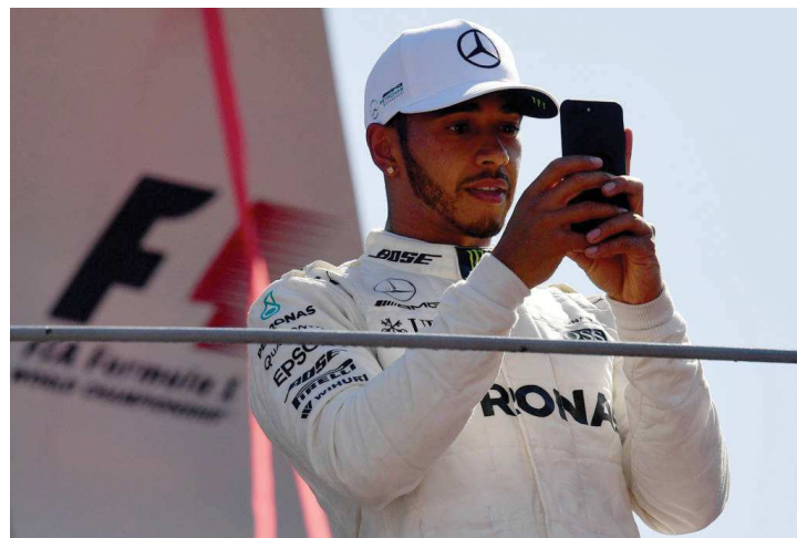
Com vitória, Hamilton garante a ponta do ranking no GP de Fórmula 1

“Acho que aprendemos muito com nossas experiências do passado, mas a Ferrari costuma ter um melhor desempenho em pistas quentes”, declarou o piloto assim que saiu do pódio, neste domingo. “Farei tudo o que for preciso para chegar lá melhor preparado, mas não sabemos o