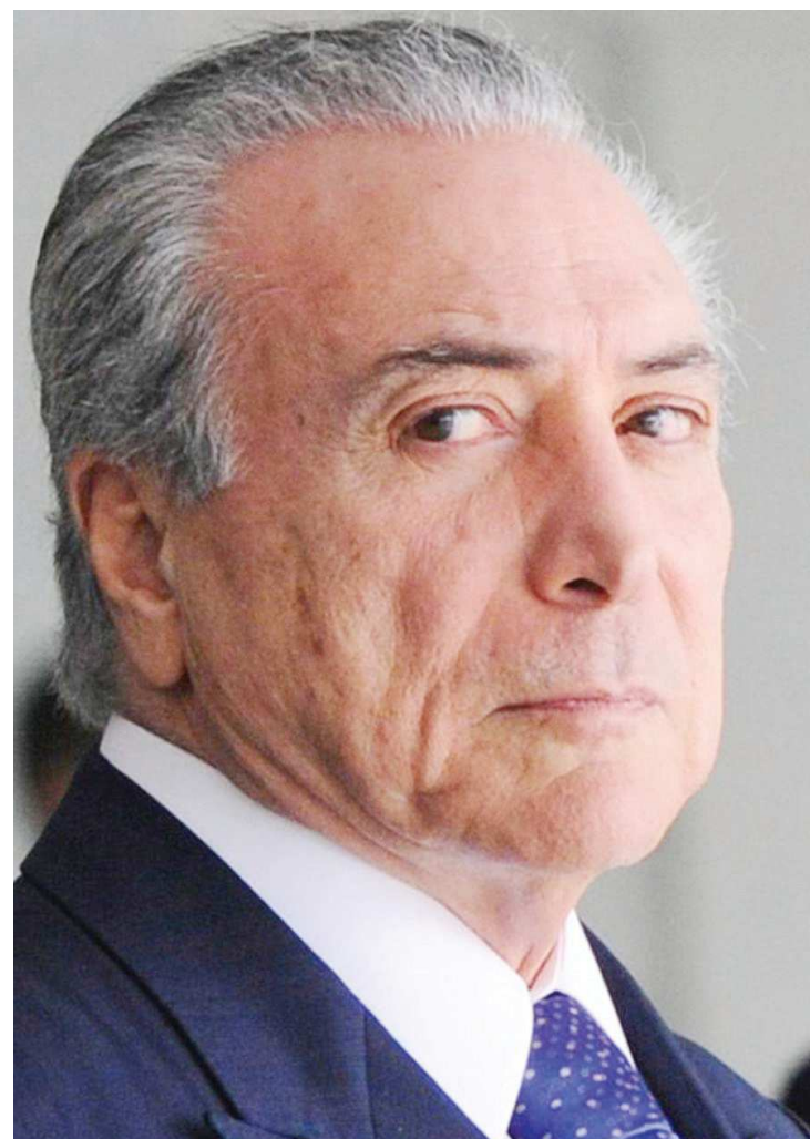
Presidente Temer afirma que reforma da previdência será aprovada

Perguntado sobre como está a articulação da base de apoio do governo no Congresso para a aprovação da Reforma da Pre-