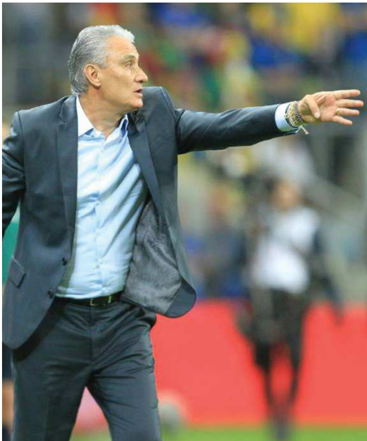
Técnico da Seleção Brasileira evitou criar polêmica com a Colômbia

Meses depois, no reencontro entre Brasil e Colômbia, em um amistoso nos Estados Unidos, Cuadrado acabou expulso por mais uma falta dura sobre Neymar. No ano seguinte, na Copa América, foi o astro brasileiro quem protagonizou um tumulto no final do jogo e levou o cartão vermelho, assim como Bacca. Acabou punido pela Conmebol e perdeu o restante do torneio e o princípio das Eliminatórias para a Copa do Mundo.