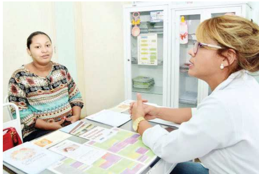
Gestante é atendida pela médica, no Centro de Saúde Valdecy Eleutério, no Residencial Paraíso — Bacanga

O Ministério da Saúde preconiza a realização de, no mínimo, seis consultas de acompanhamento pré-natal, como forma de garantir um acompanhamento preventivo de riscos