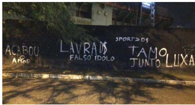
Muros da Ilha do Retiro amanheceram pichados após goleada