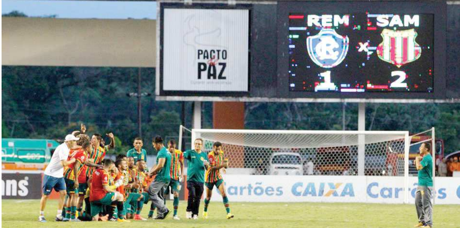
Jogadores e Comissão Técnica do Sampaio Corrêa tiram foto após vitória sobre o clube do Remo