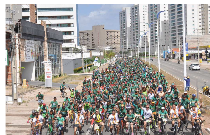
Passeio teve participação de pessoas de várias faixas etárias