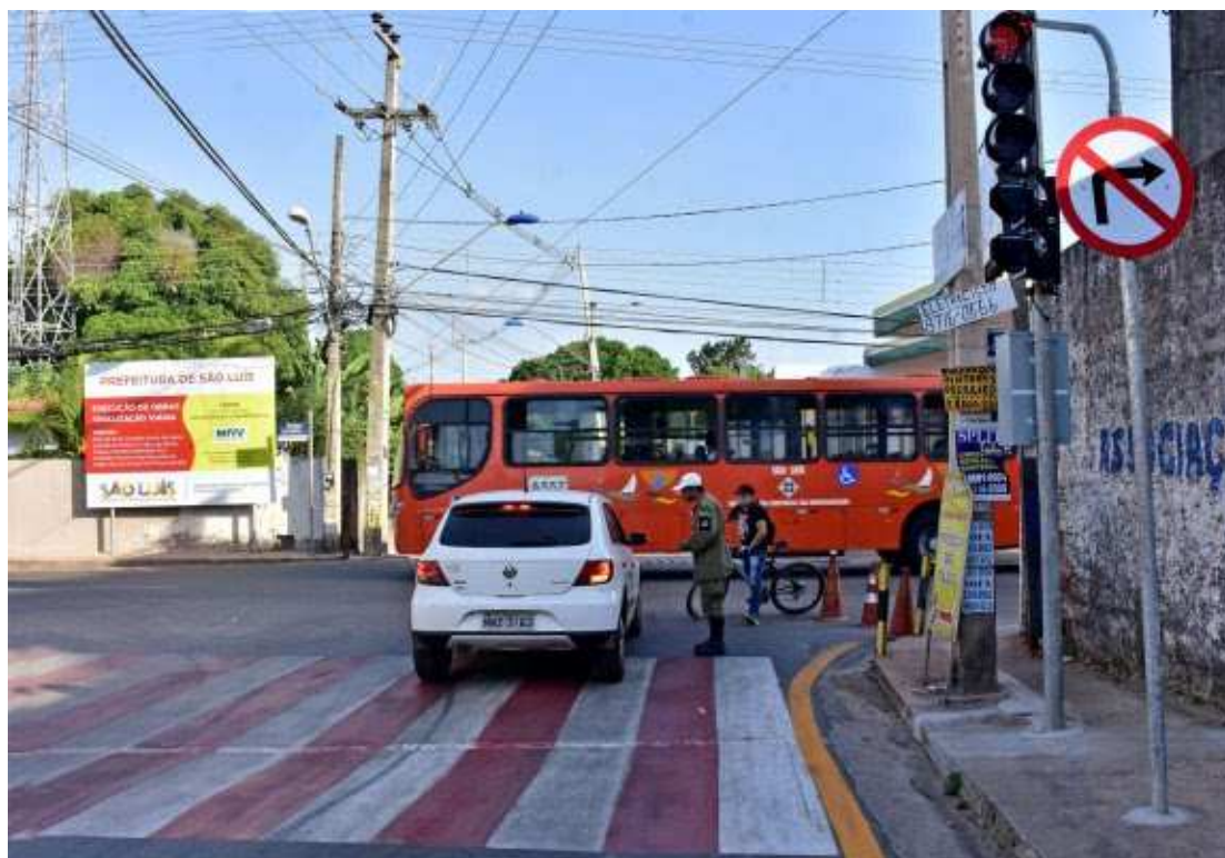
AGENCIA SÃO LUÍS

Ele acrescentou ainda que as vias alvo de modificações estão devidamente sinalizadas horizontal, vertical e semaforicamente para a orientação correta do motorista. Um total de 30 agentes de trânsito vão monitorar o trecho por 24 horas, nestes primeiros 30