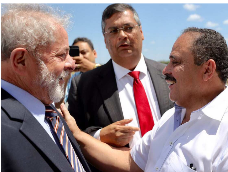
Lula foi recepcionado por Flávio Dino e Waldir Maranhão