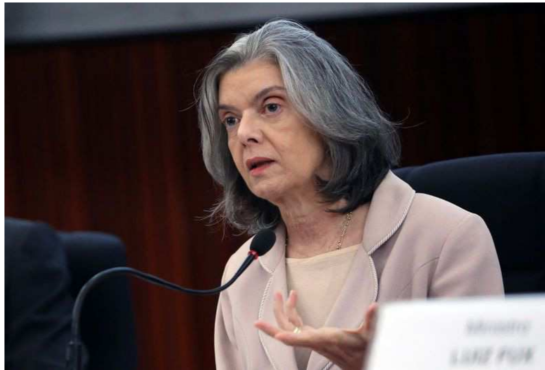
A presidente do CNJ e do STF, Cármen Lúcia, apresentou o anuário Justiça em Números 2017

A lei permite a existência dos "supersalários", como são conhecidos aqueles que maiores que o teto. Segundo entendimento do próprio STF, os "penduricalhos" não entram no cálculo. Apenas seis estados têm menos despesas mensais com magistrados do que o Maranhão. São eles: Acre (R$ 41,9 mil), Ceará (R$ 35,9 mil), Rio Grande do Norte (R$ 34,3 mil), Alagoas (R$ 25,1 mil), Pará (R$ 31 mil) e Piauí (R$ 23,3 mil).