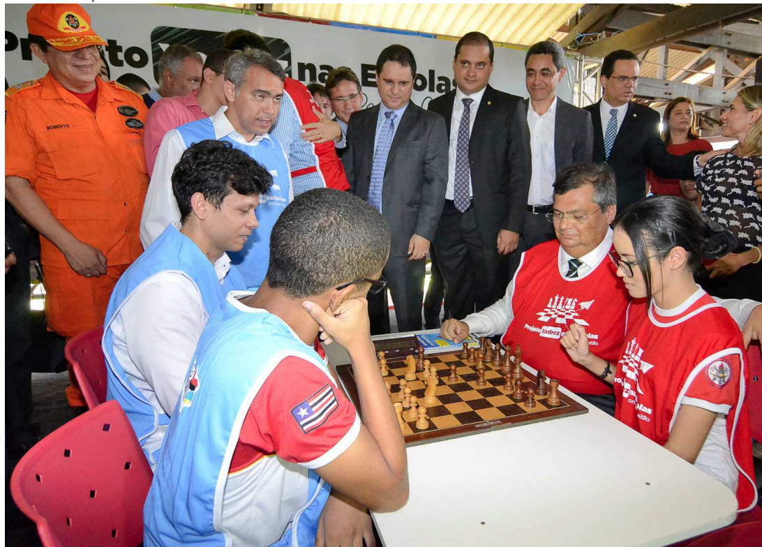
Xadrez reúne estudantes de estabelecimentos escolares e teve a presença do governador Flávio Dino

Portador do Transtorno do Espectro do Autismo, o estudante Breno Azevedo, de 12 anos, tem usado o xadrez para estimular habilidades da comunicação e bloquear comportamentos restritos e repetitivos. Isso foi possível após a implantação do projeto Xadrez na Escola, idealizado por um dos campeões mundiais da modalidade, Rafael Leitão, e desenvolvido pelo Governo do Maranhão.