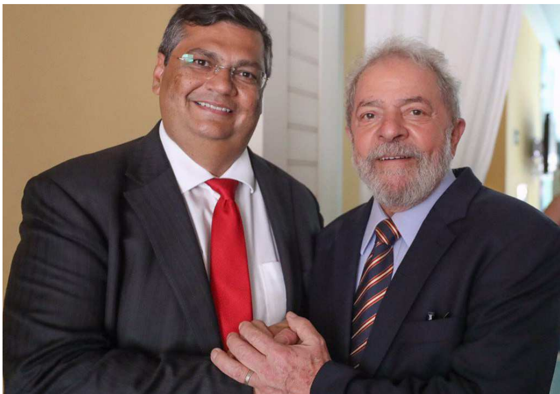
Governador Flávio Dino deu boas-vindas ao ex-presidente Lula, que participará de ações em São Luís

foram visitados por Lula durante esta caravana pelo Nordeste