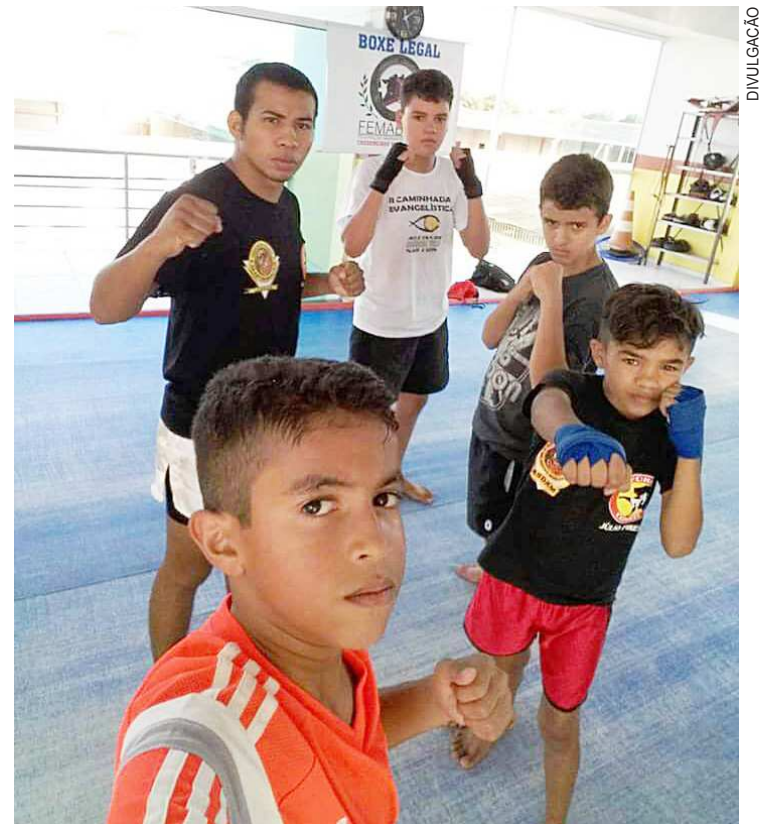
Movimentos variados podem favorecer o desenvolvimento das crianças