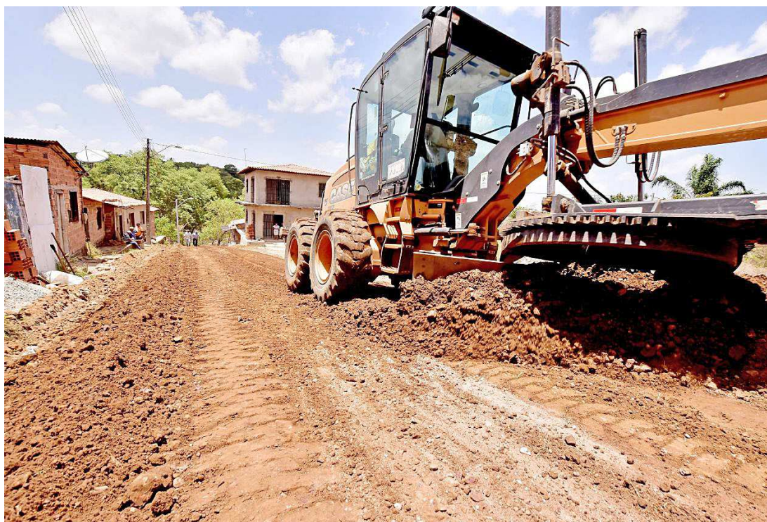
Os trabalhos no Residencial Paraíso incluem pavimentação, drenagem, sarjeta e meio-fio

"O programa Asfalto na Rua está priorizando bairros como o Residencial Paraíso, com áreas degradadas e que agora estão sendo transformadas. Além de garantir mais mobilidade estamos também promovendo a melhoria da qualidade de vida dos moradores, urbanizando