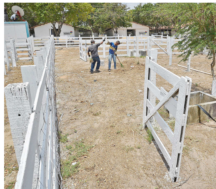
A limpeza começou com antecedência para evitar imprevistos