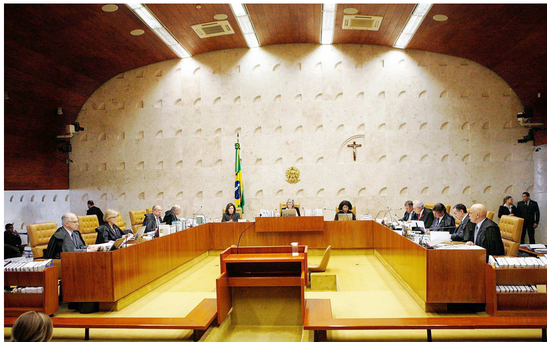
Após cerca de 10 horas de julgamento, os ministros do STF votaram pela necessidade de aval do Legislativo

Após cerca de 10 horas de julgamento, os ministros Edson Fachin, Luís Roberto Barroso, Rosa Weber, Luiz Fux e Celso de Mello votaram pela possibilidade de afastamento sem autorização da Câmara dos Deputados ou do Senado. Alexandre de Moraes, Dias Toffoli, Ricardo Lewandowski, Gilmar Mendes, Marco Aurélio e a presidente, Cármen Lúcia, votaram pela necessidade de aval do Legislativo.