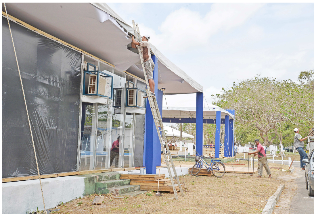
A organização está nos preparativos finais para o evento, que deve reunir cerca de 3 mil pessoas pelo parque

Além do Maranhão, a Expoema terá expositores dos estados do Pará, Piauí, Pernambuco, Paraíba e Rio Grande do Norte. A expectativa da organização é