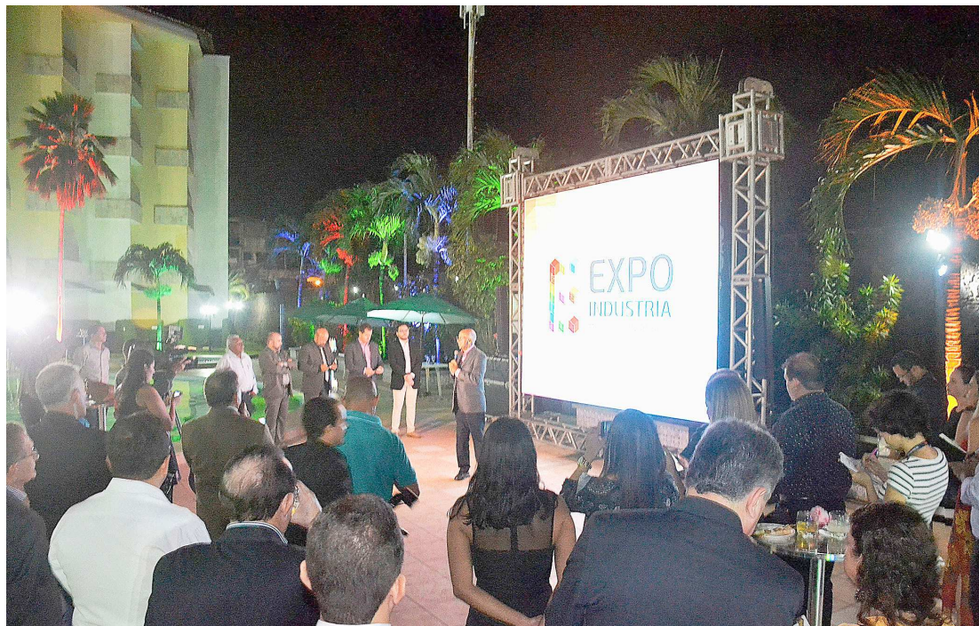
O lançamento da 2ª edição da Expo Indústria MA aconteceu na última terça-feira, no Grand São Luís Hotel

Um dos exemplos dessas novidades que marcarão a edição 2017 da ação é Indústria das Startups, ambiente estimulante à criatividade onde estudantes universitários, divididos em equipes, serão desafiados a criar soluções para problemas das indústrias locais. A equipe vencedora será premiada. Além disso, o espaço, que será coordenado pela Universidade Federal do Maranhão (Ufma), também abrigará bate-papos