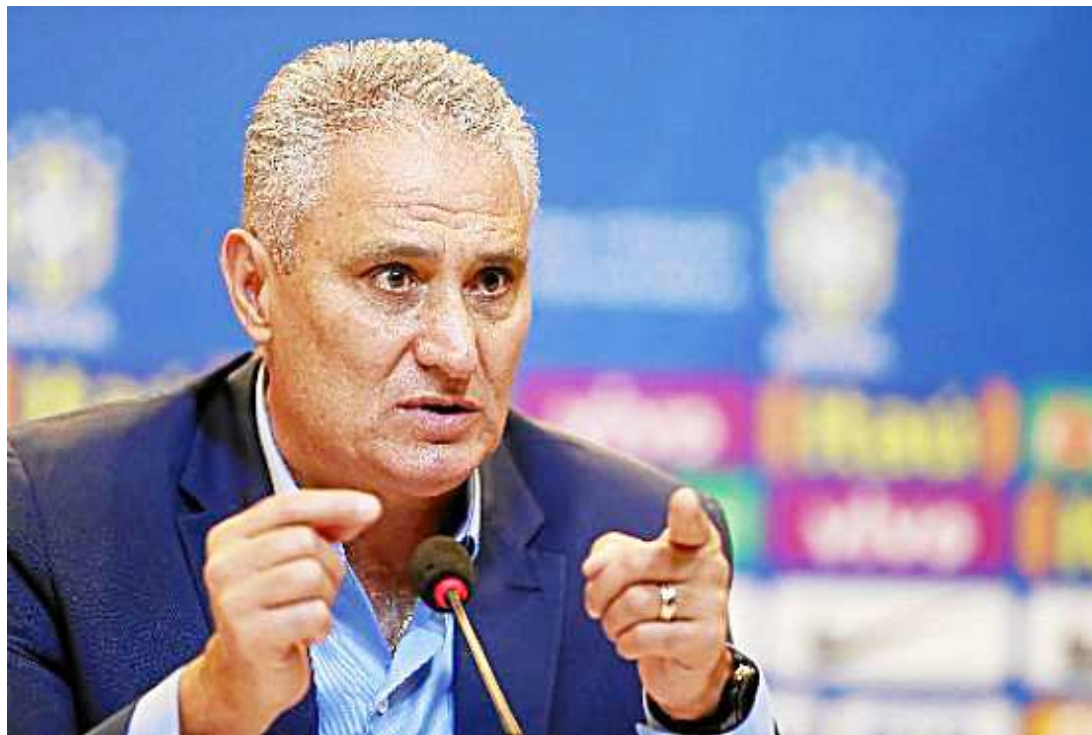
O treinador da Seleção Brasileira afirmou que é mais fácil surgirem novos nomes do meio para frente

De qualquer forma, Tite admitiu que o grupo para a Copa do Mundo da Rússia, no próximo ano, está quase pronto. Sem citar nomes ou posições, o treinador declarou que "o leque está se fechando", o que fica comprovado cada vez que o treinador anuncia uma nova lista com praticamente os mesmos nomes. "O ideal seria que tivéssemos mais tempo para oportunizar (sic) mais. O real: vai se fechando o leque de oportunidades e de número de atletas. Estando aberto, por exemplo, a um Gabriel Jesus da vida surgir num Palmeiras? Sim, mas vai