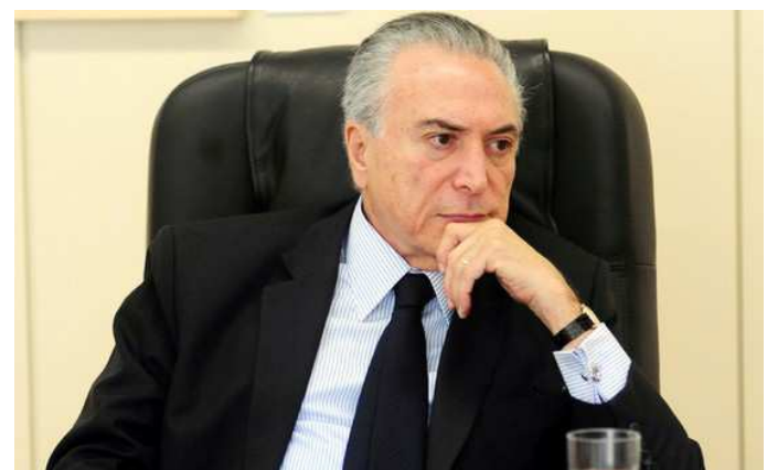
Temer cede após dificuldades para convencer parlamentares

O esperado é que a reforma, enxuta ou não, coloque algum tipo de limite à concessão acumulada de pensões e aposentadorias — seja de até dois salários mínimos, como está na proposta que tramita na Câmara, ou de até cinco, como cogitam os tucanos. É praticamente certo, no entanto, que o Benefício de Prestação Continuada (BPC) e a contribuição rural ficarão de fora, por serem temas impopulares e com economia potencial menos expressiva.