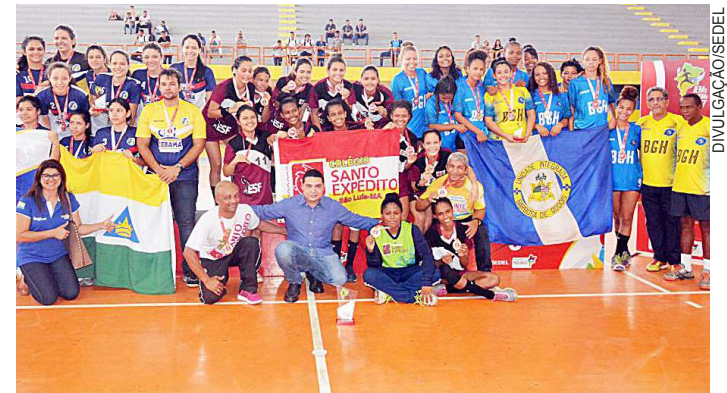
Santo Expedito levou ouro no handebol contra o Cebama