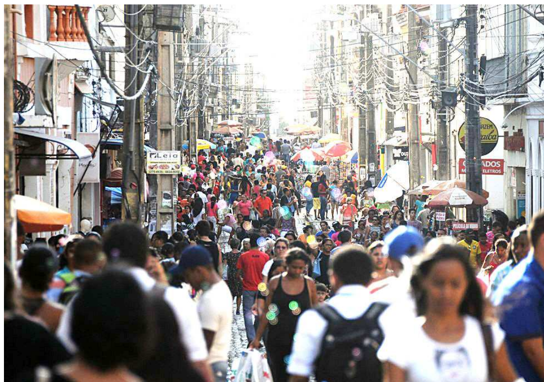
Comércio foi o setor que teve melhor desempenho no mercado de trabalho em setembro, segundo Caged

No entanto, no acumulado do ano, os números mantêm-se positivos. O levantamento