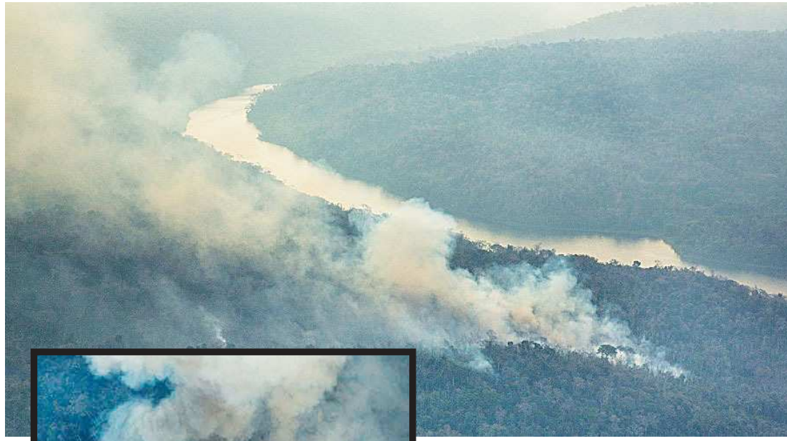
As chamas dos últimos dias preocupam as autoridades ambientais, que avaliam a necessidade de uma aeronave sobrevoar a área para se certificar da real dimensão do problema