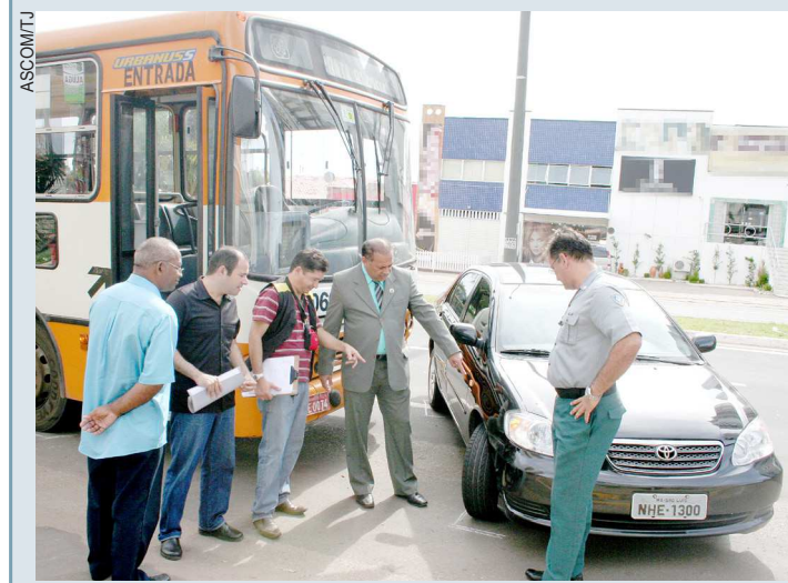
Juizado de Trânsito perícia, emite laudo e faz conciliação

Uma das partes liga para a unidade móvel. A equipe do Juizado realiza a perícia, emite laudo, promove a audiência de conciliação e o acordo entre as partes envolvidas. Caso haja entendimento, o conflito é resolvido na mesma hora. Não havendo, é levado à sede do Juizado, no bairro da Vila Palmeira, para o juiz sentenciar. A equipe do Juizado realiza, no local do acidente, perícia, laudo (verbal), audiência de conciliação e acordo entre as partes. O conflito é resolvido imediatamente caso haja acordo.