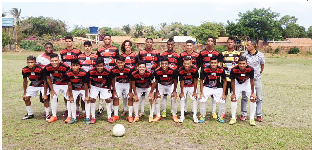
Time da categoria do futebol Sub-19 do Moto Club dá início a uma série de jogos amistosos no interior

A série de jogos amistosos vai prosseguir em outras cidades, como parte dos treinamentos da equipe que vai disputar a competição em território paulista. "Valorizar mais a prata da casa é uma das metas do Moto em 2018, até porque sabemos que o Maranhão tem revelado um grande número de jogadores que estão em atividade fora do estado e em grandes clubes do país porque não