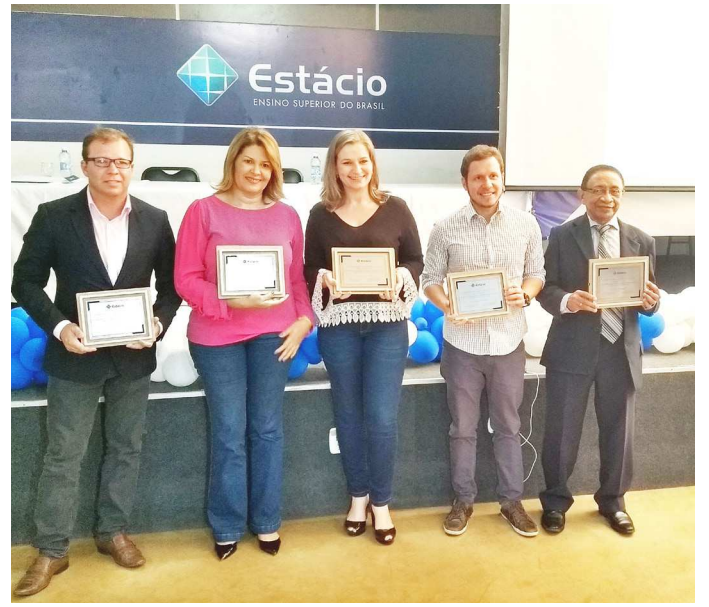
Além das premiações, o evento discutiu as transformações do setor