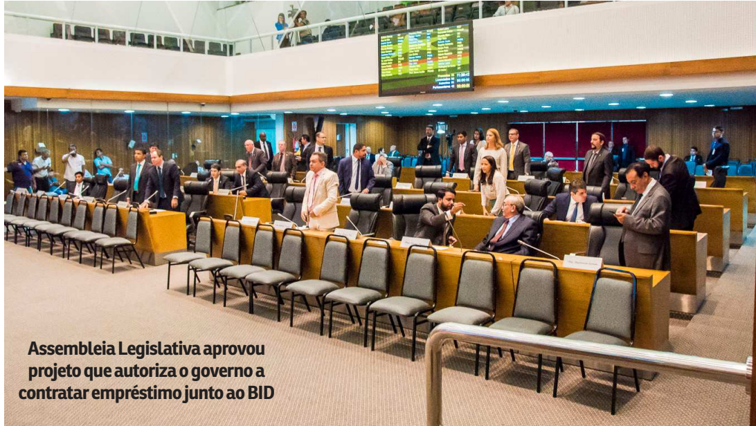
Assembleia Legislativa aprovou projeto que autoriza o governo a contratar empréstimo junto ao BID

O objetivo do Profisco II é possibilitar ao Maranhão reduzir, cada vez mais, a exigência de as empresas apresentarem as chamadas obrigações acessórias, que são documentos nos quais as empresas declaram as suas obrigações com o Fisco. Isso significa redução de gastos e tempo por parte das empresas. Com a documentação eletrônica, o processo fica mais ágil e com custos muito menores. Para desencadear o Profisco