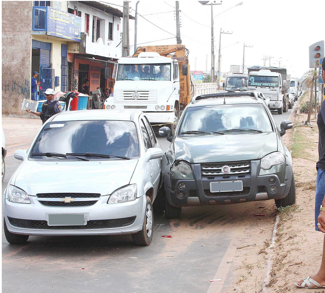
Ocorrências de acidentes sem vítimas podem ser resolvidas solicitando o serviço móvel do Juizado de Trânsito