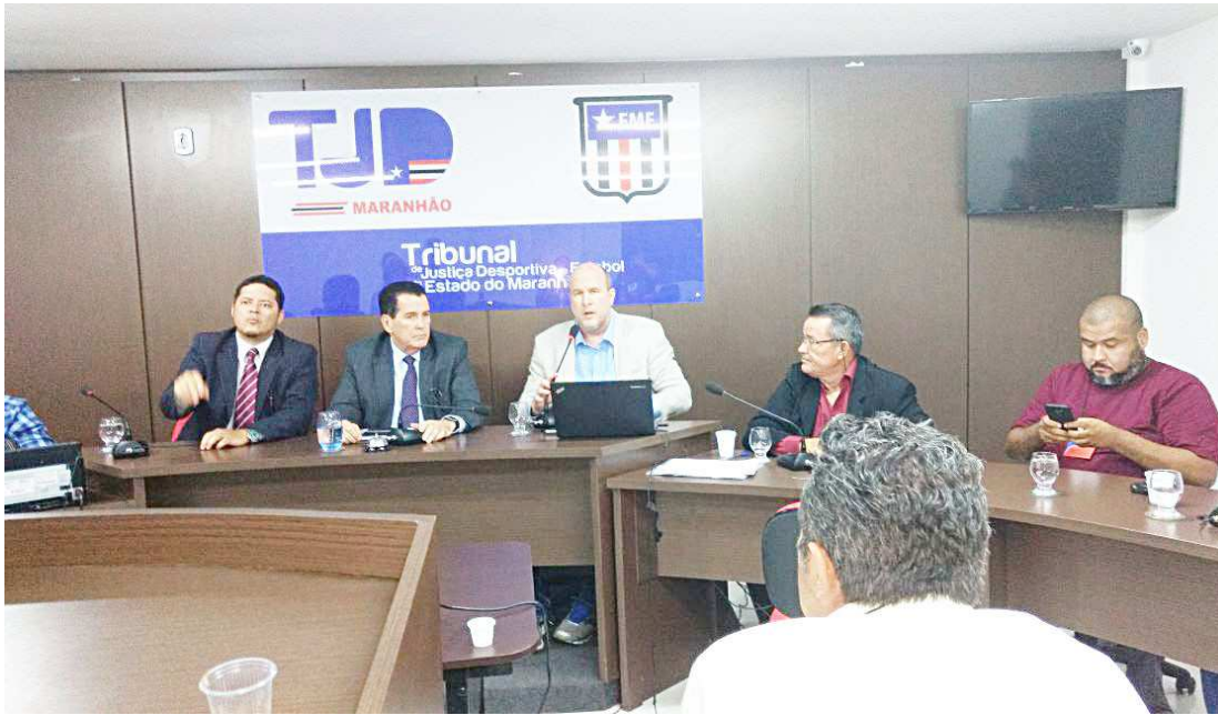
Federação se reuniu com dirigentes de clubes e apresentou proposta do regulamento do Campeonato Estadual

Como já havia sido aprovada no primeiro encontro, a fórmula de disputa será de apenas um turno classificatório (primeira fase), em que os clubes disputarão entre si, no sistema só de ida, totalizando sete jogos para cada time,