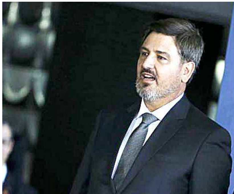
Segóvia disse que PGR teria se precipitado quando Janot denunciou Michel Temer

Fernando Segóvia disse ainda que recebeu carta branca do presidente da República, Michel Temer, para desempenhar sua nova missão e disse que atuará de forma "republicana", sem posicionamento político-partidário.