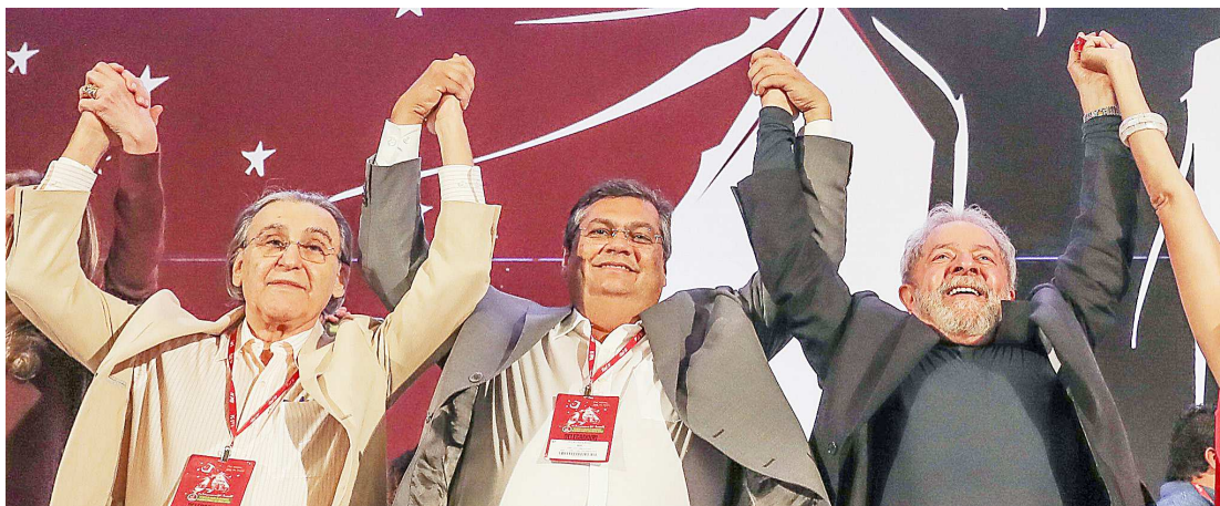
Congresso do PCdoB deste ano fortaleceu relação entre o governador Flávio Dino e o ex-presidente Lula