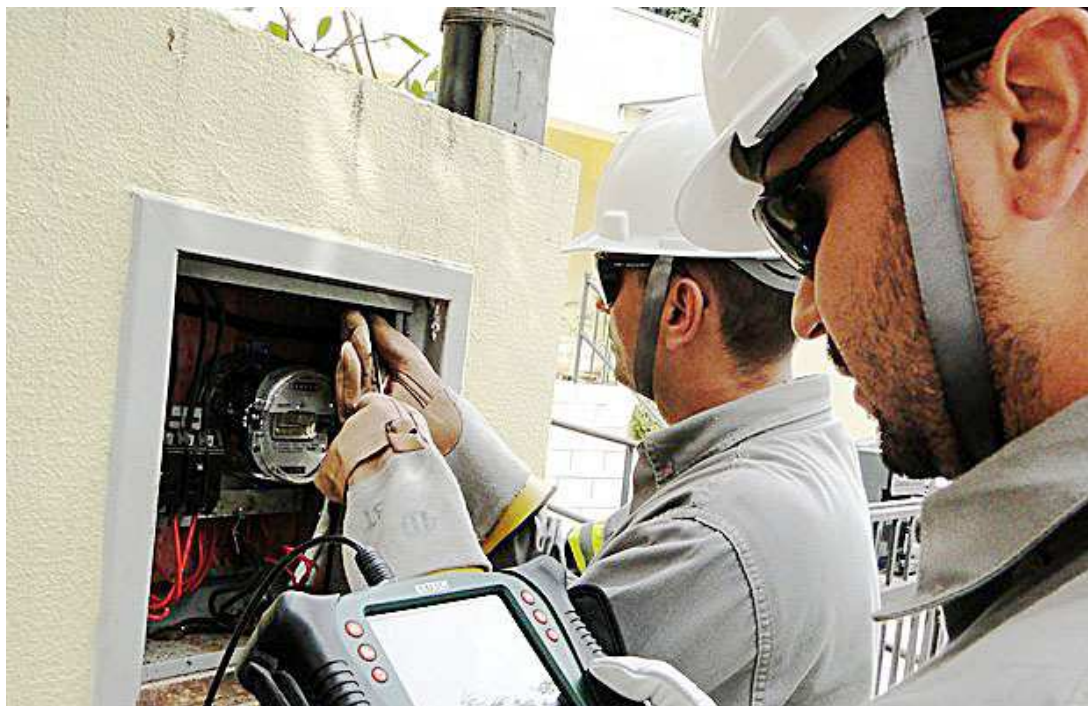
Após a irregularidade ser constatada, o consumidor tem direito a se defender em processo administrativo

Para os procuradores, o não pagamento das faturas deve, "impreterivelmente, acarretar a suspensão do serviço à unidade consumidora que, mediante emprego de meio que configura ilícito penal, gozou da prestação de um serviço público sem a devida contrapartida".