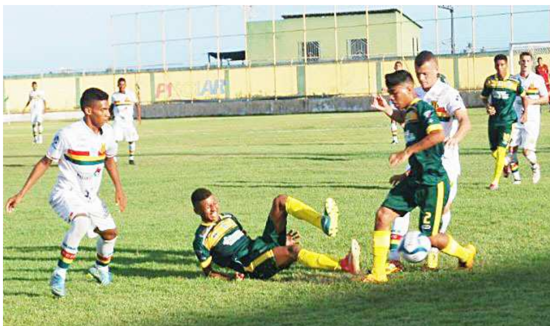
Depois do empate com a equipe da Campinense-PB, Sub-20 tricolor volta a campo hoje, a partir das 15h

Os jogadores do Sampaio reclamam ainda de duas penalidades máximas não marcadas pela arbitragem, pois acreditam que poderiam sair de campo com a vitória.