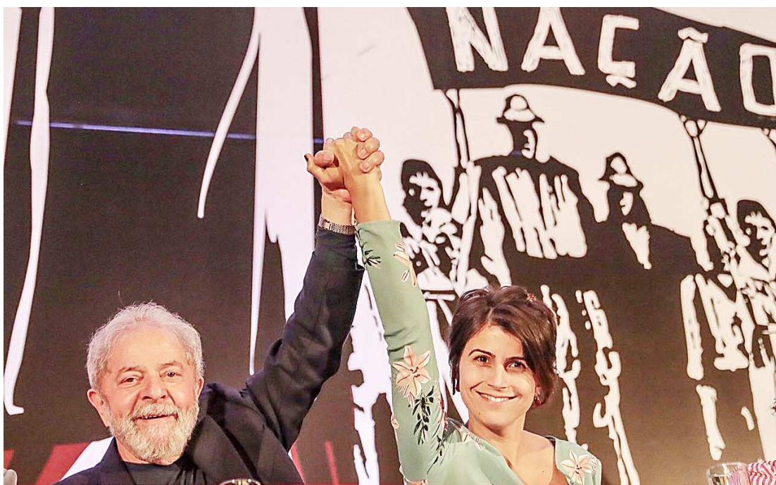
Lula sinaliza que pré-candidata do PCdoB, Manuela D’Ávila, pode ser o melhor caminho para o país em 2018