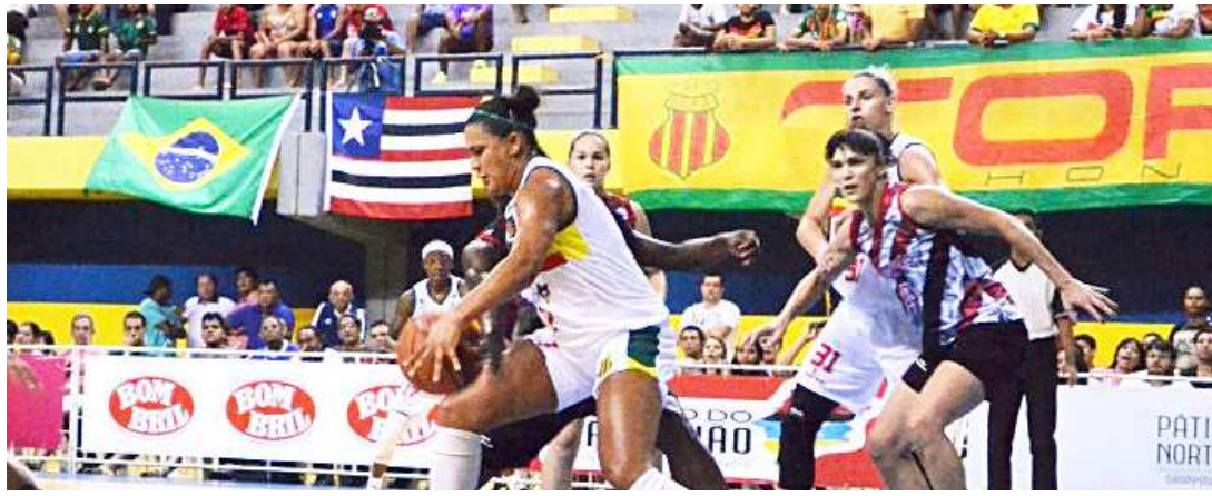
O Sampaio Basquete estreia no dia 16 de janeiro contra o Uninassau-PE, dentro de casa

O Sampaio Basquete estreia no dia 16 de janeiro contra o Uninassau-PE, dentro de casa. O Tricolor fará as três primeiras partidas em São Luís.