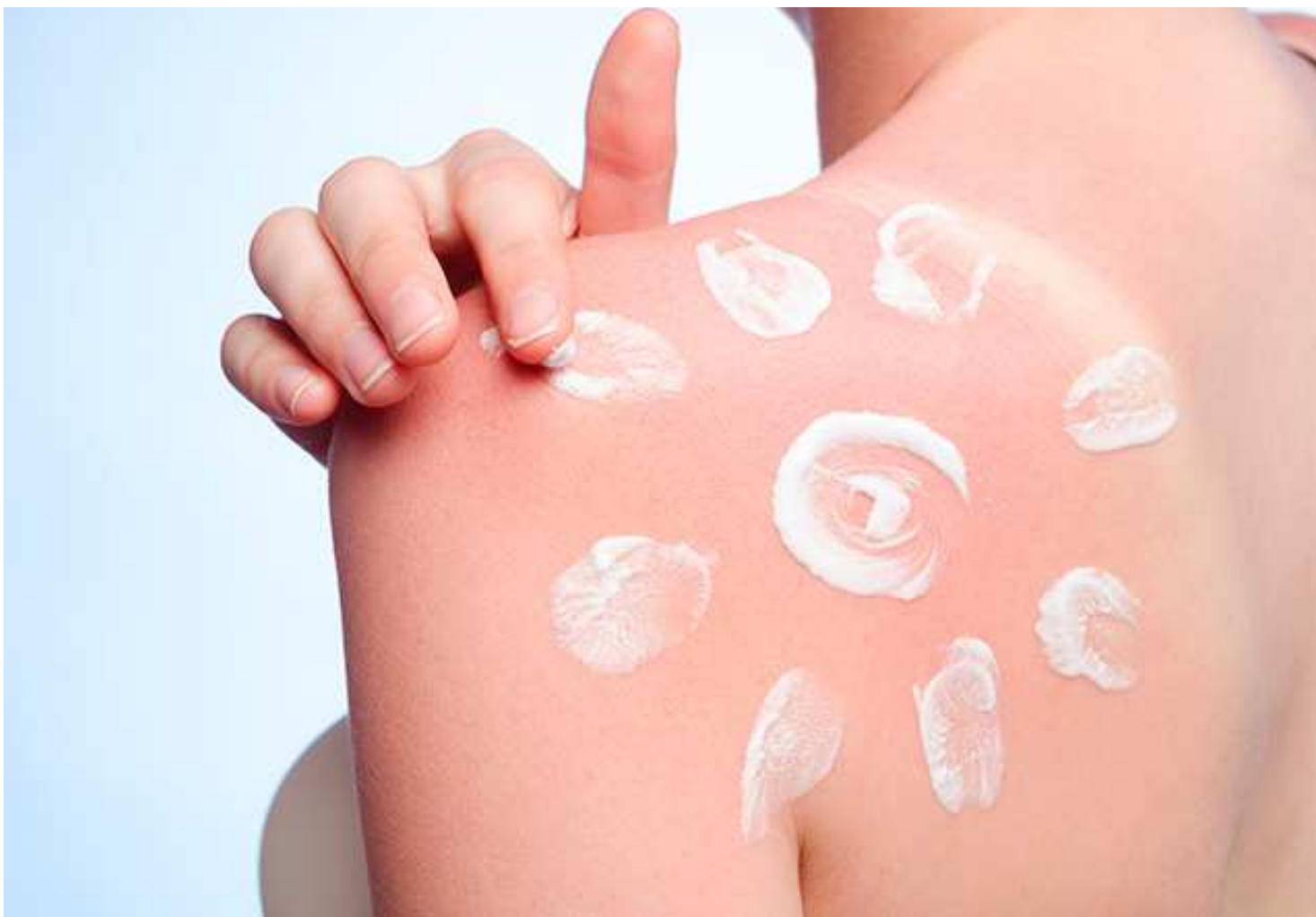
Pessoas de pele clara, sensível à ação dos raios solares, ou com doenças cutâneas prévias são as principais vítimas do câncer de pele

A campanha deste ano tem foco, principalmente, nos trabalhadores que desempenham suas atividades expostos ao sol. Entre as recomendações da Sociedade Brasileira de Dermatologia, está o uso corriqueiro de equipamentos de proteção individual (EPIs), como chapéus de abas largas, óculos escuros, roupas de cubram boa parte do corpo, protetores solares além da ingestão constante de água.