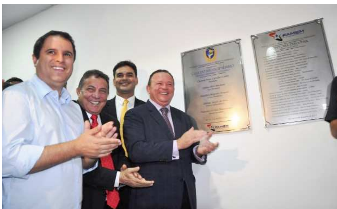
Ato do descerramento da placa de inauguração da nova sede da Famem reuniu diversos políticos

“Sou um admirador do trabalho do Tema. Nas outras oportunidades nas quais ele admi-