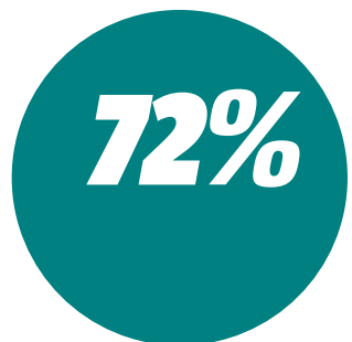
Margem de votos válidos do Hotel Abbeville na categoria Micro e Pequena Empresa

Na categoria Média Empresa se confirmou única selecionada para a final, que foi a empresa Shopping da Ilha. Na categoria Grande Empresa também foi confirmada a vitória da única empresa que foi classificada para a fase final, a Termaco Participações.