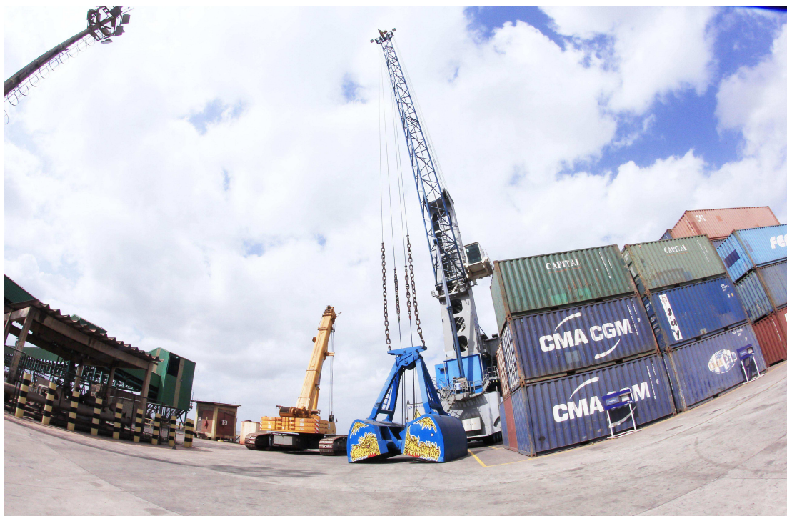
Investimentos possibilitam o crescimento e a modernização do Porto do Itaqui

A eficiência da gestão resultou em R$ 54,5 milhões de lucro e margem Ebitda de 42,0% no resultado acumulado em Nov/17. “Com foco na racionalidade dos gastos e otimização de receitas, estamos mantendo as condições para a permanente expansão e modernização das nossas atividades”, afirma o presidente.