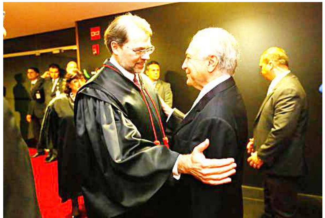
O mais recente diálogo de Michel Temer com Toffoli ocorreu em 19 de novembro, no Palácio da Alvorada

Na prática, Temer começou a se afastar de Cármen em maio, depois que vieram à tona as delações do empresário Joesley Batis-