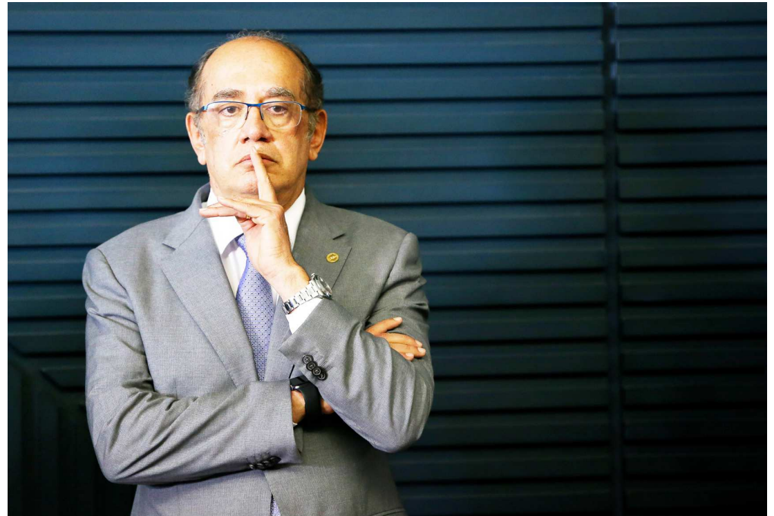
Em nota, a assessoria do ministro afirma que no áudio "são feitas graves acusações caluniosas à sua pessoa"

Em nota, a assessoria do ministro afirma que no áudio "são feitas graves acusações caluniosas à sua pessoa e às recentes decisões" e que "o ministro Gilmar reitera que suas decisões são pautadas pelo respeito às leis e à Constituição Federal".