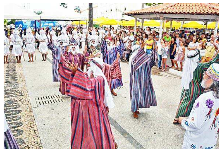
A Feirinha vem sendo realizada todos os domingos desde junho de 2017

"A Feirinha é um projeto incentivado pelo prefeito Eivaldo e que deu certo. A Prefeitura de São Luís vai realizar uma edição com apresentações para fazermos uma grande festa de pré-réveillon. Manteremos a comercialização da agricultura local, artesanato e gastrono-