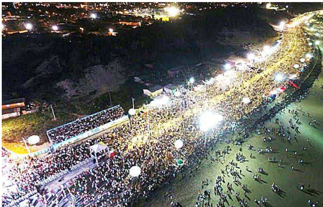
Na Avenida Litorânea, orla de São Luís, o palco dos shows estará localizado na altura da Rua Vale do Pimenta

O destaque da noite ficará por conta do cantor e compositor brasileiro Péricles, ex-vocalista do grupo Exaltasamba, e conhecido por grandes sucessos do samba, como Melhor Eu Ir, Costumes Iguais, Vai Por Mim e muito mais. "Para mim é um