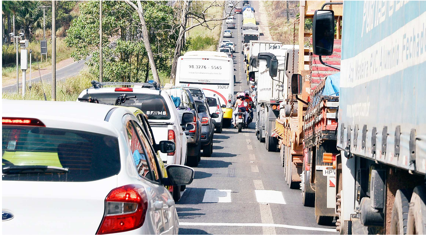
Movimento intenso de veículos nas estradas requer atenção às regras e normas de trânsito para garantir tranquilidade a condutores e pedestres

Dezembro é um período de maior volume de carros circulando pelas estradas por conta das festas de fim de ano e início das férias escolares. E, também costuma ser o mês de trânsito mais violento. Segundo o Observatório Nacional de Segurança Viária (ONSV), entre 2007 e 2014, foram contabilizados 818 óbitos em estradas federais na média nos meses de dezembro de cada um dos anos citados. Enquanto isso, o mesmo indicador aponta para uma média de 666 óbitos ocorridos ao longo de cada um dos demais meses – o que aponta para um crescimento de 23%.