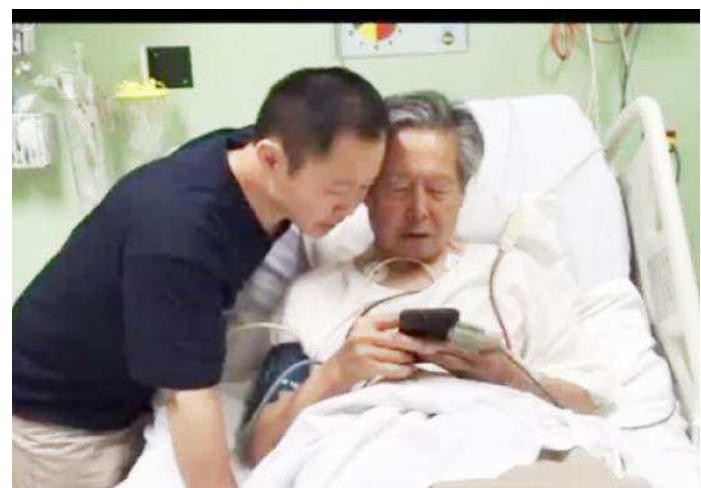
Fujimori foi levado da prisão para o hospital para tratar da pressão