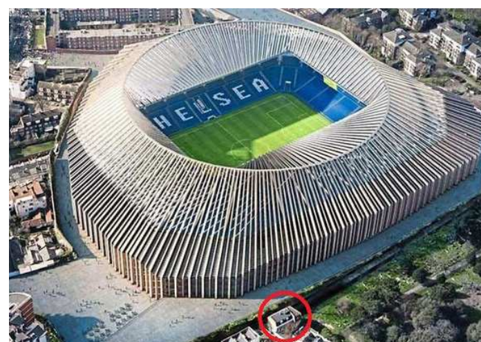
Pequena propriedade pode ameaçar o novo estádio do Chelsea

o nível de treinabilidade de cada um, prestar o auxílio médico e o aconselhamento científico às equipes técnicas, dando orientação contínua. A ideia é integrar as metodologias e técnicas científicas e médicas a um programa estruturado de treinamento e competição durante o ciclo. A comissão irá orientar e propor intervenções de longo e curto prazo que possam impactar na performance dos atletas e estratificar parâmetros para a base da ginástica artística nacional.