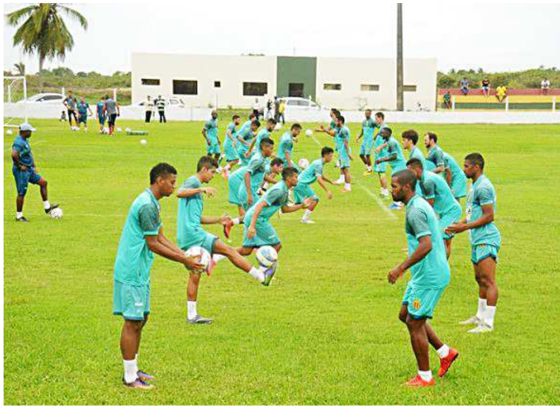
Jogadores do Sampaio Corrêa treinam para a estreia da Copa do Nordeste contra o CSA em Maceió