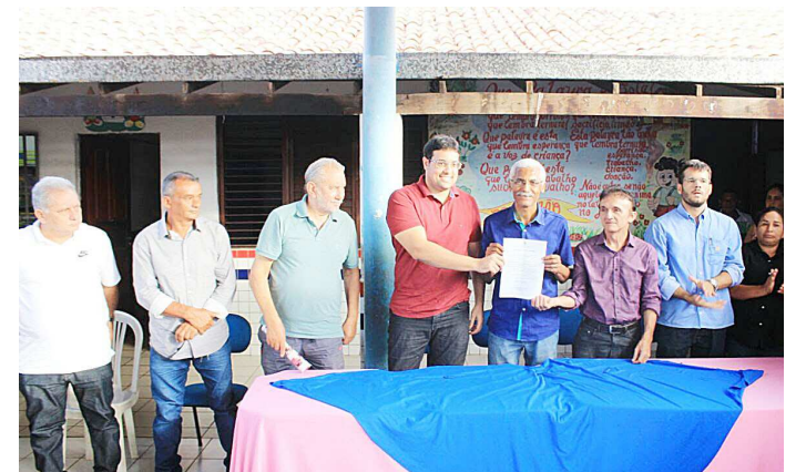
Prefeito de Paço do Lumiar participa de assinatura de ordem