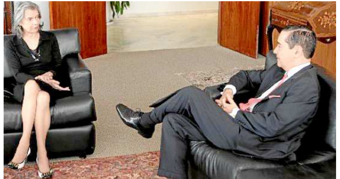
Desembargador Thompson Flores em reunião com ministra Cármen Lúcia. Na pauta: segurança e ameaças

O Ministério Público afirma que o imóvel teria sido repa-