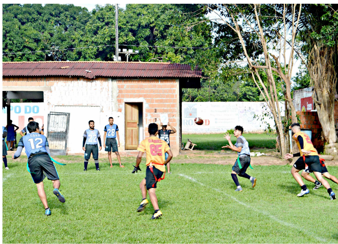
Atletas do Imperatriz Riversides enfrentam o time do Araguaína Cowboys na decisão do triangular

Na segunda partida do triangular de pontos corridos, o Imperatriz Titans enfrentou o Araguaína Cowboys, e a equipe do estado do Tocantins conseguiu o triunfo em cima do time imperatrizense. O placar final: Imperatriz Titans 20 x 35 Araguaína Cowboys. Para decidir o campeonato, os Riversides e os Cowboys com a mesma