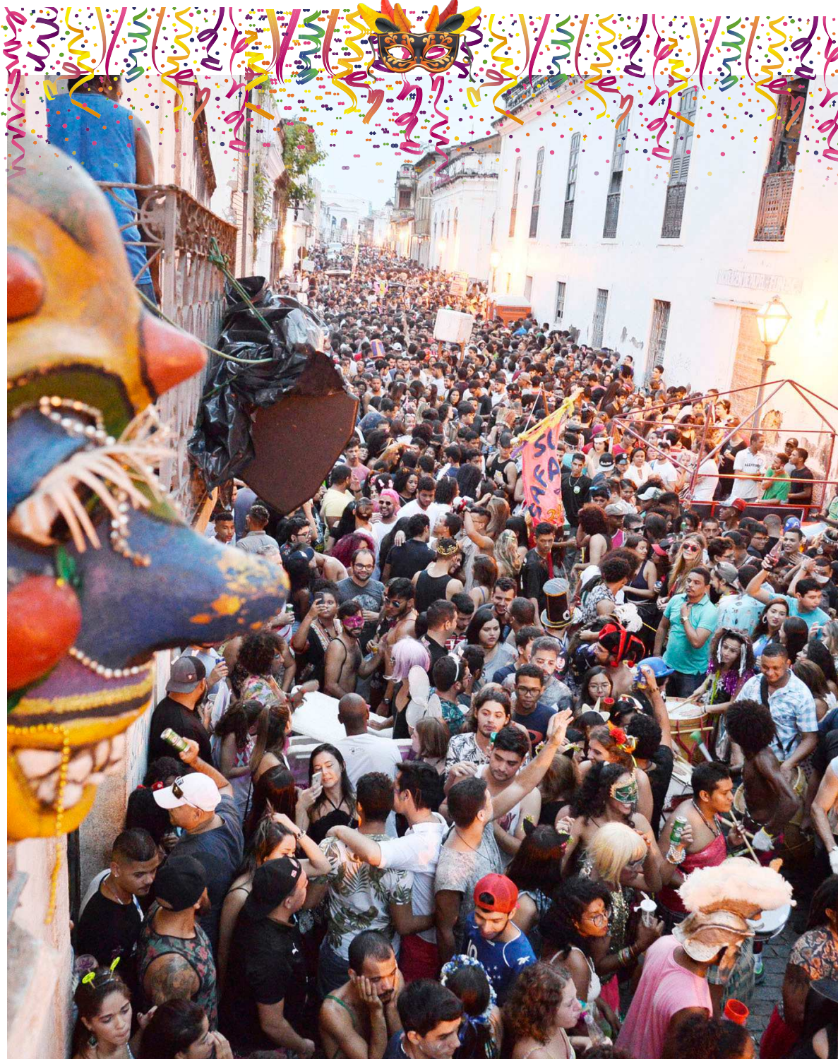
Blocos que circulam na área do Centro Histórico possuem licença e permissões com roteiro pré-definido

Goleiro do Moto Club busca o seu sétimo título estadual e também manter a hegemonia como melhor da posição no estado. ESPORTES