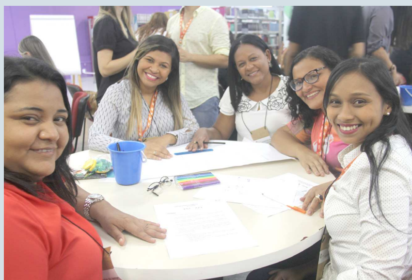
Equipe de professores do Dom Bosco