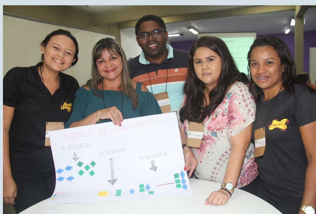
Equipe de professores do Dom Bosco