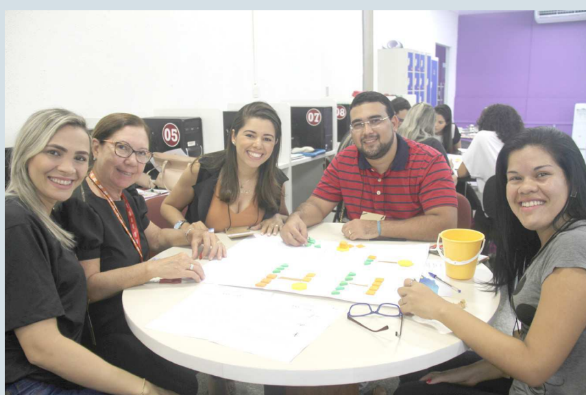
Equipe de professores do Dom Bosco