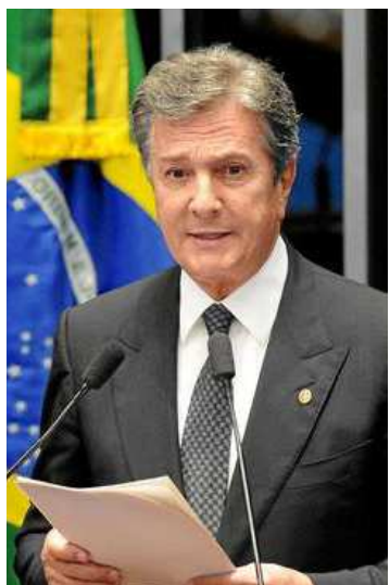
30/01/18