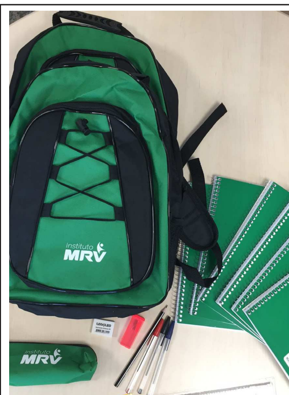
Kits escolares que estão sendo distribuídos a filhos de funcionários da construtora, pelo Instituto MRV