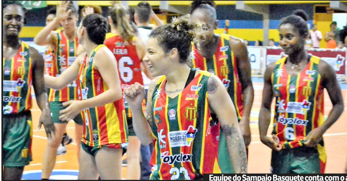
Equipe do Sampaio Basquete conta com o apoio da torcida para seguir 100% na LBF Caixa