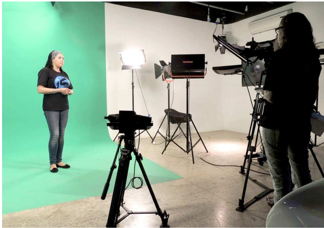
Aluna da Uema participa de curso digital gratuito como qualificação para mercado de trabalho

Os cursos são em Tecnologia e informação, Lógica de Programação, Multimídia em Educação, Psicologia da Educação, Microbiologia dos Alimentos, Gestão Logística, Conceitos em Biodiversidade, Geografia Aplicada, Recursos Ambientais Aplicados ao Turismo, Planejamento Estratégico, Gestão em Agronegócios, Gerenciamento de Projetos, Direito Administrativo, Desenvolvimento Humano e Educação, Princípios de Mineração, Ética Profissional, Marketing e Varejo, Dificuldades de Aprendizagem, Gestão com Pessoas, Gestão Ambiental e Sustentabilidade, Relações Internacionais, Bioética e Negociação.