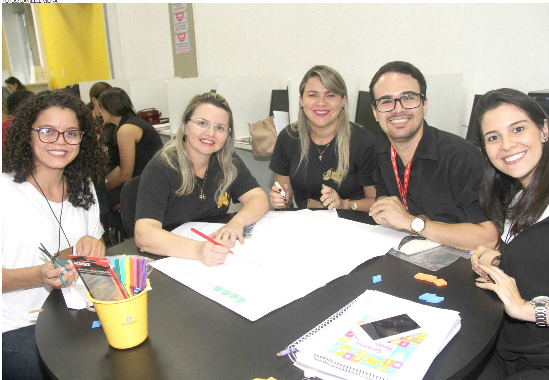
A equipe de professores do Colégio Dom Bosco