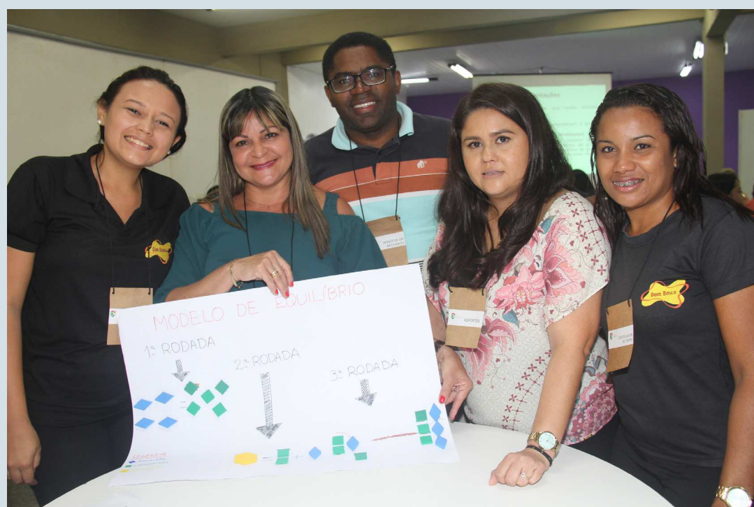
Equipe de professores do Dom Bosco