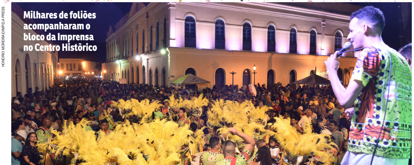
Milhares de foliões acompanharam o bloco da Imprensa no Centro Histórico