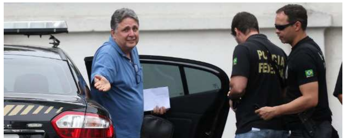
Por conta da agressão que sofreu, Garotinho foi transferido para o Presídio Bangu 8, na zona oeste do Rio

A perícia indicou ainda que conforme o exame das imagens "é possível concluir pela ina-