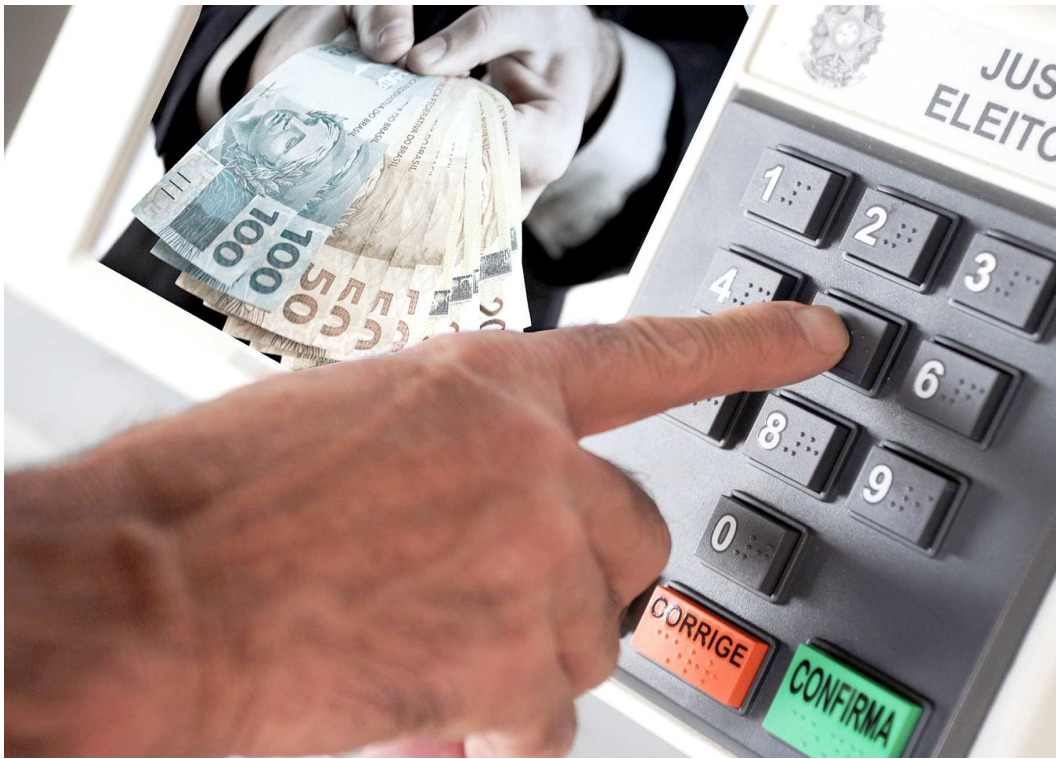
O financiamento empresarial era o ponto-chave de qualquer eleição no país