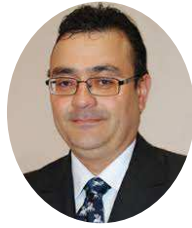
NEY BELLO DESEMBARGADOR FEDERAL, PROFESSOR NA UNB, PÓS-DOUTOR EM DIREITO E MEMBRO DA AML

Berlim existe em muitos imaginários judiciais. Em primeiro lugar porque lá estava o direito positivo, seguro, escrito e válido universalmente. Em segundo lugar, porque os juízes que lá viviam não se submetiam a nenhuma expressão de poder. Eles eram uma força autônoma e distinta dos outros dois poderes. O juiz não estava em Paris - terra dos legisladores - e não se via em Roma - a cidade tornada império.