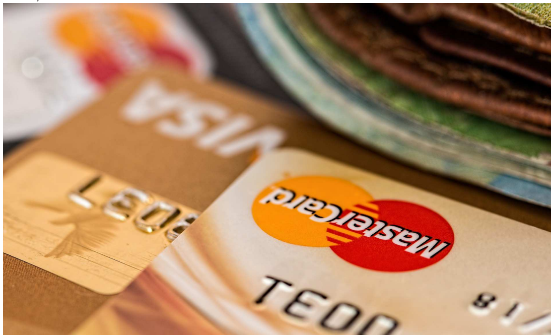
Crédito rotativo é usado pelo consumidor quando não paga o valor total da fatura do cartão

pontos percentuais. Em dezembro de 2016, era 519,7% ao ano.