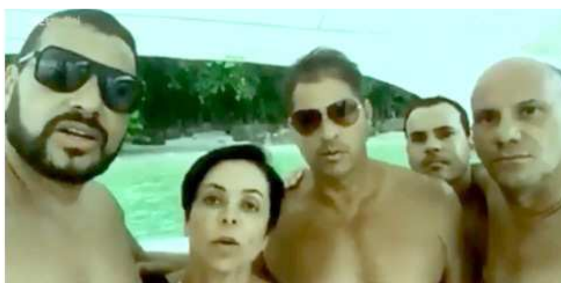
Sobre a filmagem, a deputada disse que a gravação e a divulgação do vídeo foram manifestações espontâneas

“Todo mundo tem direito de pedir qualquer coisa na Justiça. Todo mundo pode pedir qualquer coisa abstrata. (Mas) O negócio é o seguinte: ‘quem