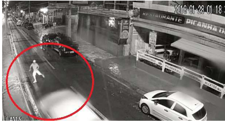
Pedestre foi atropelado na madrugada de domingo

local e testemunharam o atropelamento tentaram socorrer o homem. Socorristas do Serviço de Atendimento Móvel de Urgência (Samu) foram acionados, mas, quando chegaram ao local, a vítima, que seria um turista, já estava sem vida. O corpo ainda se encontrava no Instituto Médico Legal (IML), no Bacanga. O caso está sendo investigado pela equipe da Delegacia de Acidente de Trânsito (DAT), no Centro.