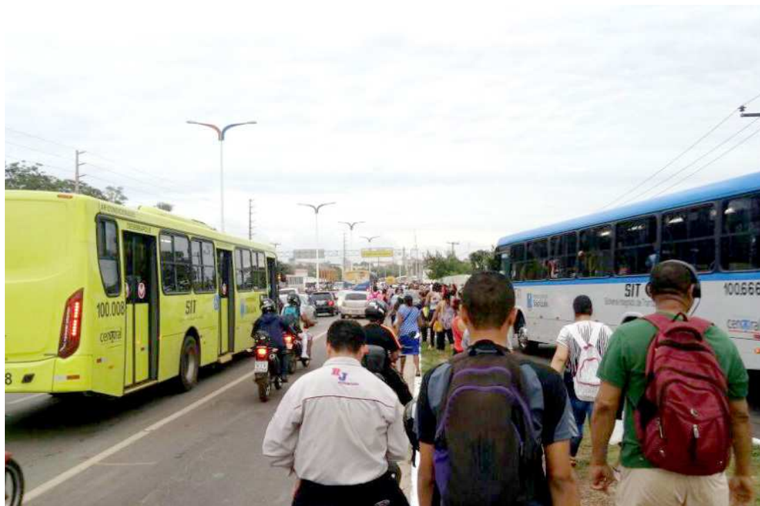
Lideranças comunitárias fecharam a barragem do Bacanga por duas horas na manhã de ontem

O protesto, que fechou em ambos os sentidos da Avenida dos Portugueses, reivindicava contra a tarifa única das passagens que está vigorando desde a última segunda-feira, 22. “Estamos aqui contra a inconstitu-