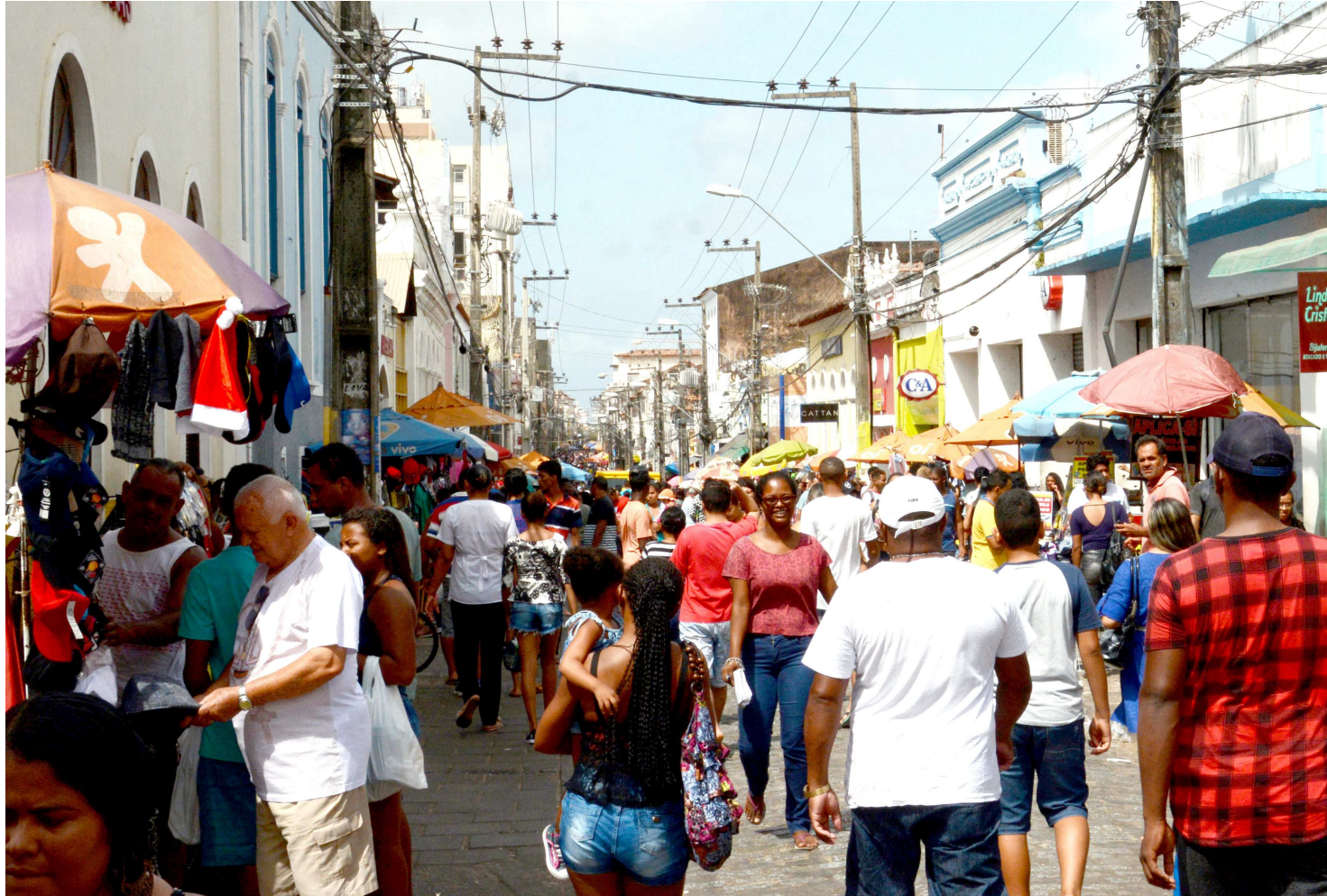
O setor que teve melhor resultado em todo o estado foi o de serviços, alavancado pelos municípios São Luís e Imperatriz