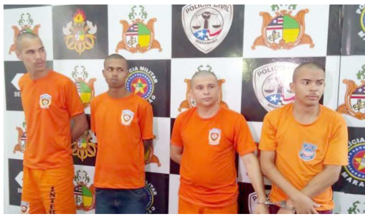
Quarteto é suspeito de praticar roubos e homicídio no estado