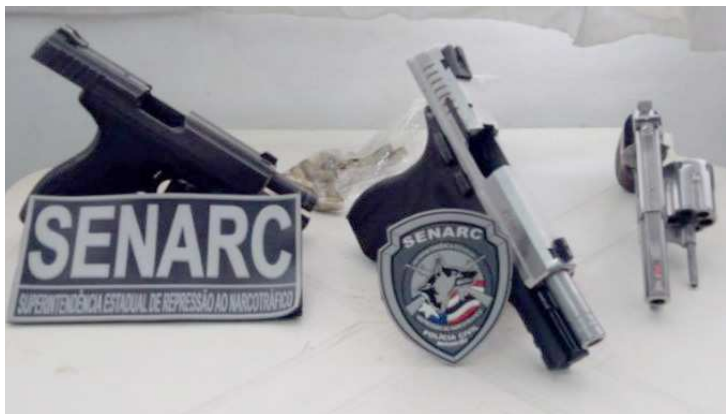
Grupo estava com a posse de arma de fogo de uso restrito

estava com Gago. "A Senarc já vem realizando algumas opera-