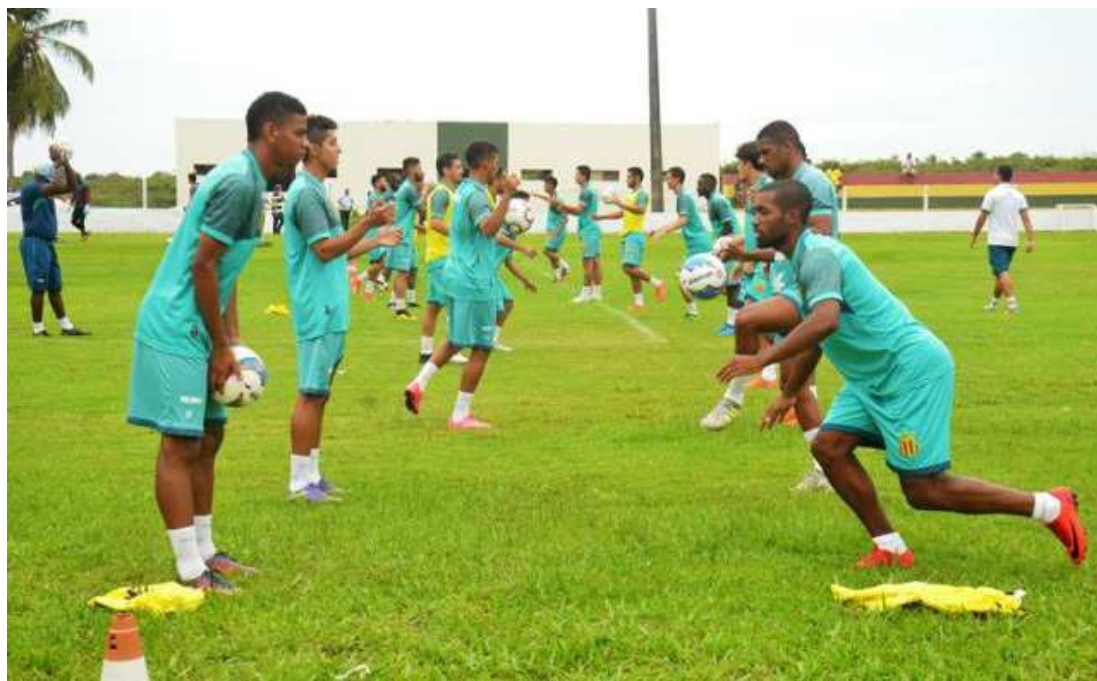
Jogadores do Sampaio que não viajaram realizaram treino no CT José Carlos Maceira ontem

“Vai ser um jogo difícil. A equipe adversária está descansada, esperando só nossa equipe ir para o jogo. Vamos ver o que temos de melhor para