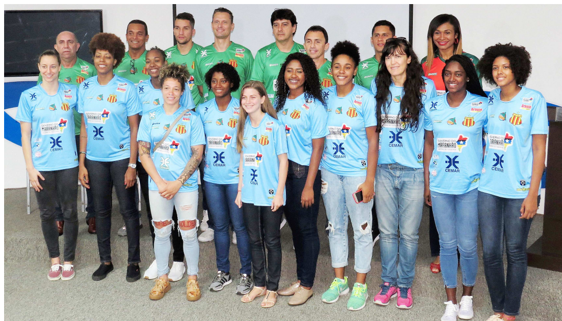
Atletas e comissão técnica do Sampaio Basquete participam de apresentação na sede da Cemar

“Vamos trabalhar muito nestes 15 dias que antecedem essa sequência de jogos. Nosso foco é no trabalho para conseguirmos bons resultados. A gente