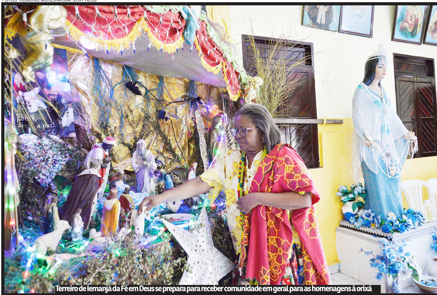
Terreiro de Iemanjá da Fé em Deus se prepara para receber comunidade em geral para as homenagens à orixá