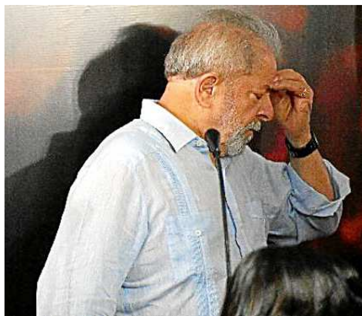
O PT quer reforçar o argumento de que “eleição sem Lula é fraude”

Política muitas vezes é jogo de cena, o ex-presidente e o PT sabem disso. Reforçar que é