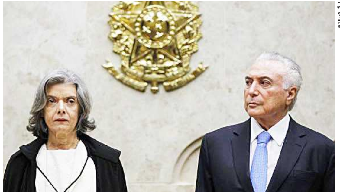
A cerimônia que marcou o retorno dos ministros às atividades contou com a presença do presidente Temer

Ainda no discurso, Carmém Lúcia ressaltou que o Judiciário não aplica a Justiça ideal e sim, a humana “posta à disposição para garantir a paz”. “Paz que é um equilíbrio no movimento histórico e contínuo entre os homens e as instituições”, disse.