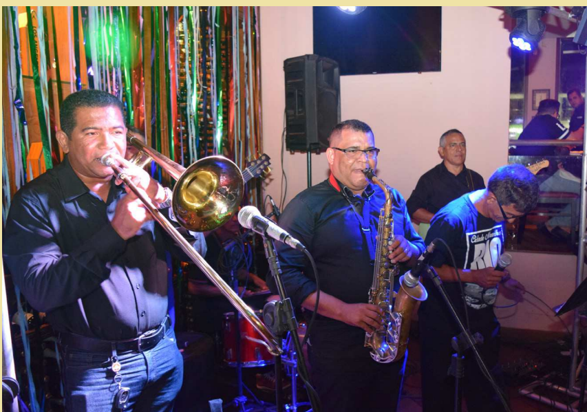
A banda "Sexteto Folia" mandou bem no repertório carnavalesco

A Gol Linhas Aéreas teve o menor número de reclamações por passageiros transportados em 2017, segundo pesquisa divulgada recentemente pela Agência Nacional de Aviação Civil (Anac). A empresa teve sete reclamações a cada 100 mil passageiros no ano passado. Em números absolutos, a companhia aérea recebeu quase 29,2 milhões de passageiros e teve apenas 2.178 reclamações.