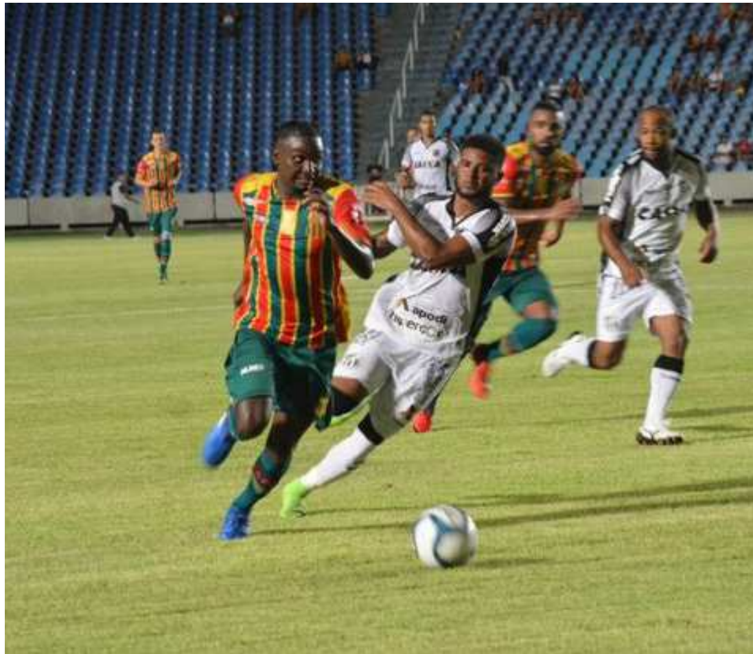
Lance de Sampaio 1x0 Ceará, jogo disputado na noite da última quinta-feira, no Estádio Castelão (São Luís)