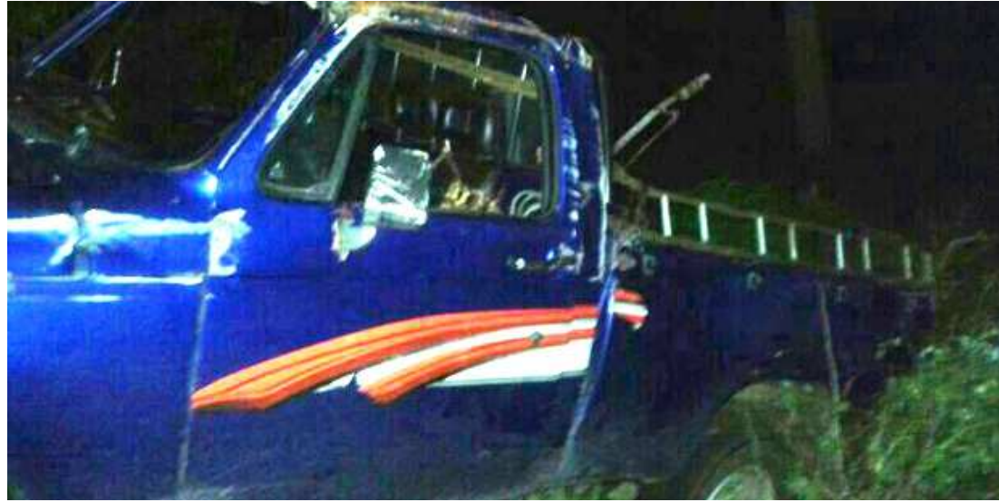
O veículo colidiu frontalmente com um caminhão, matando oito adolescentes e deixando os demais feridos