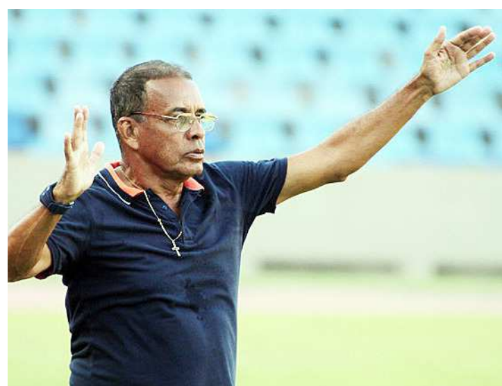
Meinha busca vitória para manter MAC na zona de classificação

O Bacabal, que até o momento só coleciona derrotas, precisa vencer para sair da incômoda posição de último colocado e começar a brigar para não voltar a cair para a segunda divisão.